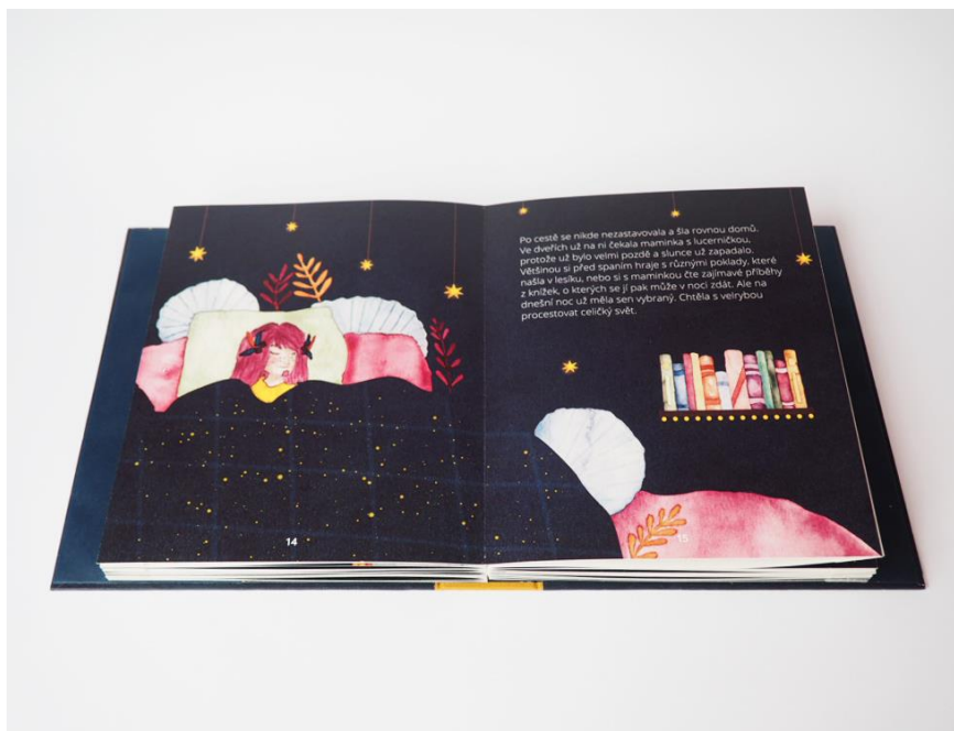
Příloha č. 8