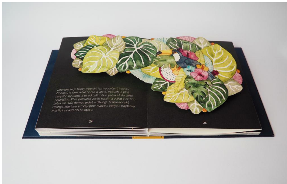
Příloha č. 9