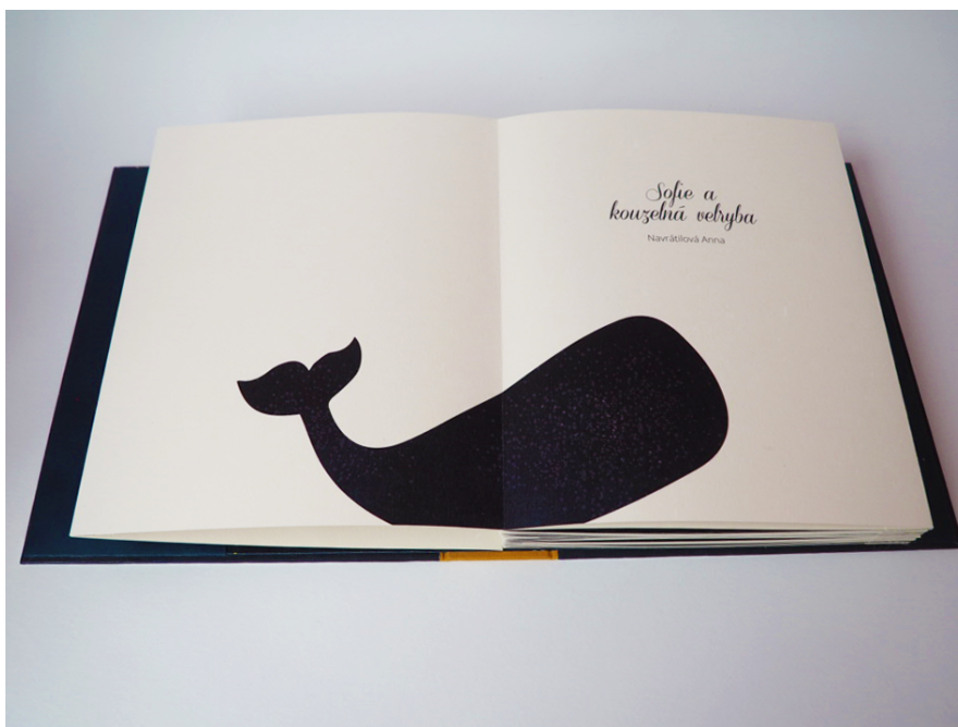
Příloha č. 5