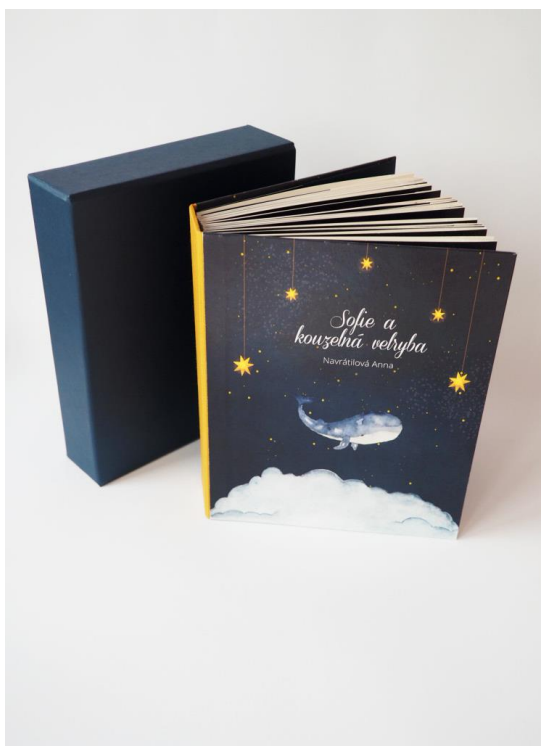
Příloha č. 3