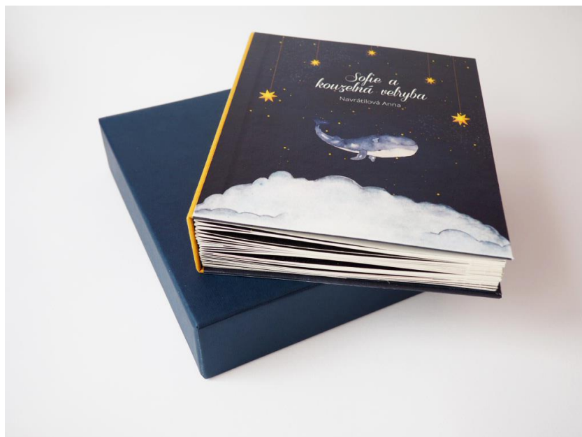
Příloha č. 1