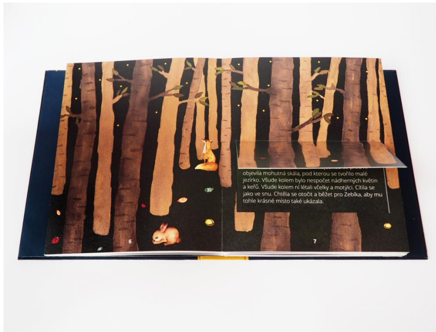
Příloha č. 7