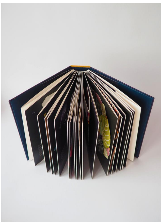
Příloha č. 4