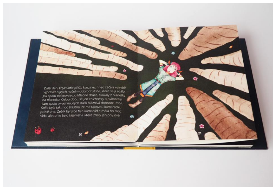
Příloha č. 10