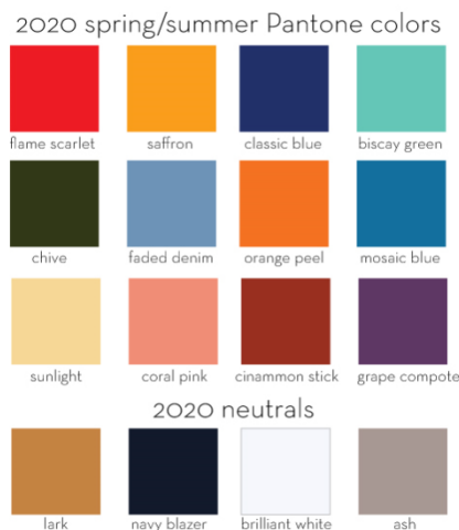
Obrázek 1: Pantone color SS 2019/20

Zde poprvé představují barvu roku „Classic blue“. Tato barva má podle popisu Pantone otevírat řadu možností a záměrně nás vede k pocitům a volnému prostoru k otázkám co máme očekávat v budoucnosti.