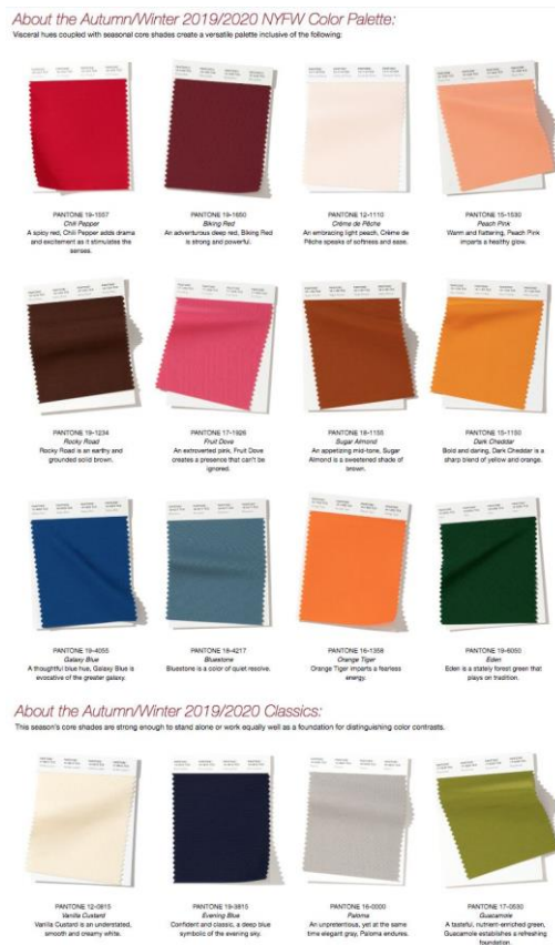
Obrázek 2: Pantone color A/W 2019/20