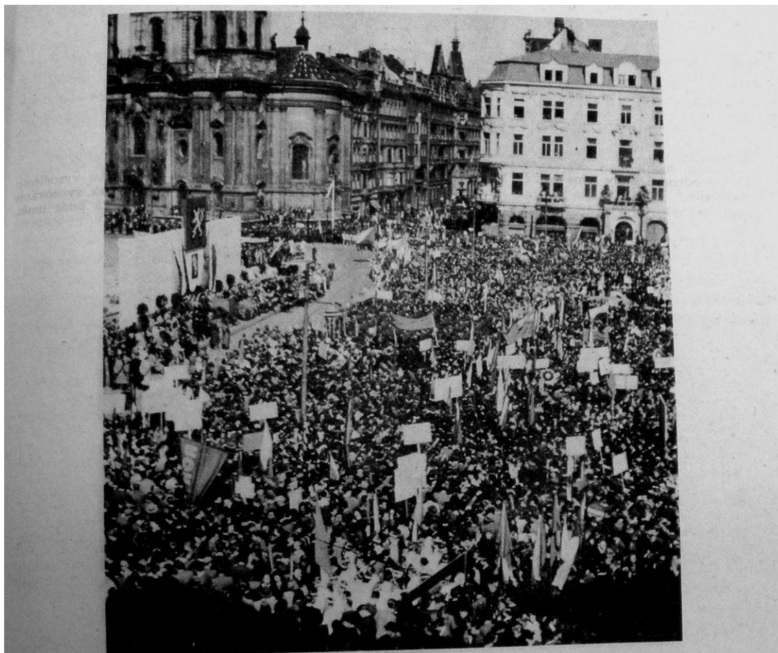
V pondělí dne 26. dubna 1948 se konalo v Praze na Staroměstském náměstí manifestační shromáždění pražských učitelů, profesorů a žáků škol všech druhů a stupňů. — Manifestací tou byl vyjádřen dík učitelstva a žactva vládě a poslancům ÚNS za nový zákon o jednotné škole.