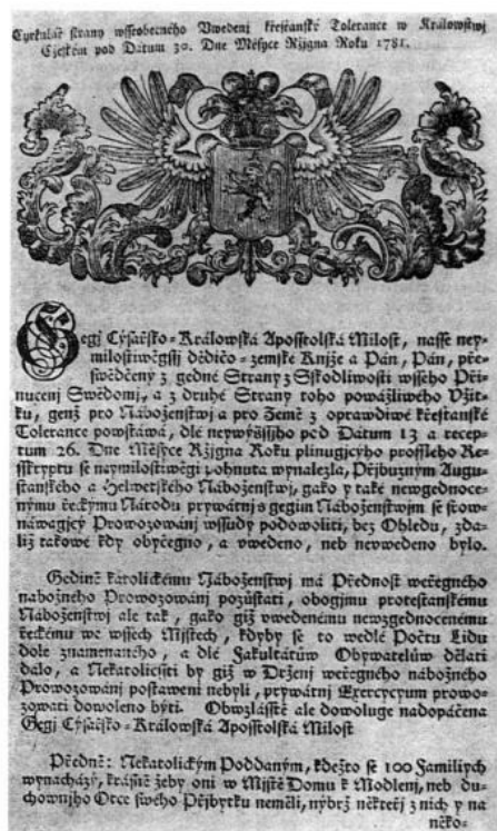
Obrázek č. 3 62

V prvním oddílu bylo nekatolickým poddaným povoleno, aby si postavili své modlitební domy, pokud jejich komunita dosahovala více než sto rodin. Zároveň jim bylo umožněno zakládat své vlastní školy. Modlitebny ovšem musely dodržovat předpisy týkající se převážně exteriéru budovy. Tato budovat nesměla připomínat církevní budovy. Na stavebách tedy nebyly povoleny žádné věže či zvony a nebyl umožněn vstup do budovy z ulice. Materiál na stavbu, administrativu a správu bohoslužeb mohli sami určovat tito nekatolíci, jelikož si zároveň nesli všechny náklady sami, bez příspěvků církve. Nekatolíkům bylo také nově umožňováno vykonávat veřejné pohřby, církevní obřady či svátosti za přítomnosti jejich duchovního. 63