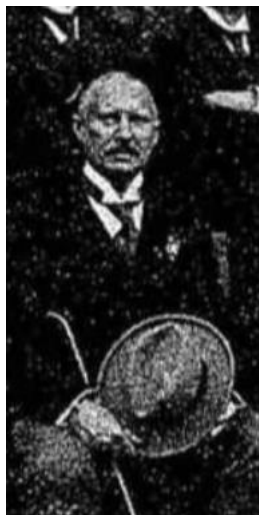
(Adolf Gerzabek v roce 1922)