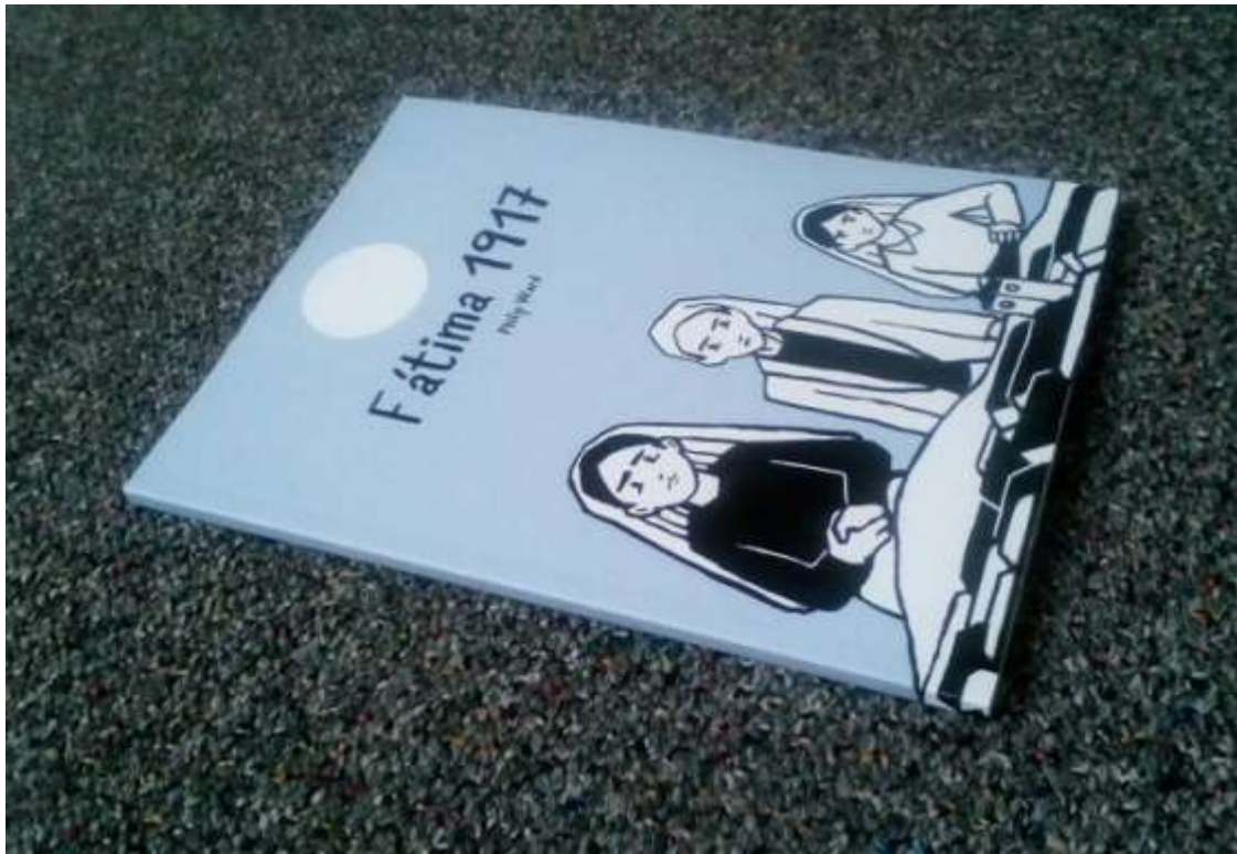
Finální produkt 1