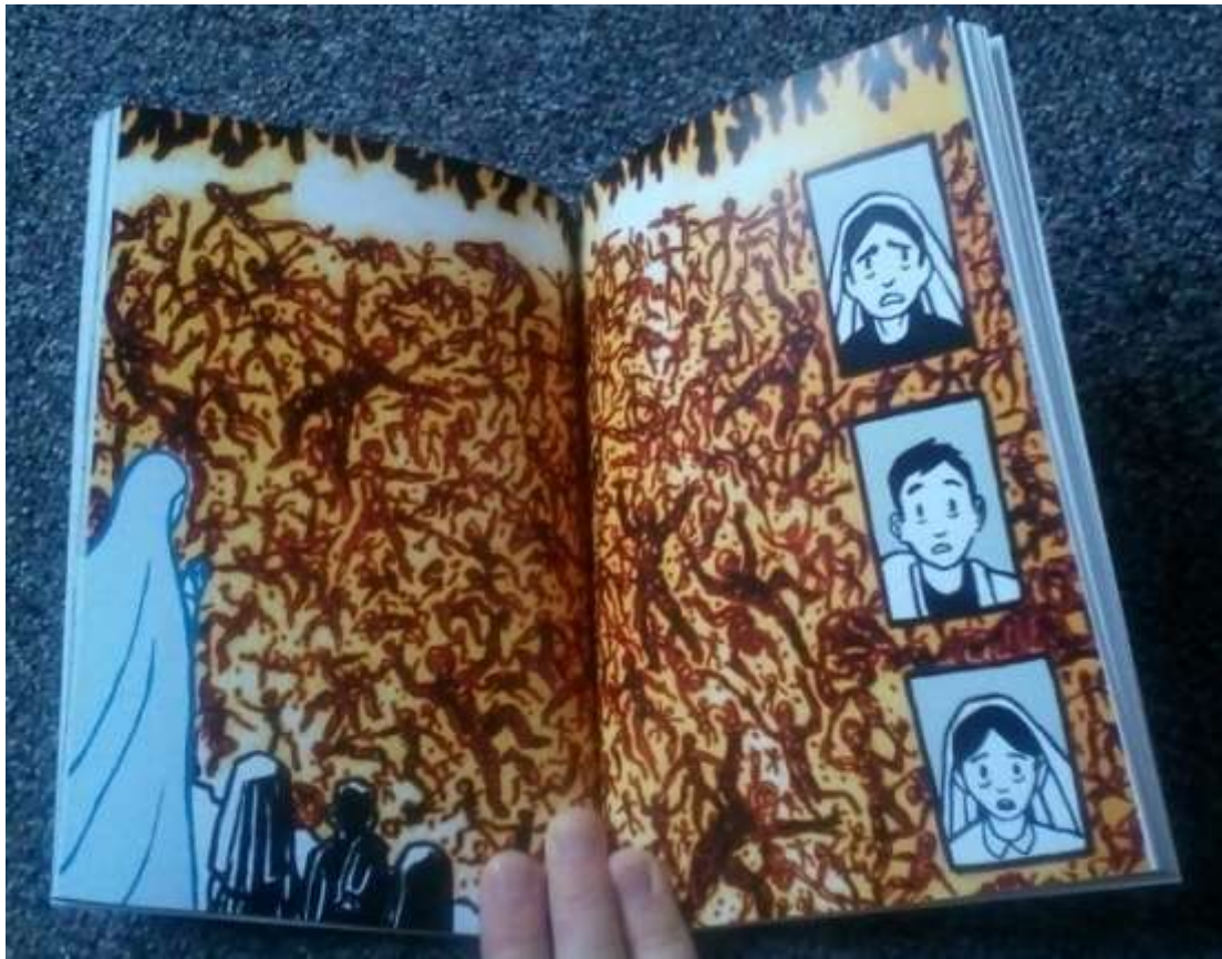
Finální produkt 3