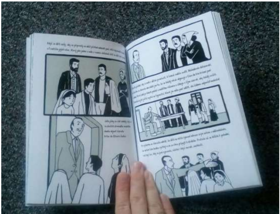
Finální produkt 2