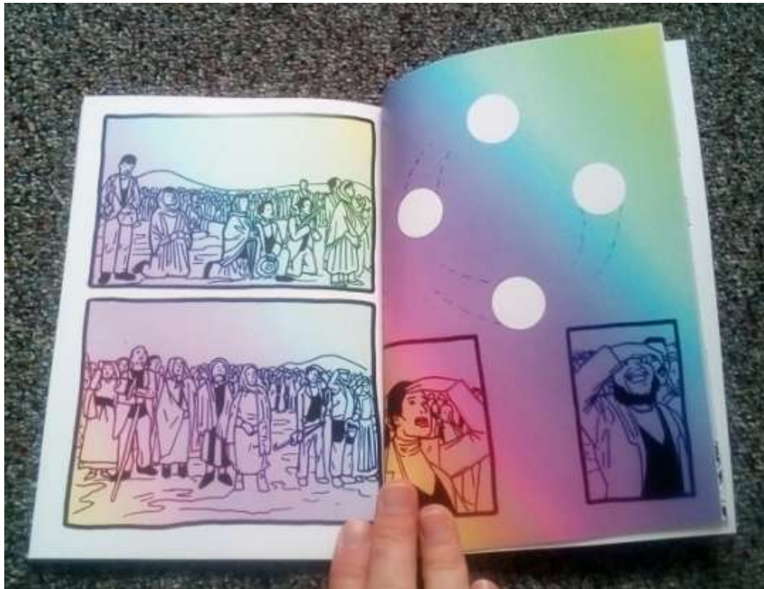
Finální produkt 6