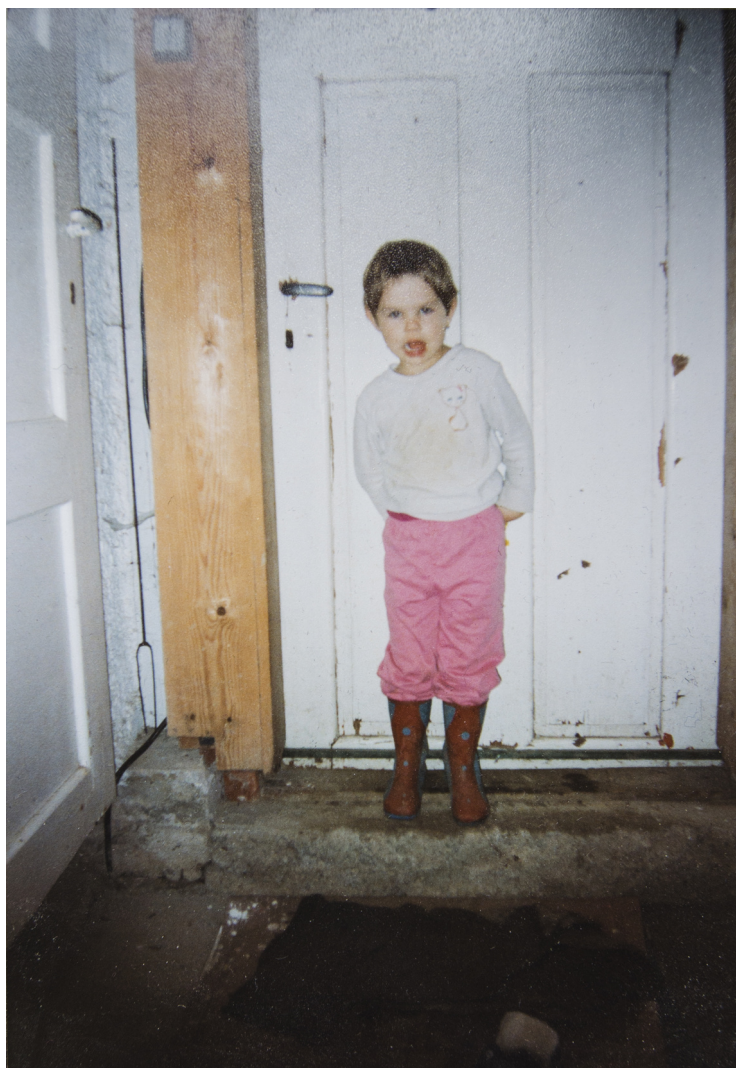
Obrázková příloha č. 8