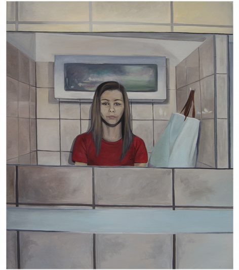
Obrázková příloha č. 2