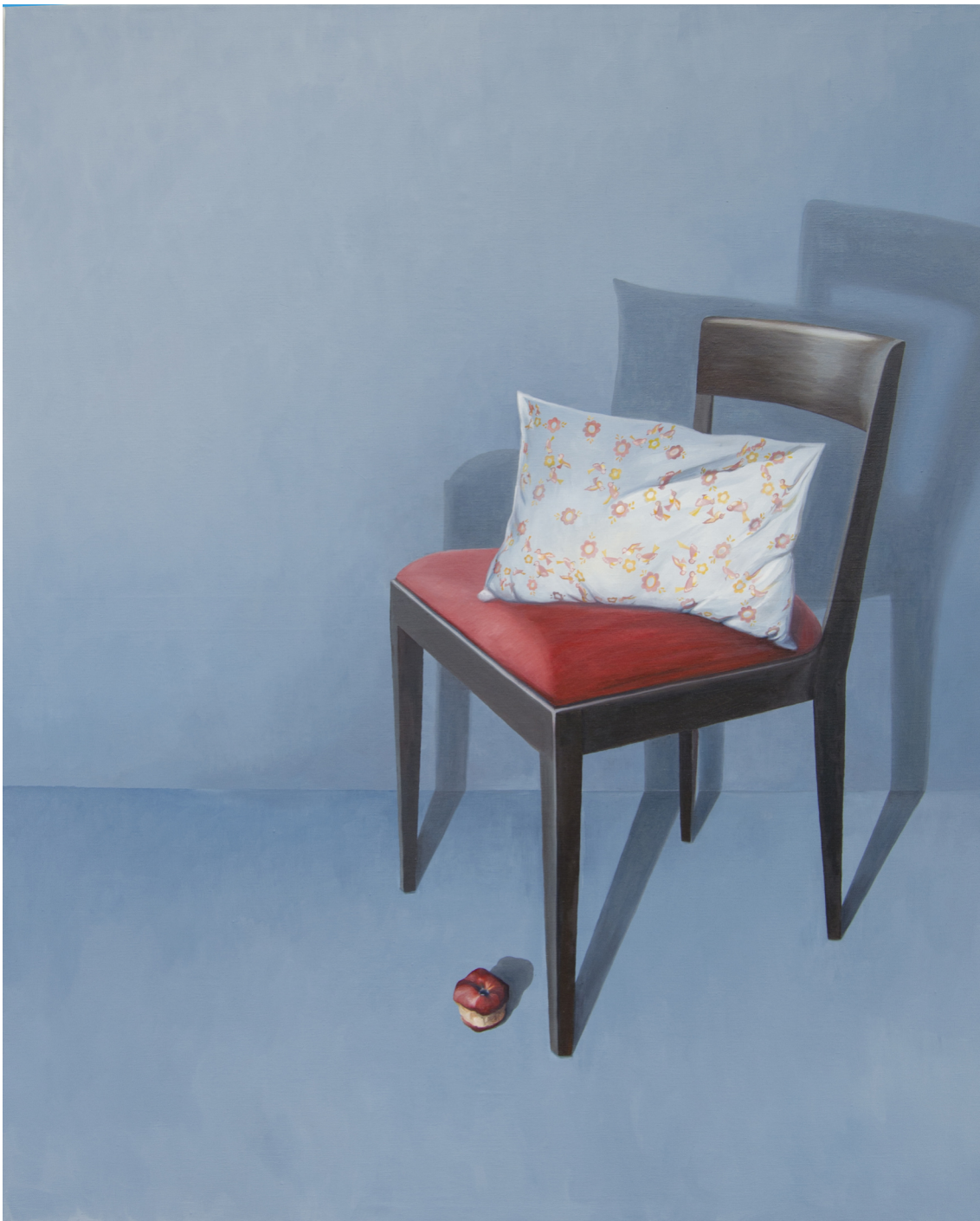
Obrázková příloha č. 4