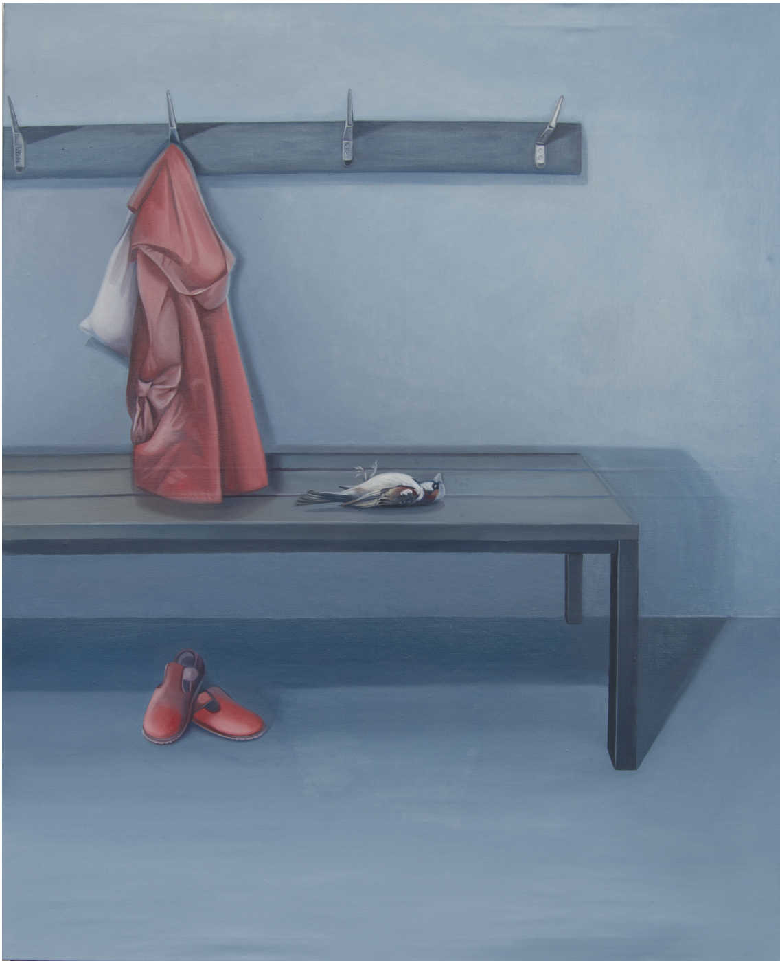
Obrázková příloha č. 6