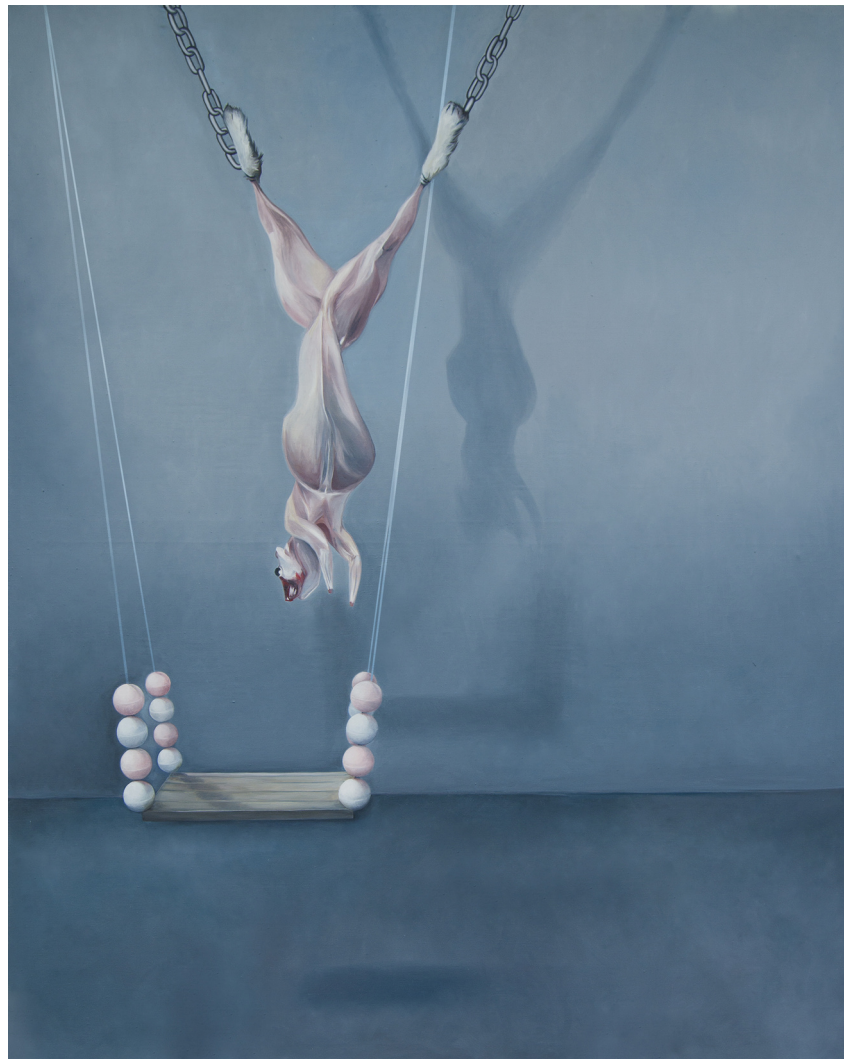
Obrázková příloha č. 3