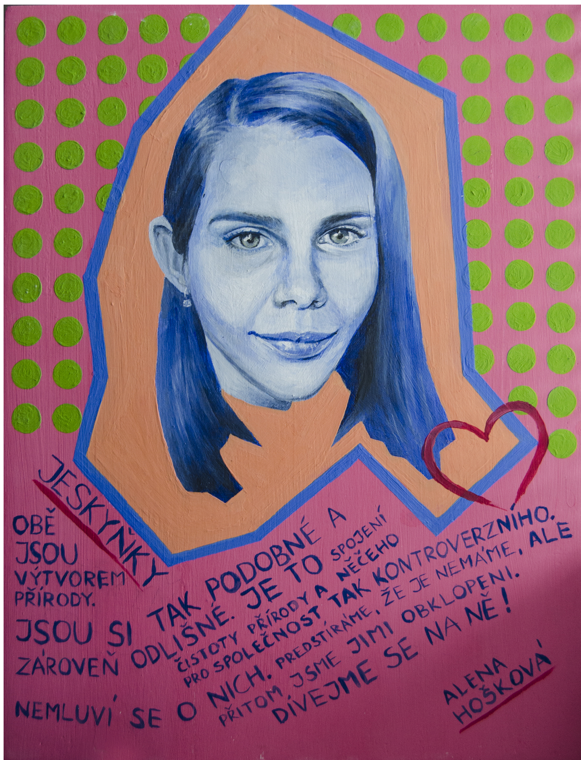
Obrázková příloha č. 1