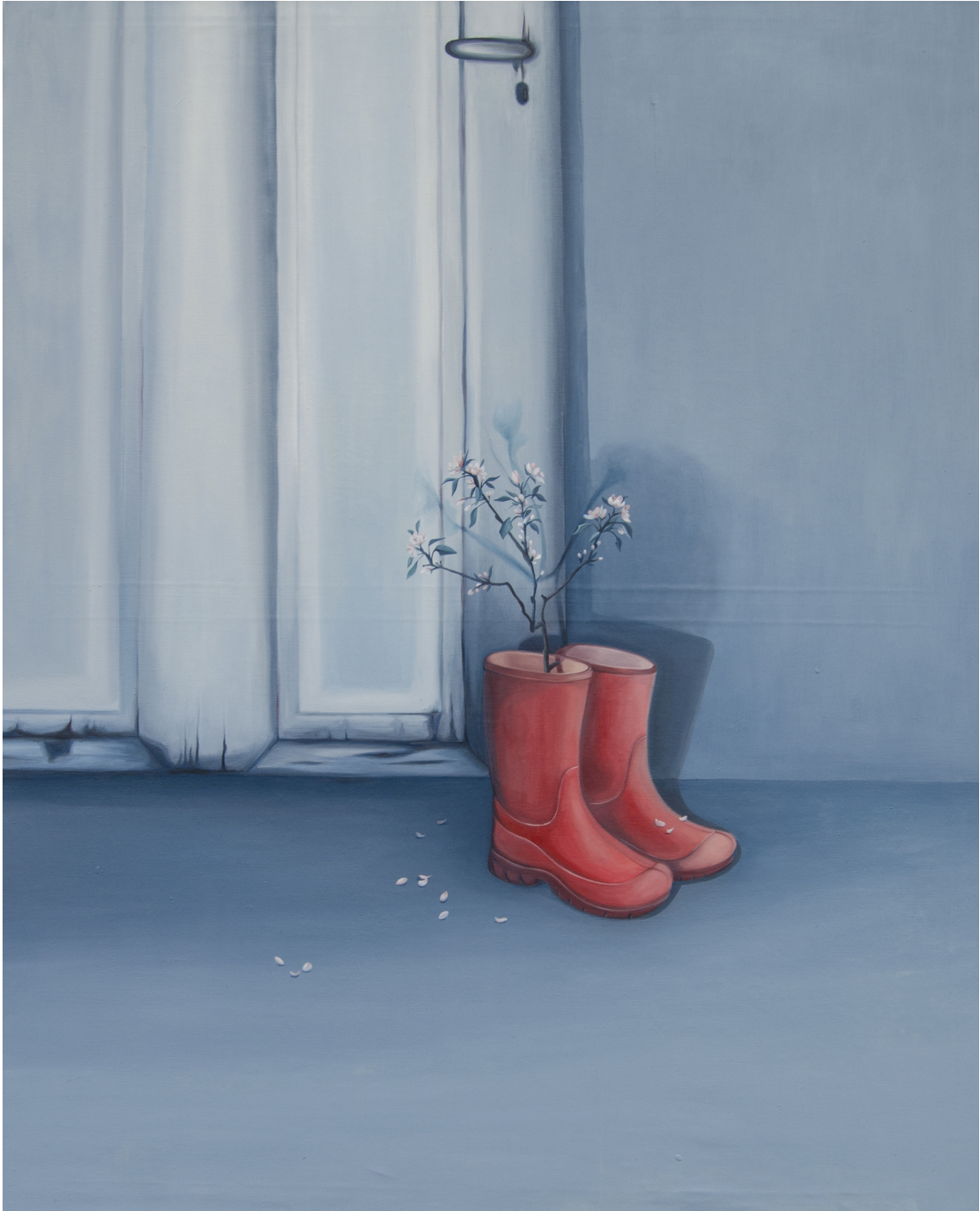
Obrázková příloha č. 7