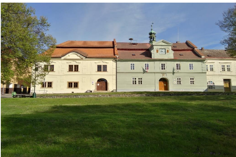
Obrázek 4: Muzeum a radnice 442