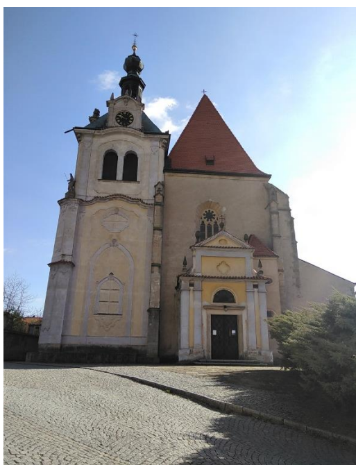
Obrázek 6: Kostel svatého Petra a Pavla 444