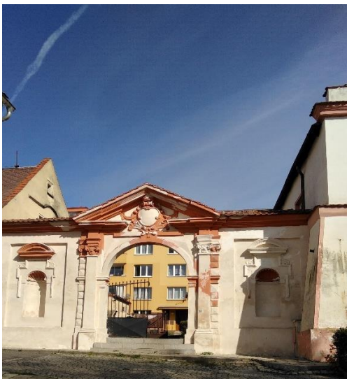
Obrázek 3: Zámecká brána 441