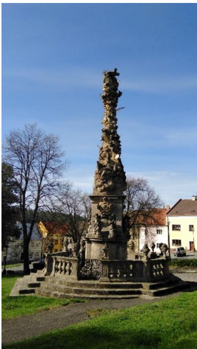
Obrázek 7: Sloup Nejsvětější Trojice 445