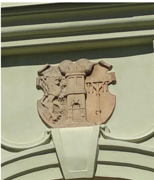
Obrázek 8: Znak města 446