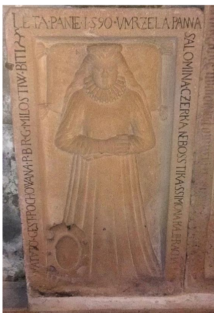
Obrázek 1: Náhrobek Salomina 439