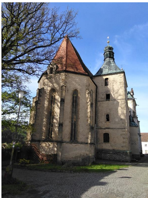
Obrázek 5: Kostel svatého Petra a Pavla 443