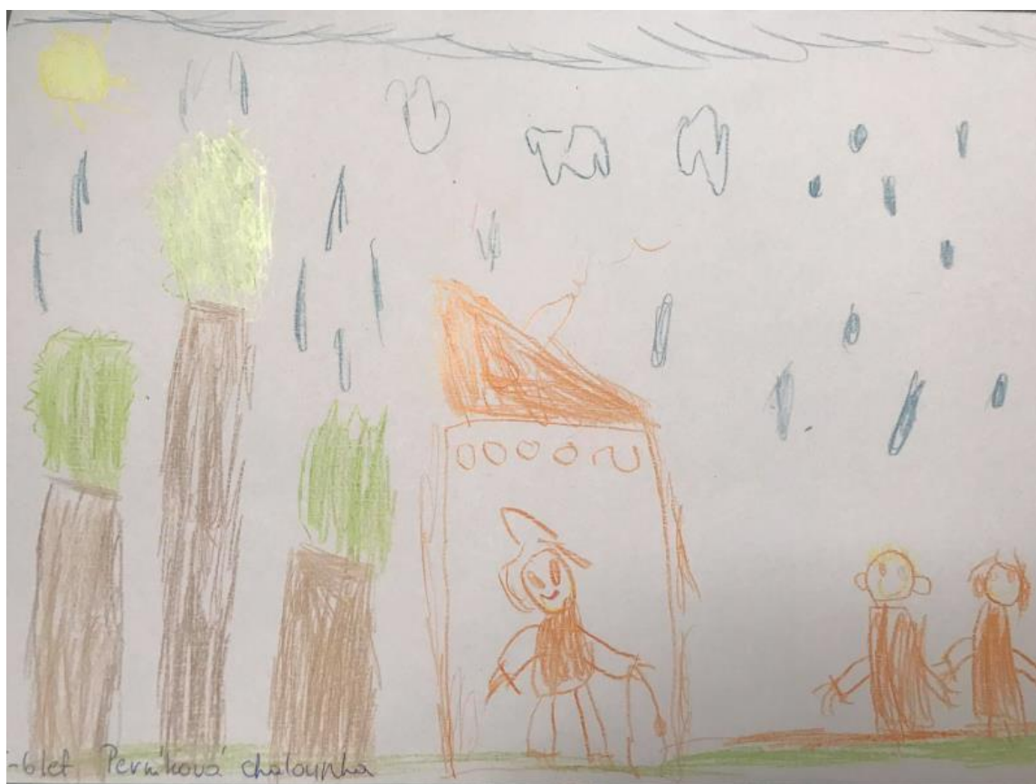
Obrázek 4 - O Perníkové chaloupce (dívka, 5,5 roku)