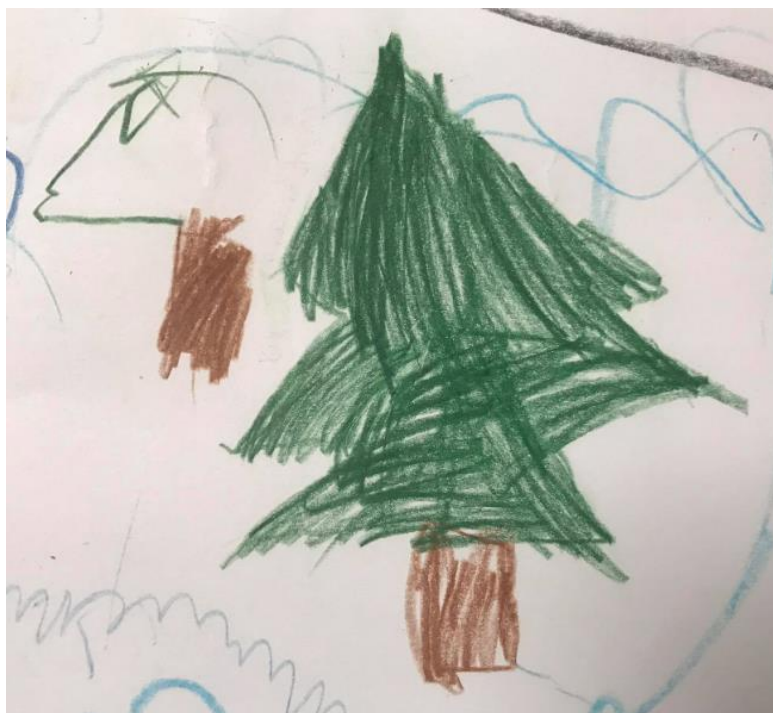
Obrázek 13 - Vánoční stromeček (Michal, 5 let)