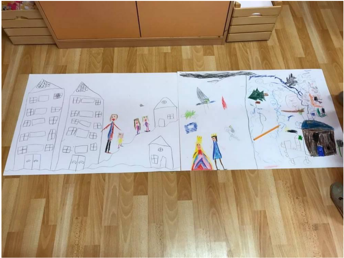
Obrázek 6 - Společná kresba dětí ve věku 3 až 6 (7) let – vstupní výtvarná aktivita ve výzkumném šetření