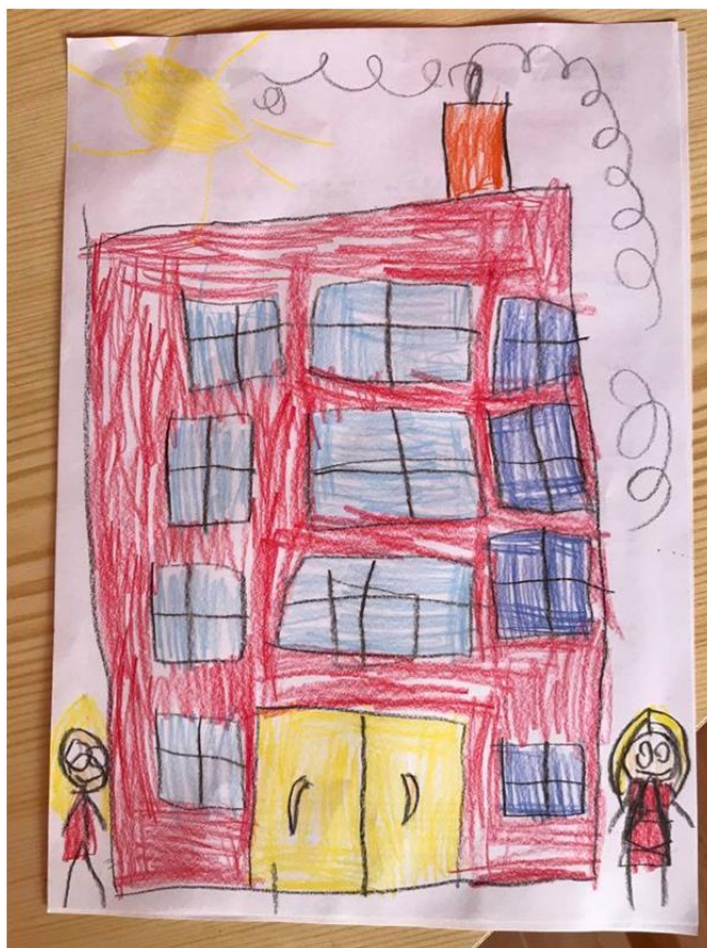
Obrázek 7 - Barevná nadsázka mateřské školy (Anička, 5 let)