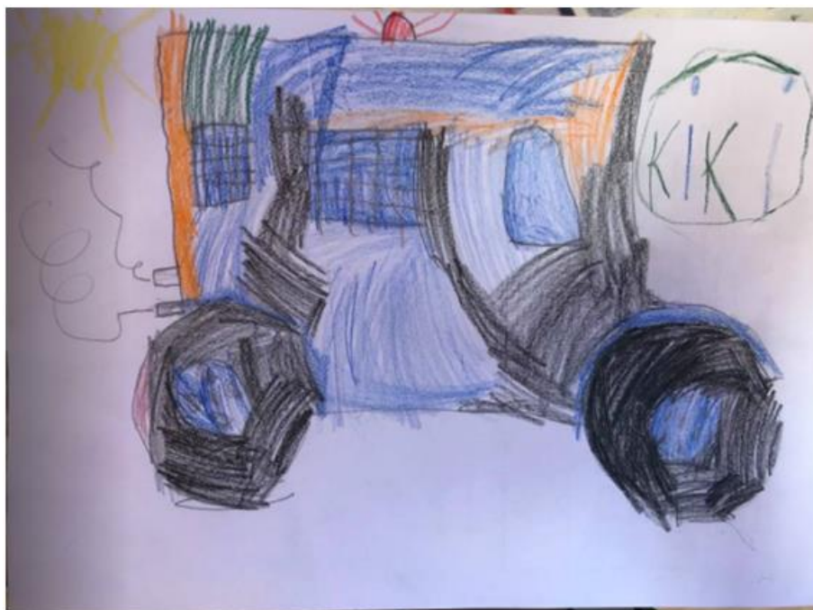
Obrázek 12 - Autobus (Michal, 5 let)

kresbě chlapec použil pastelky. Na další části papíru Michal nakreslil hnědou pastelku, měsíc a medvěda. Ke každému svému kresebnému výtvoru napsal svoji přezdívku.