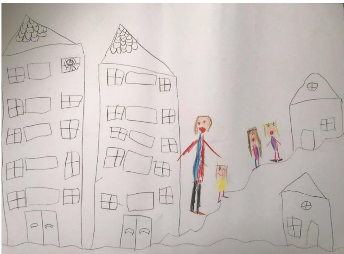
Obrázek 11 - Anička jde domů od kamarádky (Anička, 6 let, Běta 5 let)