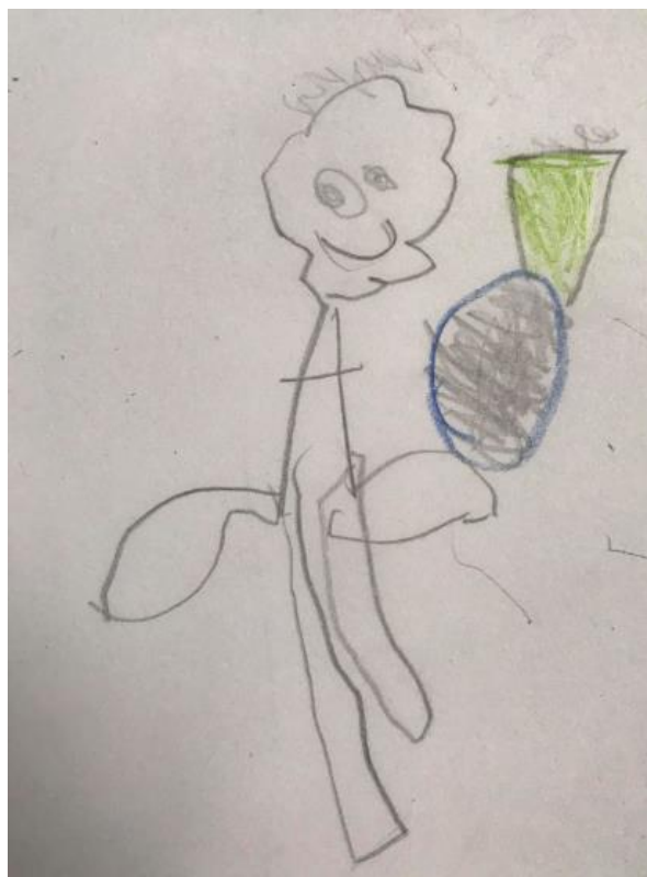
Obrázek 17 - Anděl potkal raketu, která letí do Vesmíru (Vojta, 6 let)