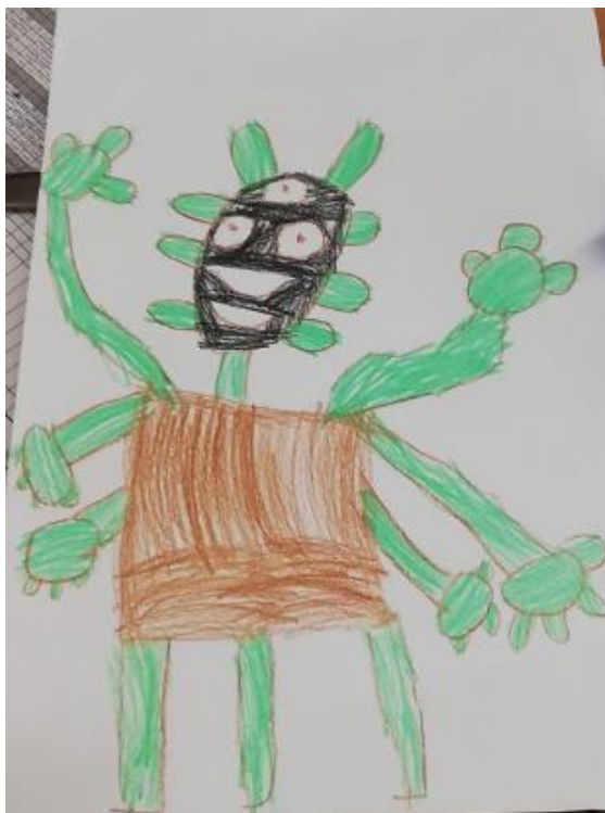
Obrázek 2 - Mimozemšťan (Chlapec, 5 let)