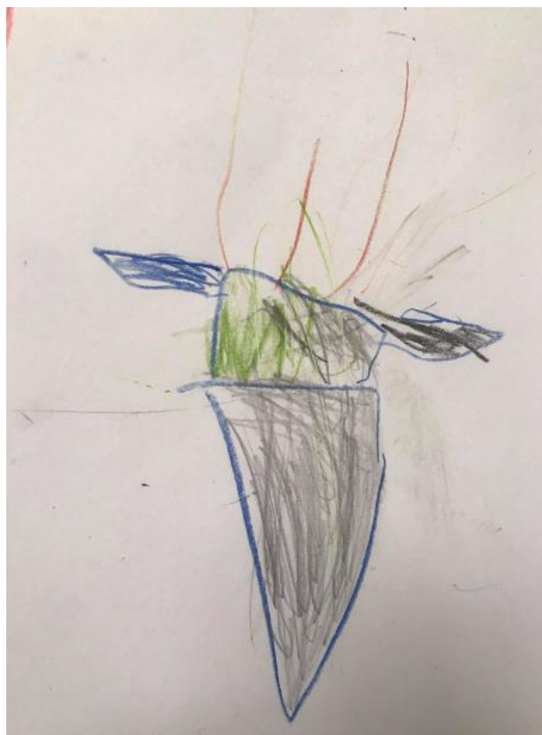
Obrázek 16 - Vesmírná raketa (Vojta, 6 let)