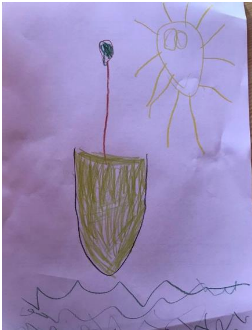
Obrázek 15 - Hruška (Vojta, 6 let)

představit ve své fantazii pomocí filmů, dokumentů, encyklopedií a obrázků. Chlapec zvolil pro svoji kresbu pastelky.