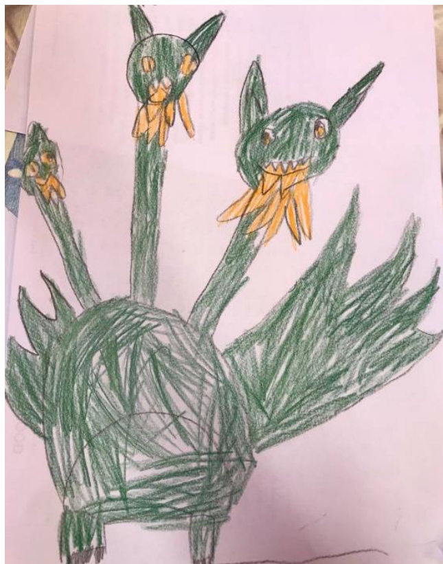
Obrázek 8 - Tříhlavá saň (Anička, 5 let)