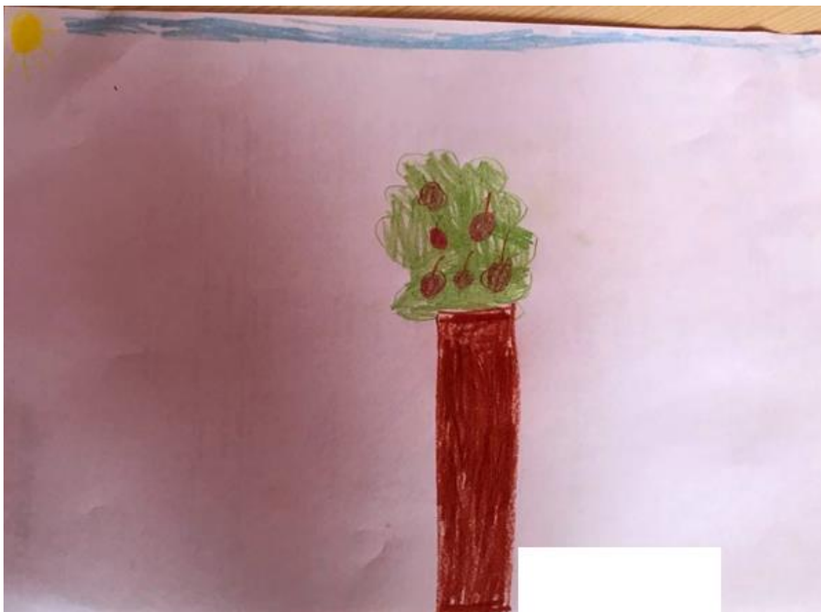
Obrázek 10 - Jabloň s jablky (Běta, 6 let)