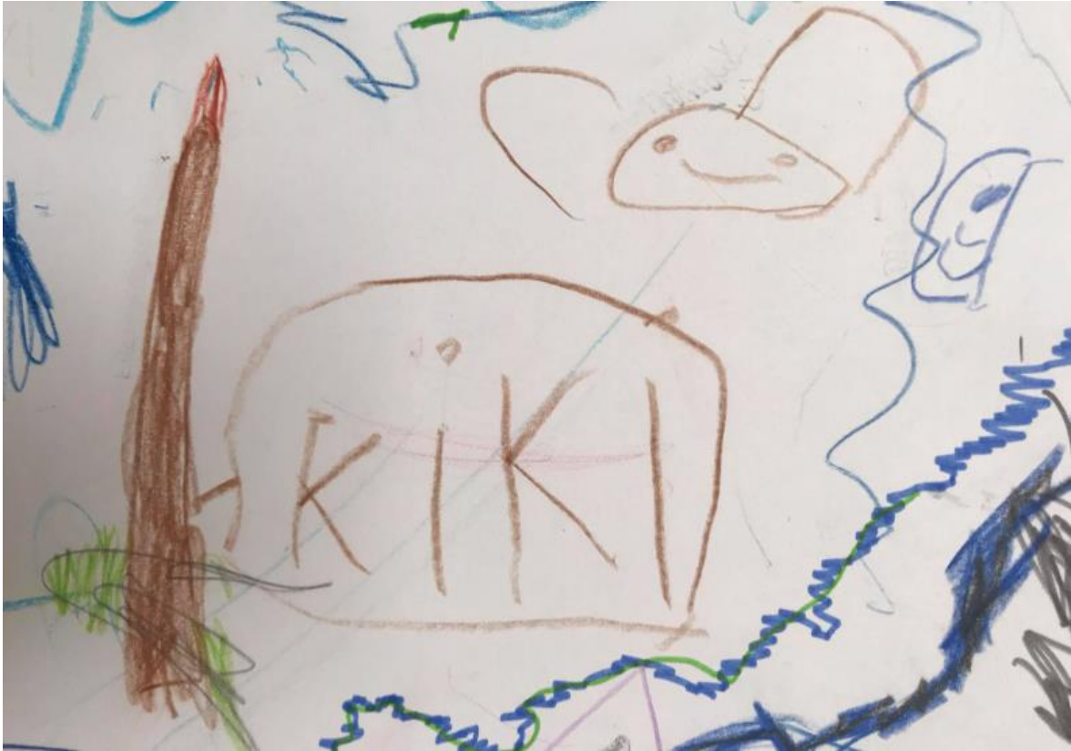
Obrázek 14 – Pastelka, medvídek a měsíc (Michal, 5 let)