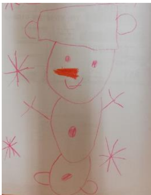
Obrázek 3 - Sněhulák (Dívka, 5 let)