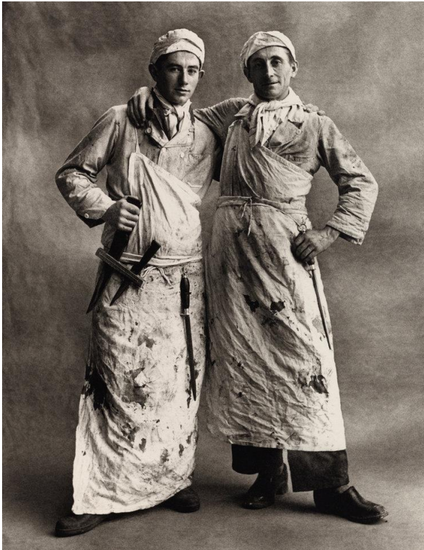
Obr. č. 1- PENN, Irving, 1950. Les Garçons Bouchers vlastních portrétech v podobě zobrazení osobnosti člověka.

Podíváme-li se na všechny portréty obsažené v této sbírce, můžeme si povšimnout jistého prvku, který je, navzdory tomu, jakým způsobem je pojem portrét často vykládán, že se ve snímcích objevují celé postavy a ne jen jejich tváře popřípadě s rameny, což poukazuje na skutečnost, že portrét může mít mnoho podob (nicméně této skutečnosti se budeme věnovat v kapitole portrétní fotografie )