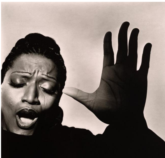
Obr. č. 2- PENN, Irving, 1983. Jessye Norman