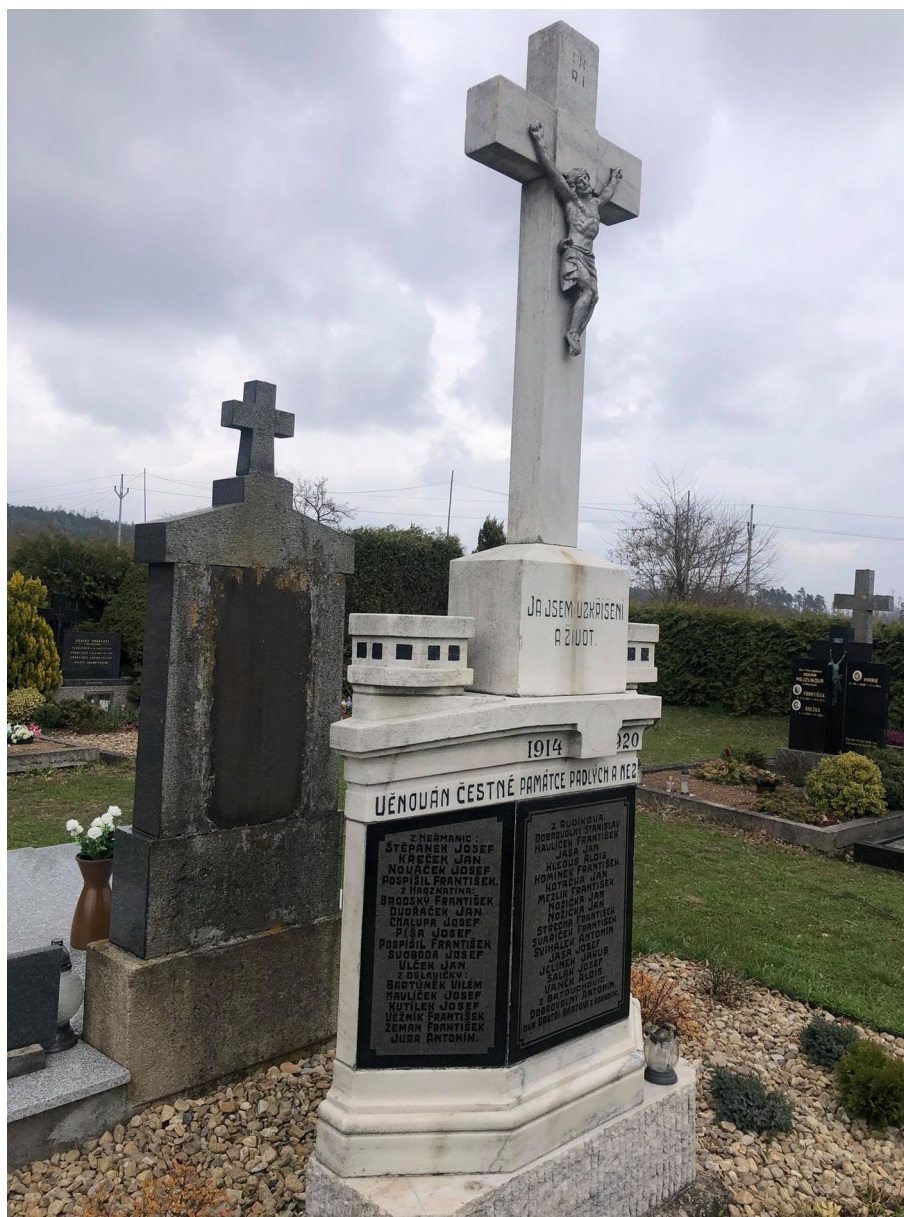
Příloha č. 7: Památník padlých z 1. světové války na rudikovském hřbitově 67