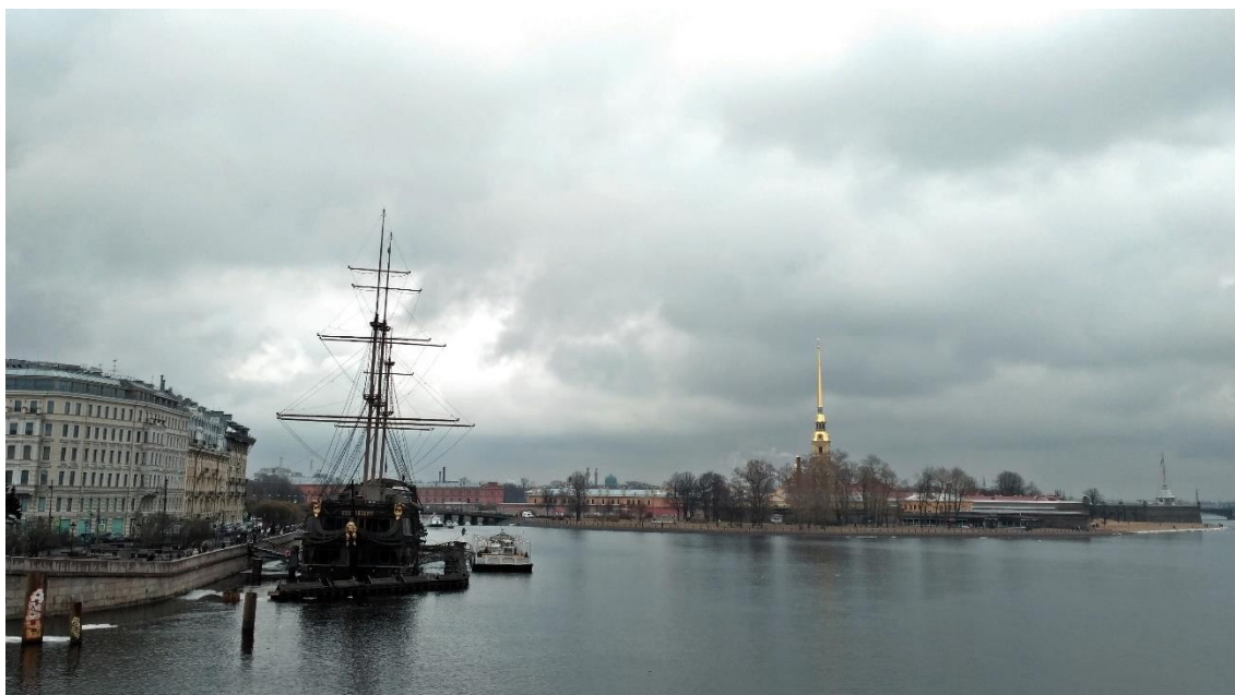
Příloha č. 1 – Pohled na Petropavlovskou pevnost