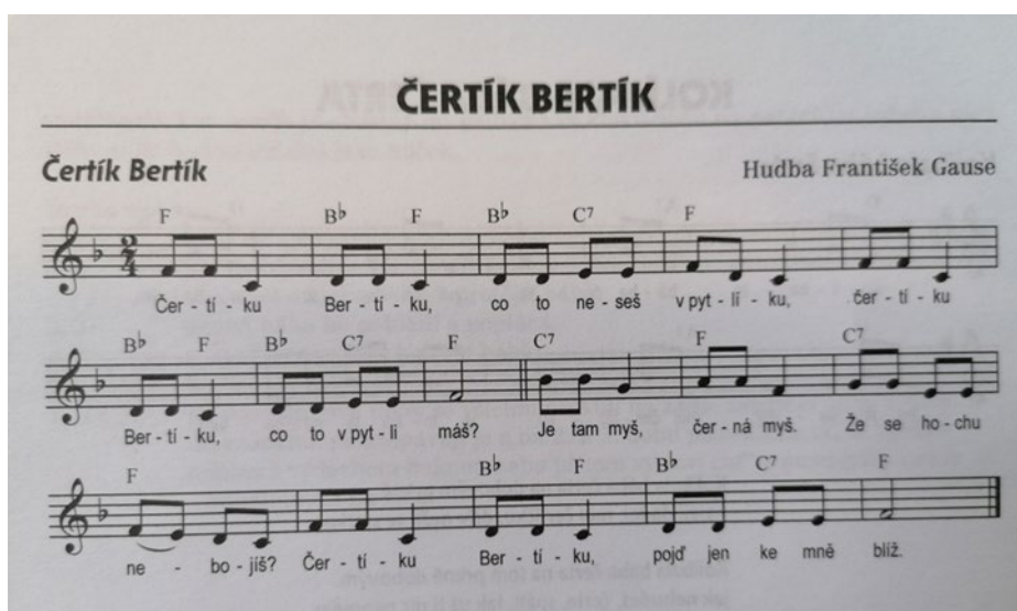
Obrázek 6: Písnička - Čertík Bertík