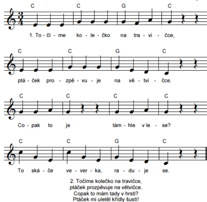
Obrázek 3: Písnička - Točíme kolečko