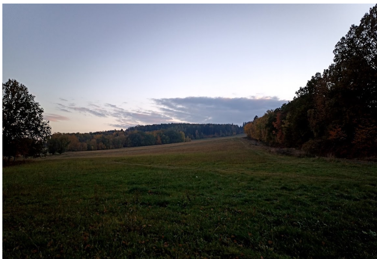
Příloha č. 8 – Pohled do luk z místa kyvadla