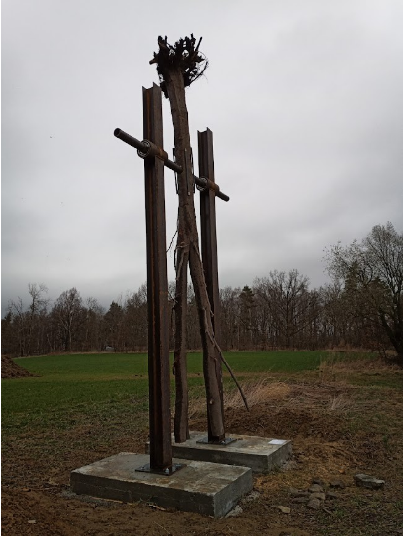
Příloha č. 33 – Usazené kyvadlo (3)