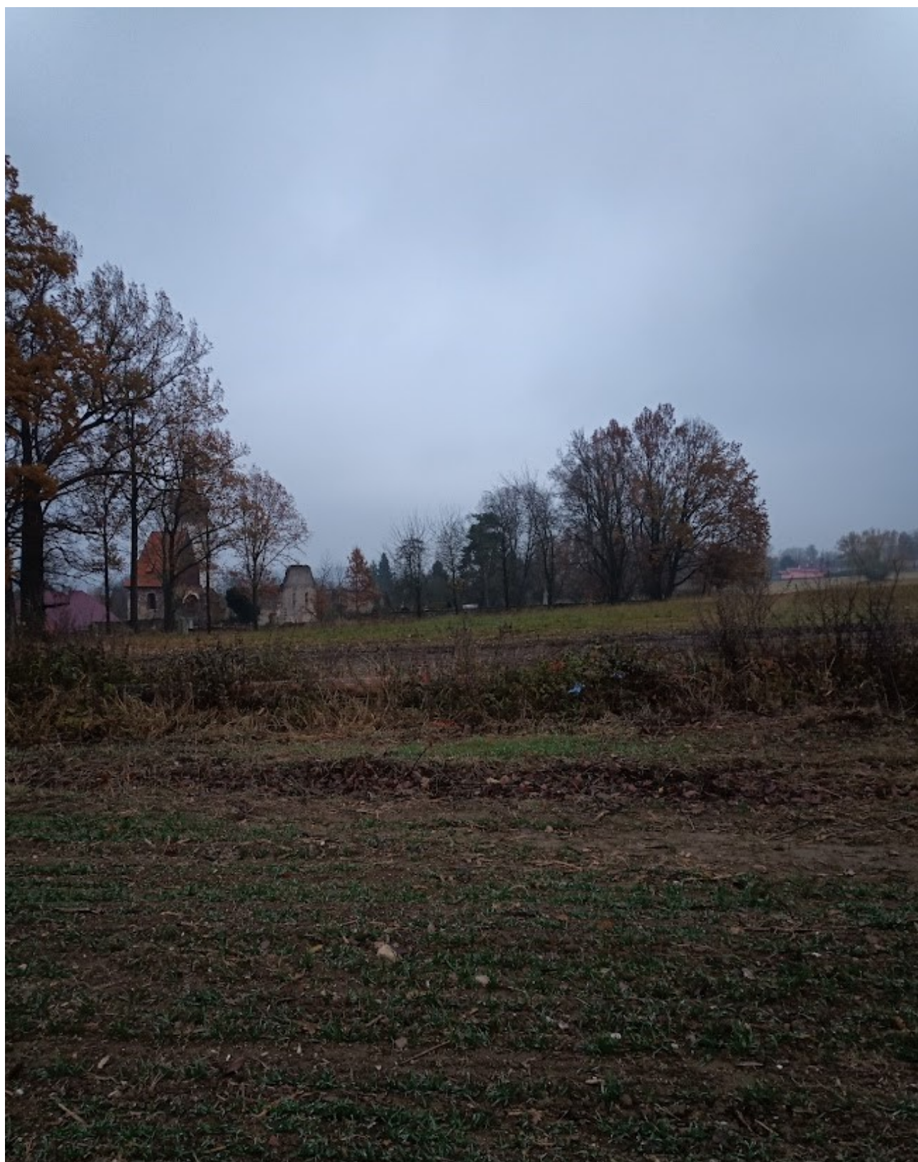
Příloha č. 9 – Pohled na kostel směrem od kyvadla