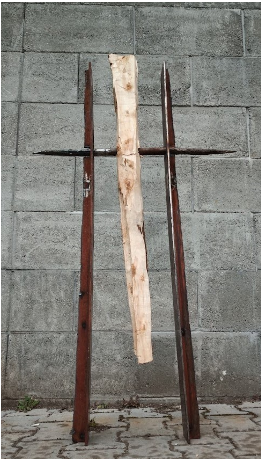
Příloha č. 13 – Čtvrtý model kyvadla