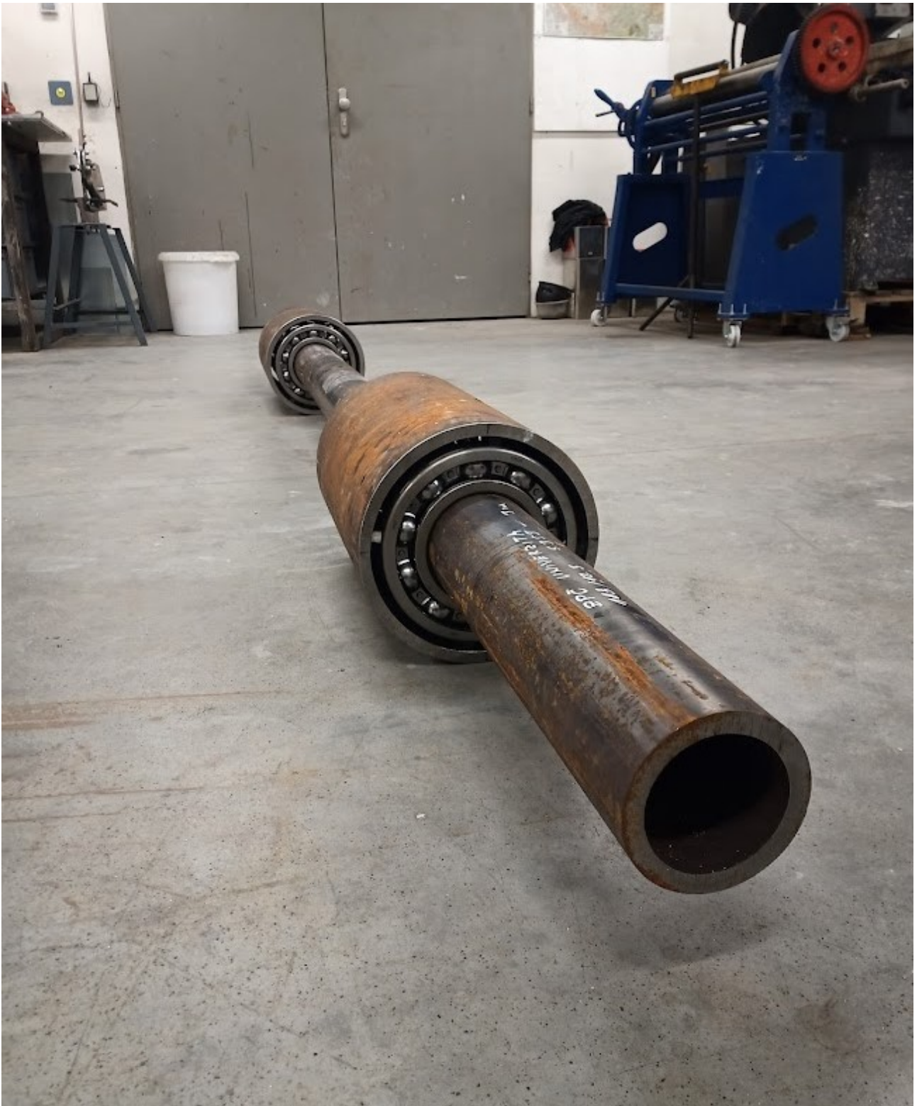
Příloha č. 18 – Kompletace kyvného systému