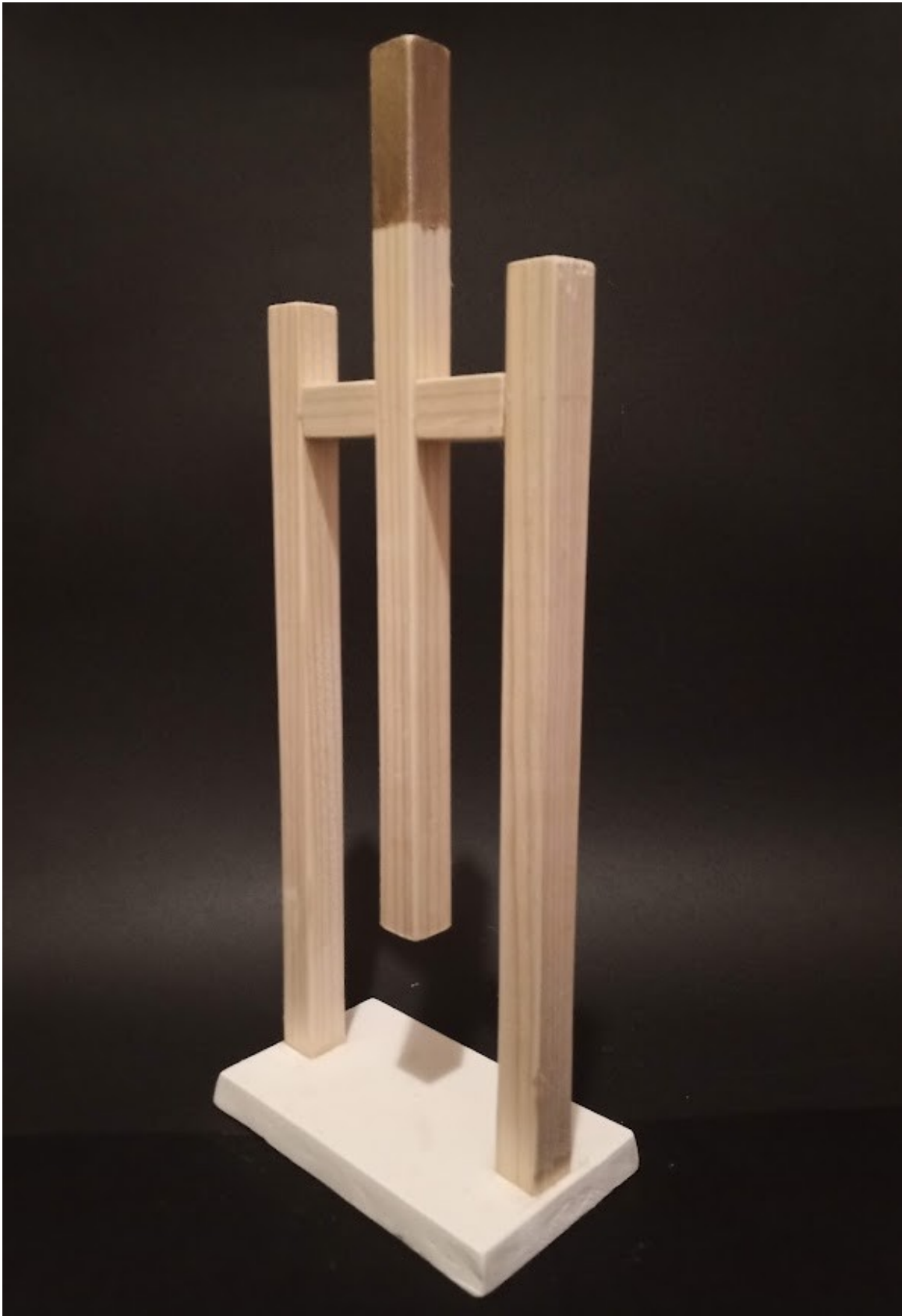
Příloha č. 10 – První model kyvadla