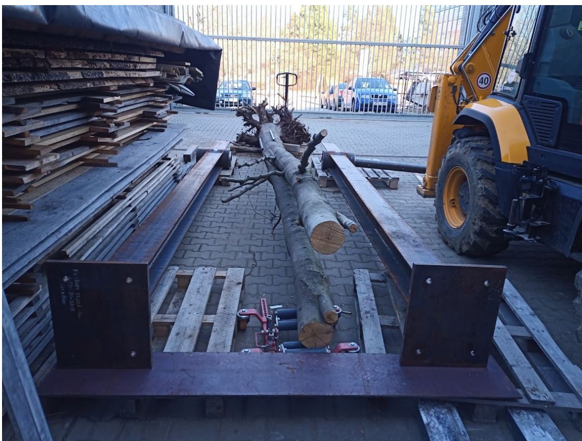
Příloha č. 19 – Zkušební kompletace díla (1)