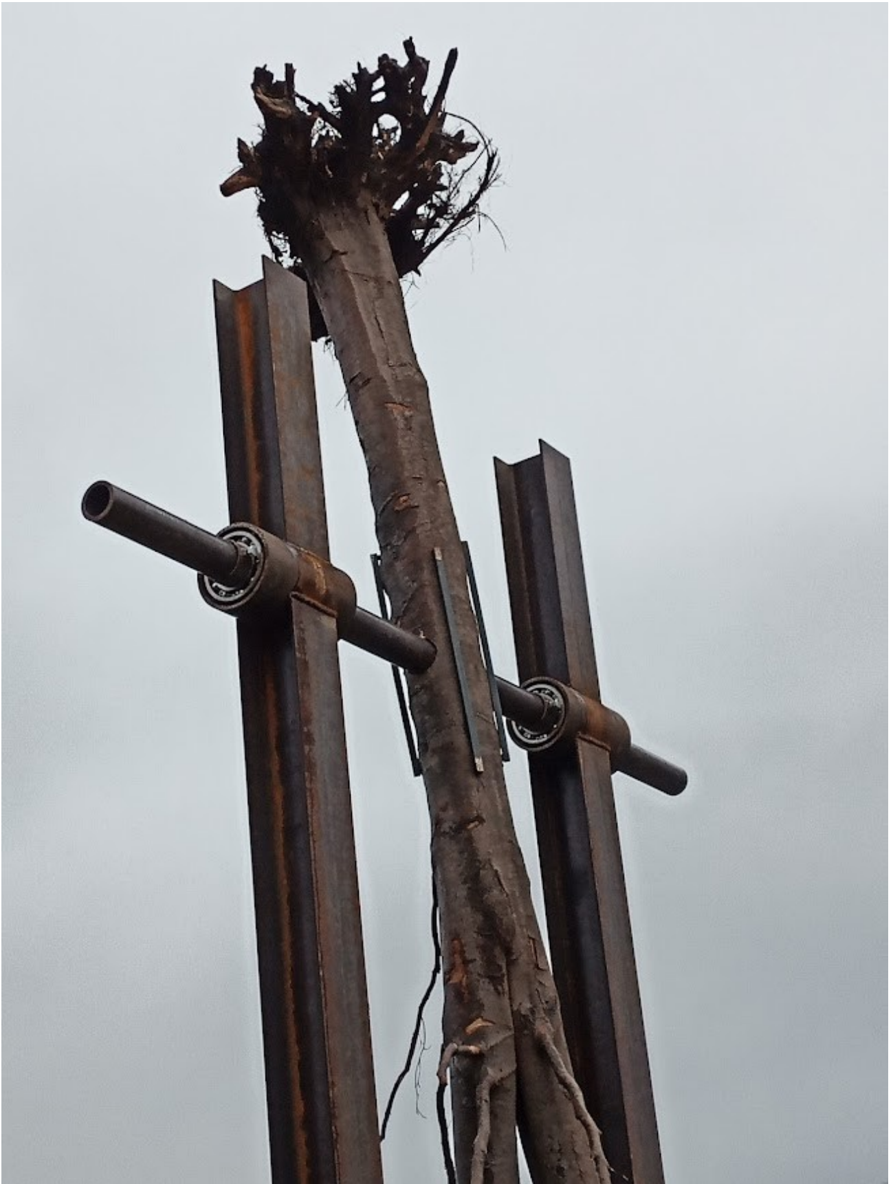
Příloha č. 34 – Detail usazení stromu a osy