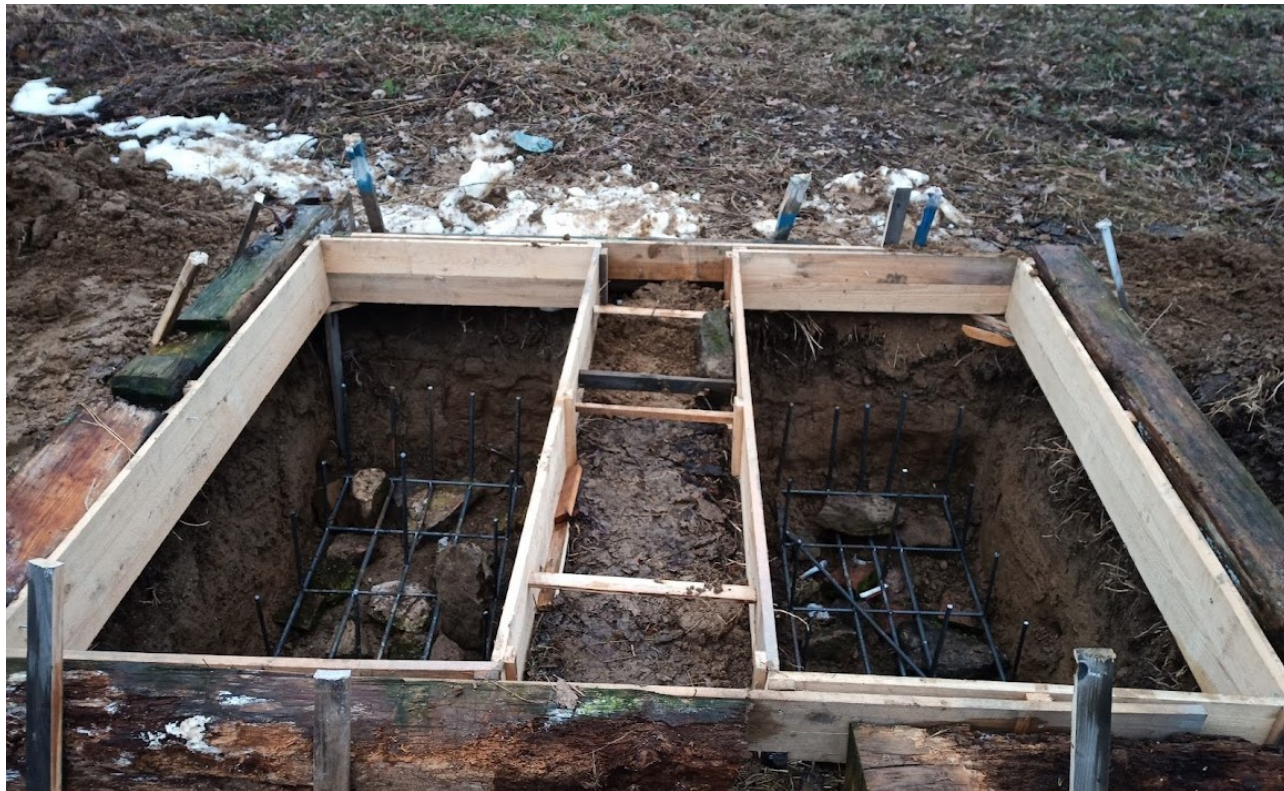
Příloha č. 26 – Základy s bedněním