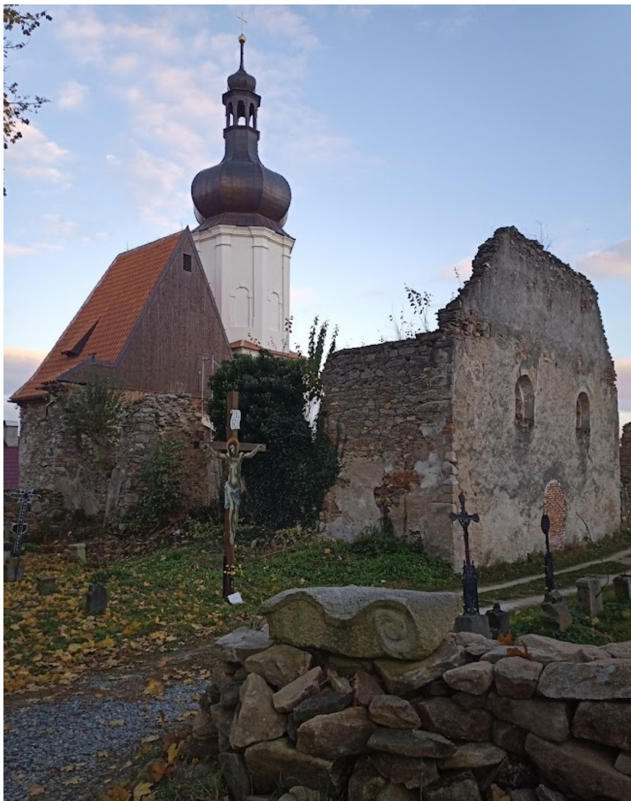
Příloha č. 5 – Pohled na kostel z „křížové cesty“