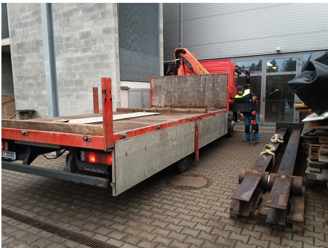
Příloha č. 29 – Nakládka kyvadla