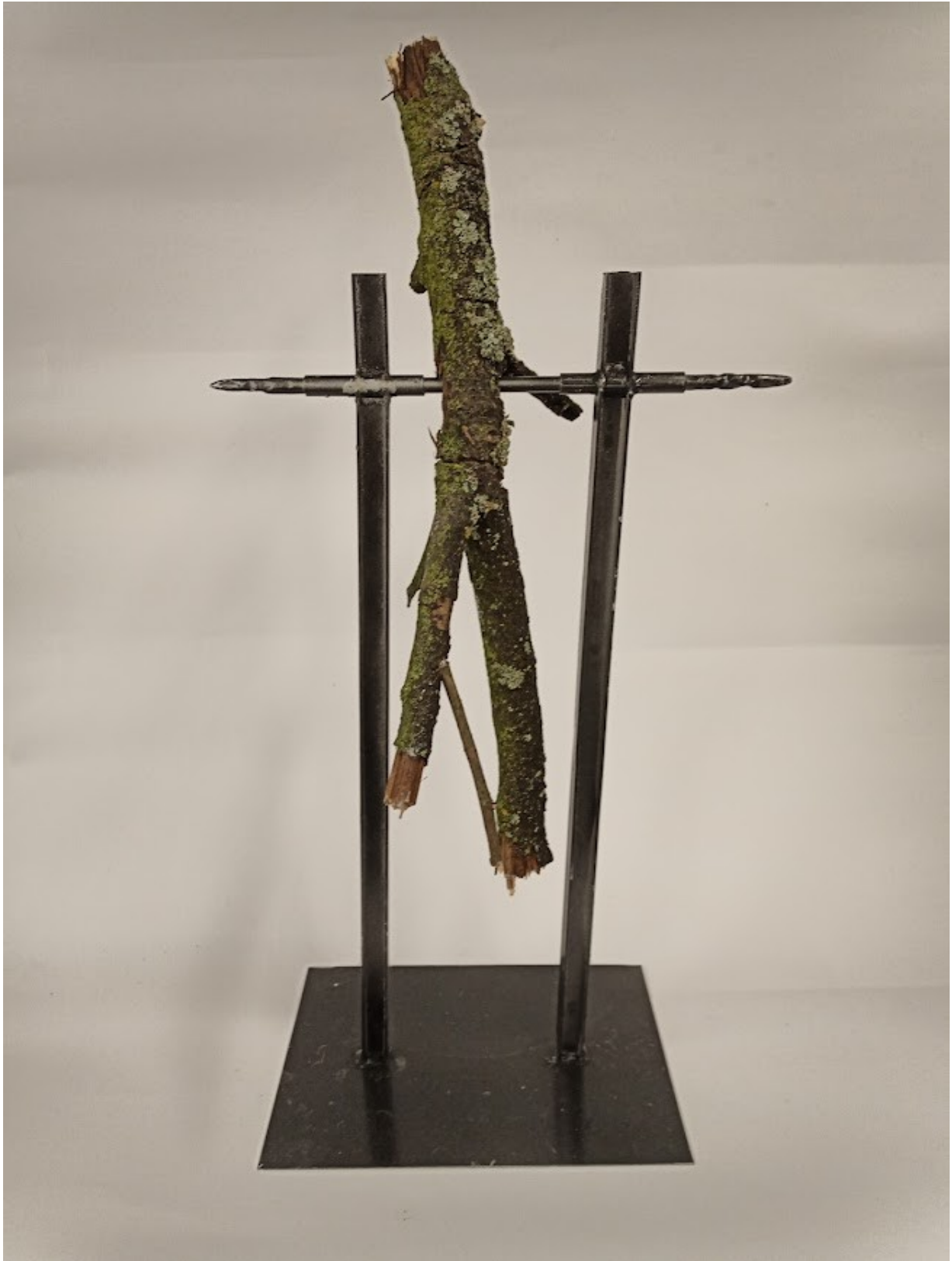
Příloha č. 14 - Finální model kyvadla