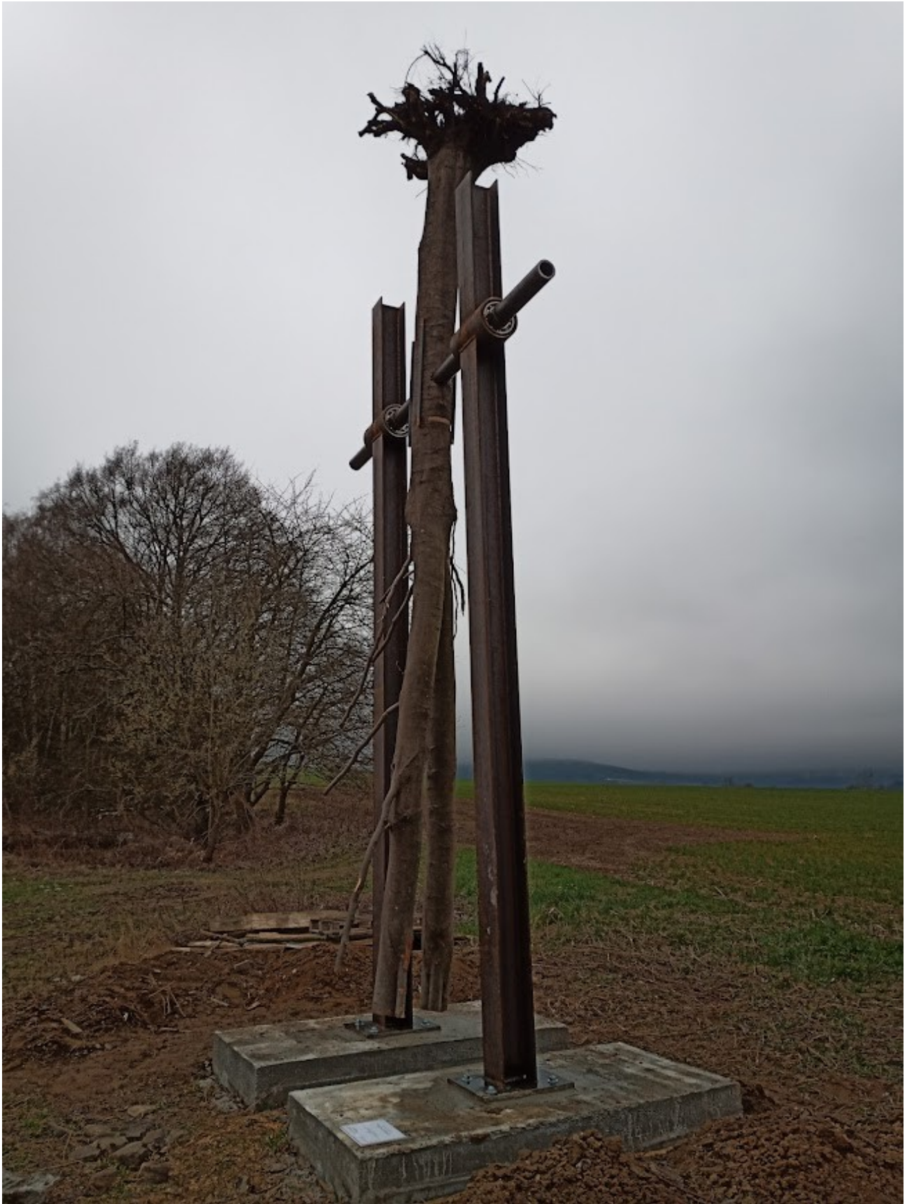
Příloha č. 32 – Usazené kyvadlo (2)