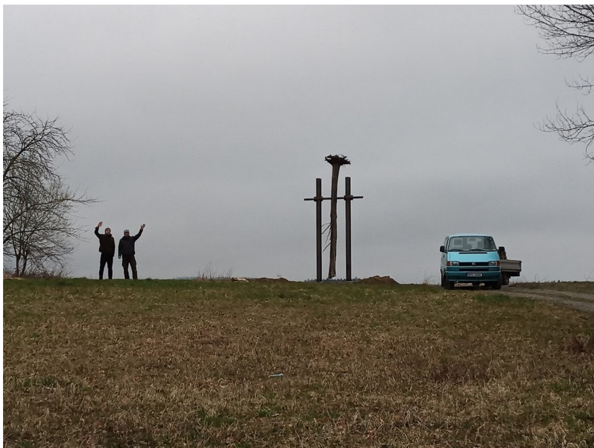
Příloha č. 35 – Kyvadlo v krajině