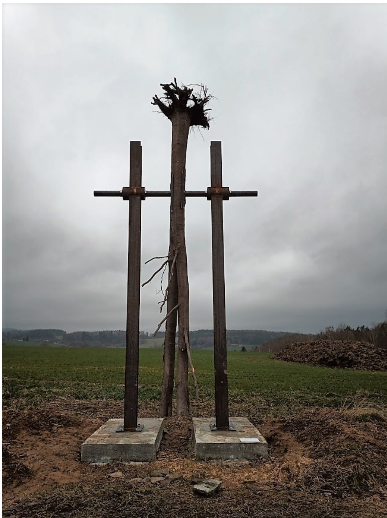
Příloha č. 31 – Usazené kyvadlo (1)