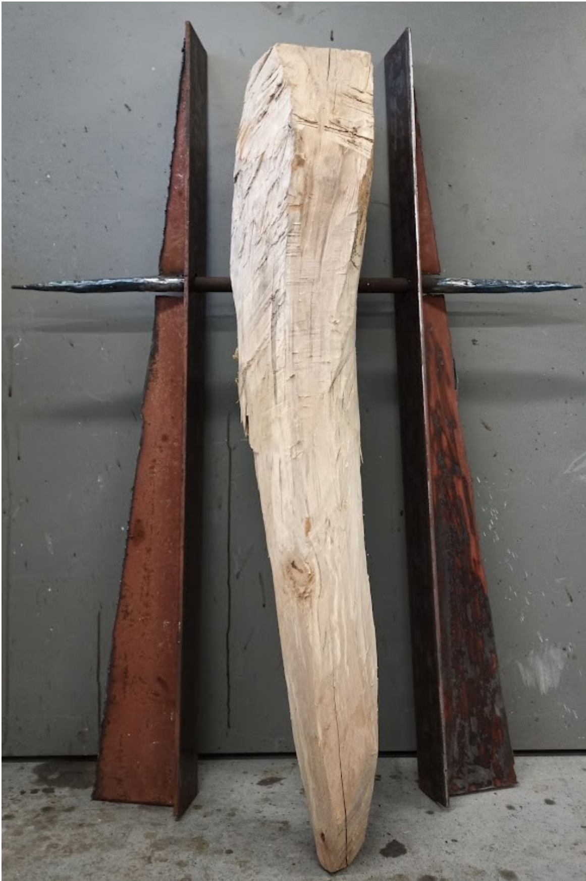
Příloha č. 12 – Třetí model kyvadla