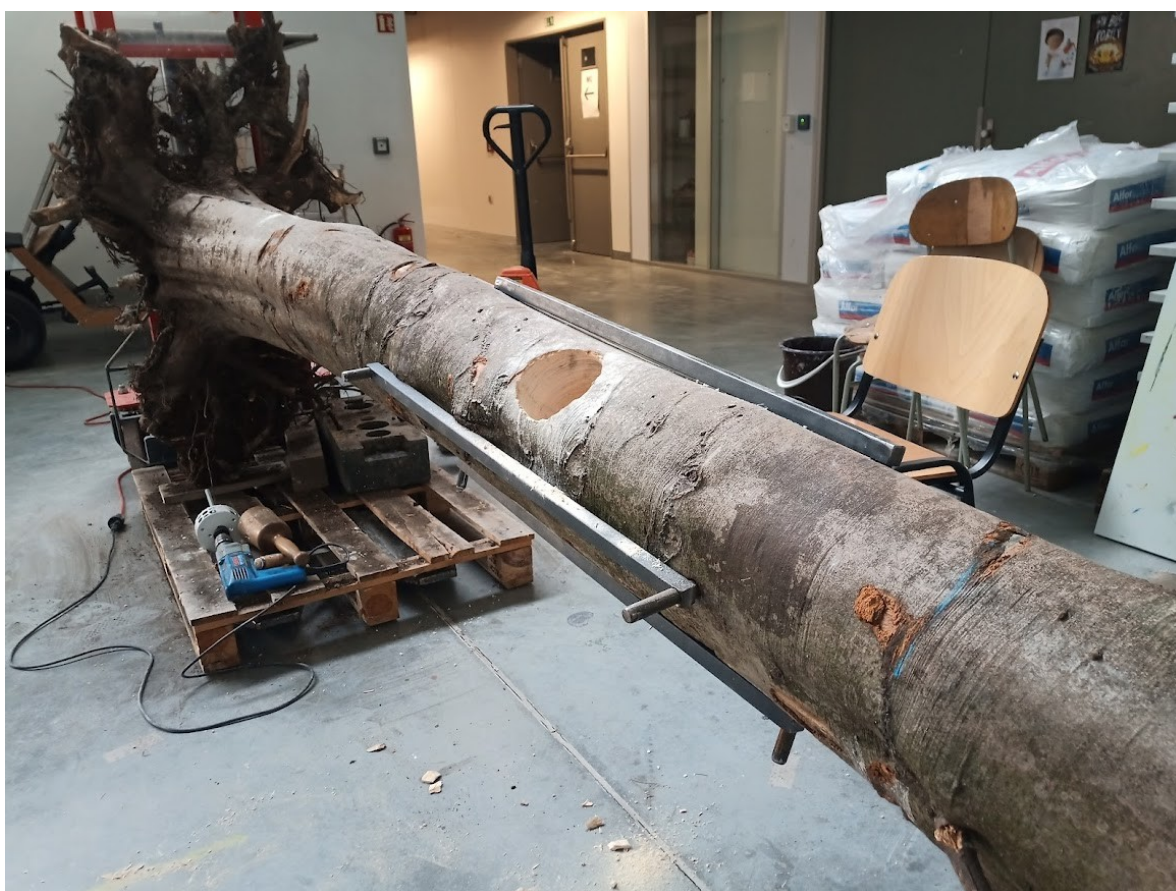
Příloha č. 24 – Vyvrtaný otvor a kramle