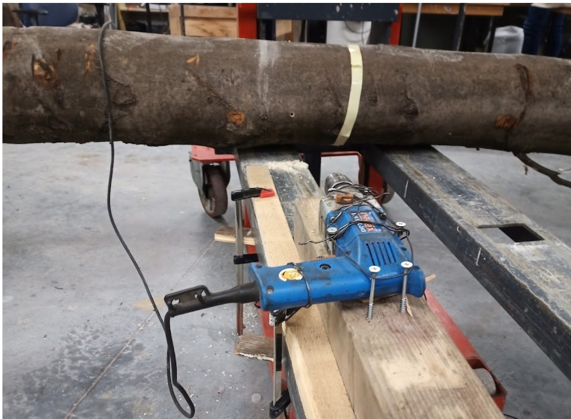
Příloha č. 23 – Vrtací systém