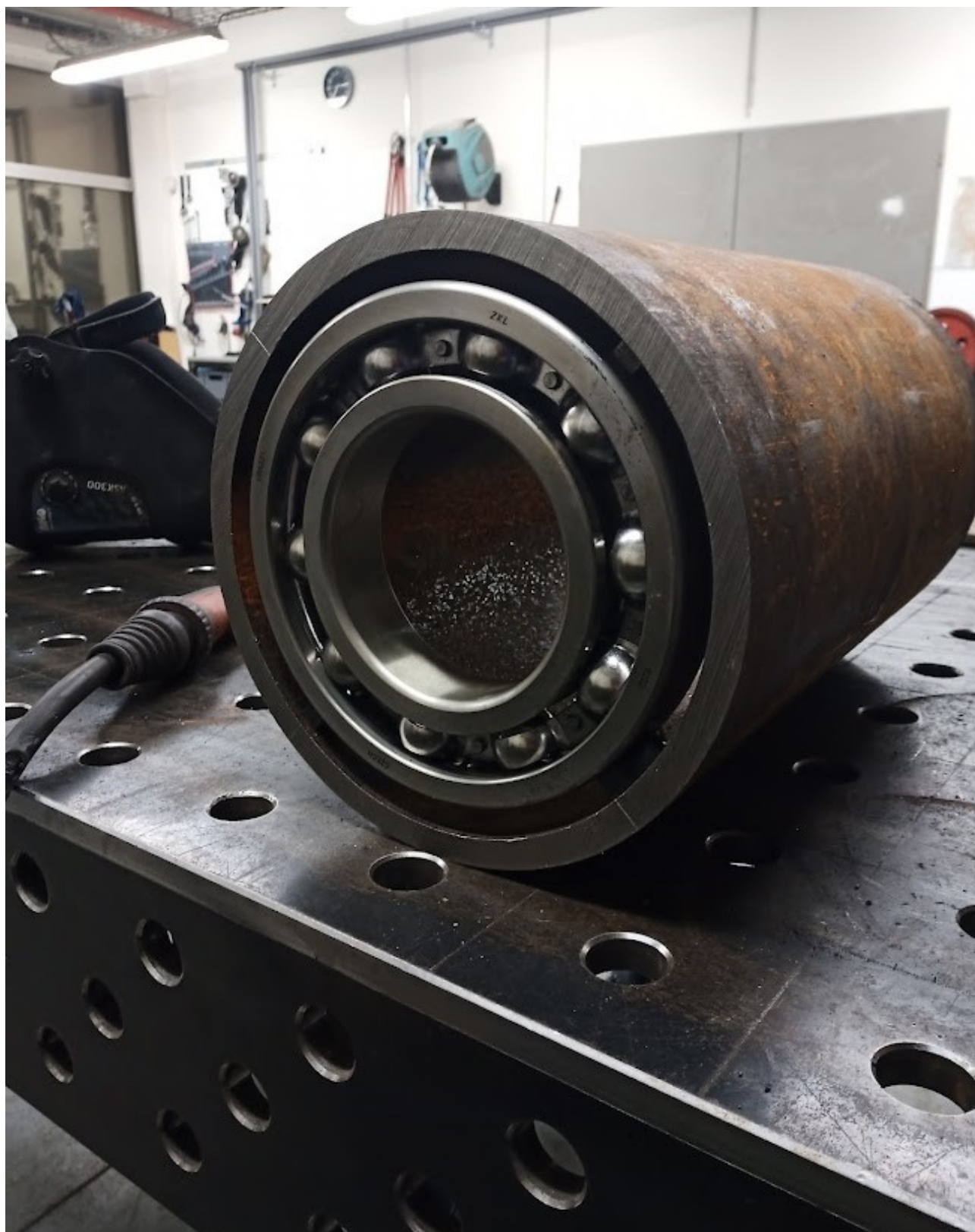
Příloha č. 17 – Osazení ložisek