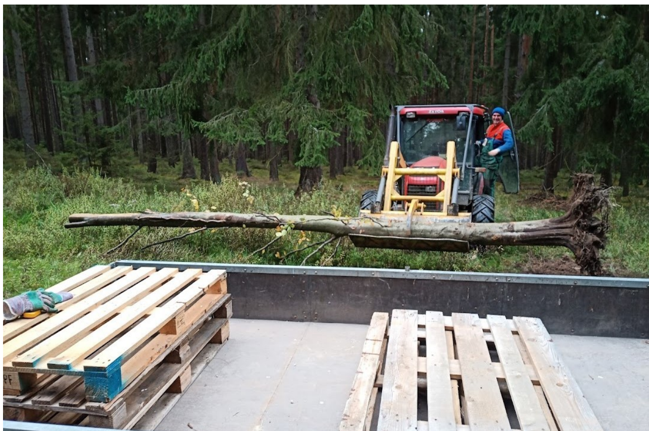
Příloha č. 21 – Převoz stromu