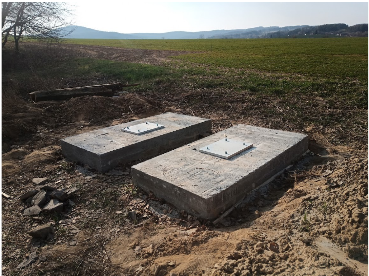
Příloha č. 28 – Základy bez bednění s osazenými kotevními šrouby