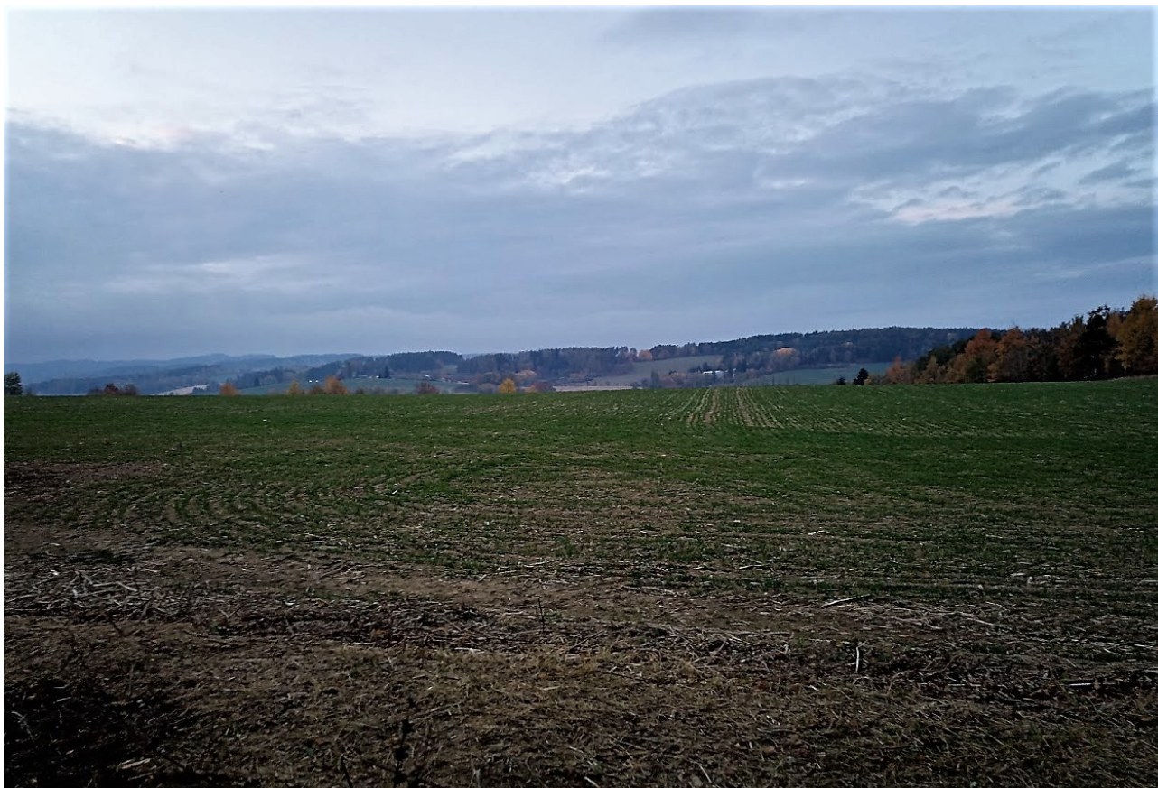
Příloha č. 7 – Pohled do krajiny z místa kyvadla