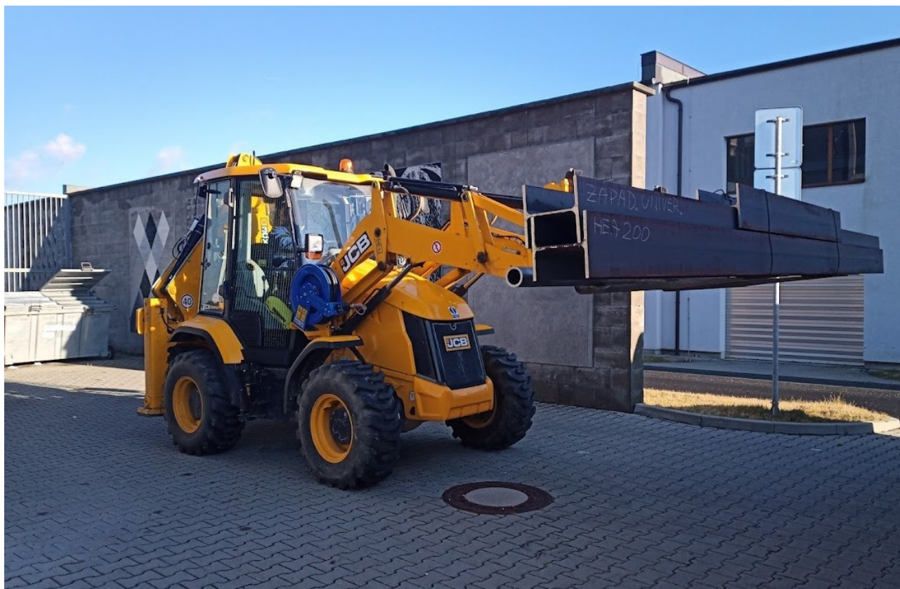
Příloha č. 15 – Vykládka ocelového materiálu