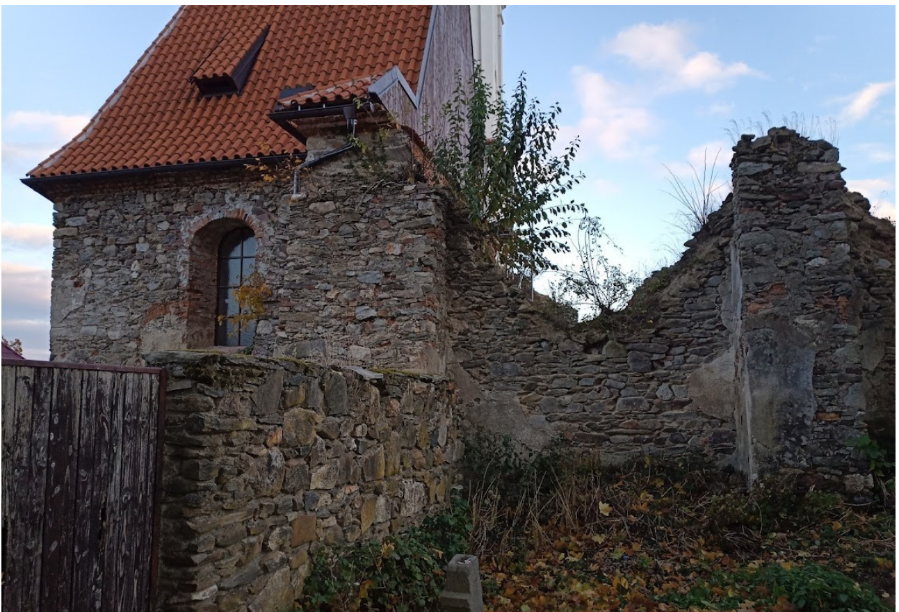
Příloha č. 4 – Pohled na rozpadlou loď kostela