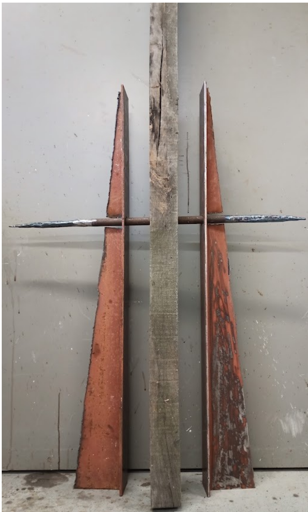
Příloha č. 11 – Druhý model kyvadla