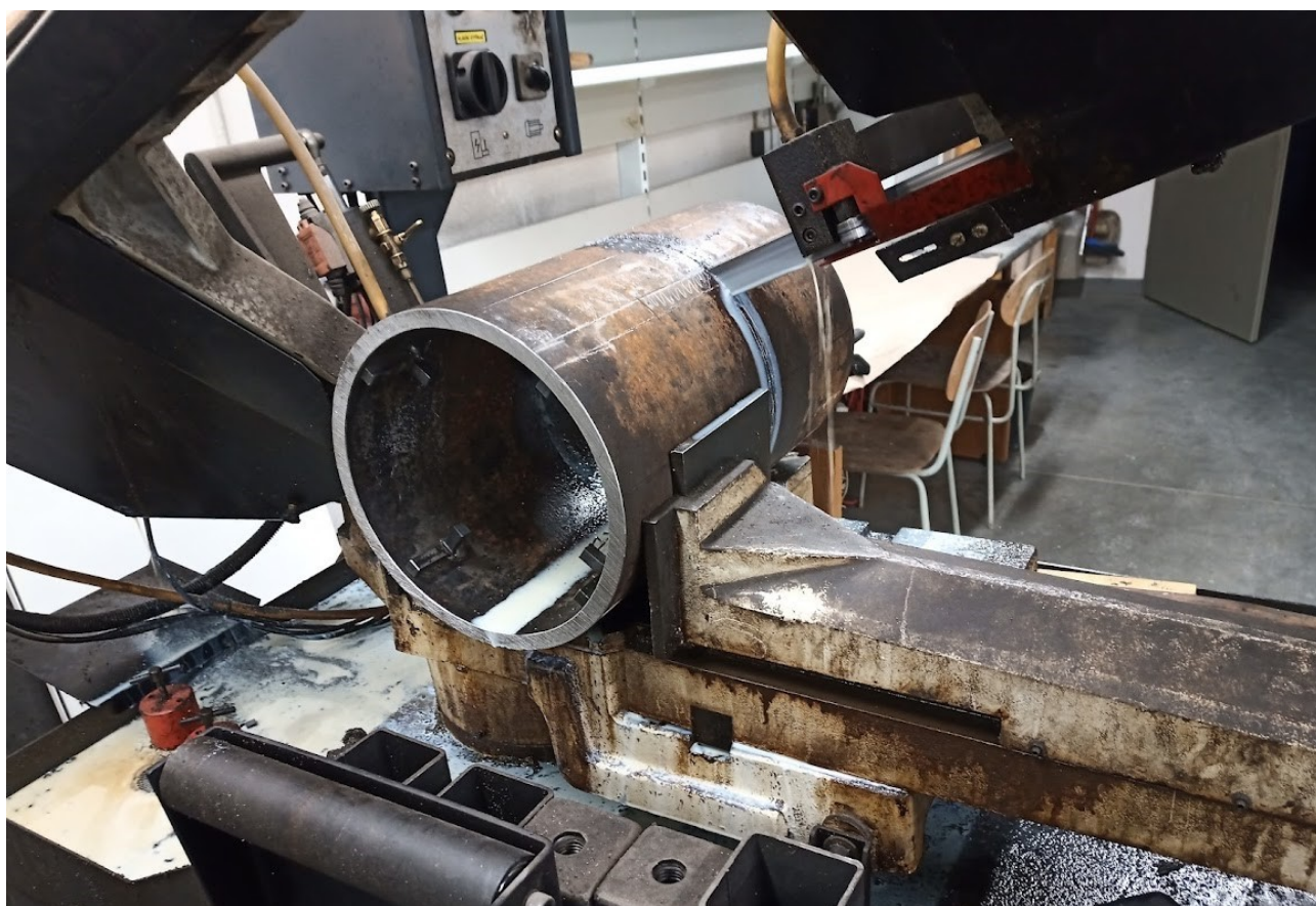
Příloha č. 16 – Dělení materiálu