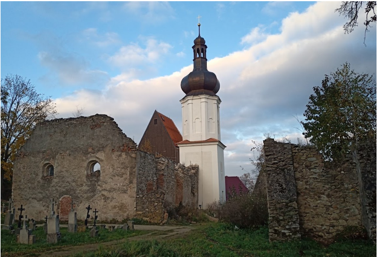
Příloha č. 3 – Pohled na kostel směrem ze hřbitova