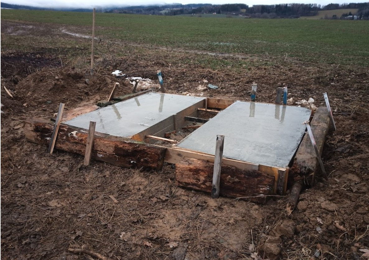
Příloha č. 27 – Vybetonované základy