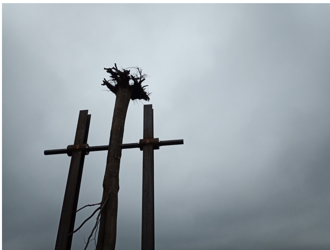
Příloha č. 36 – Atmosféra kyvadla