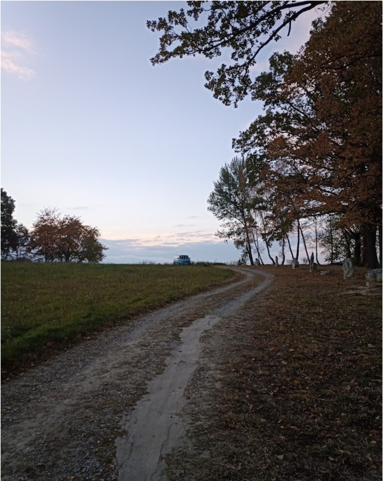
Příloha č. 6 – Pohled na horizont (zamýšlené místo kyvadla)