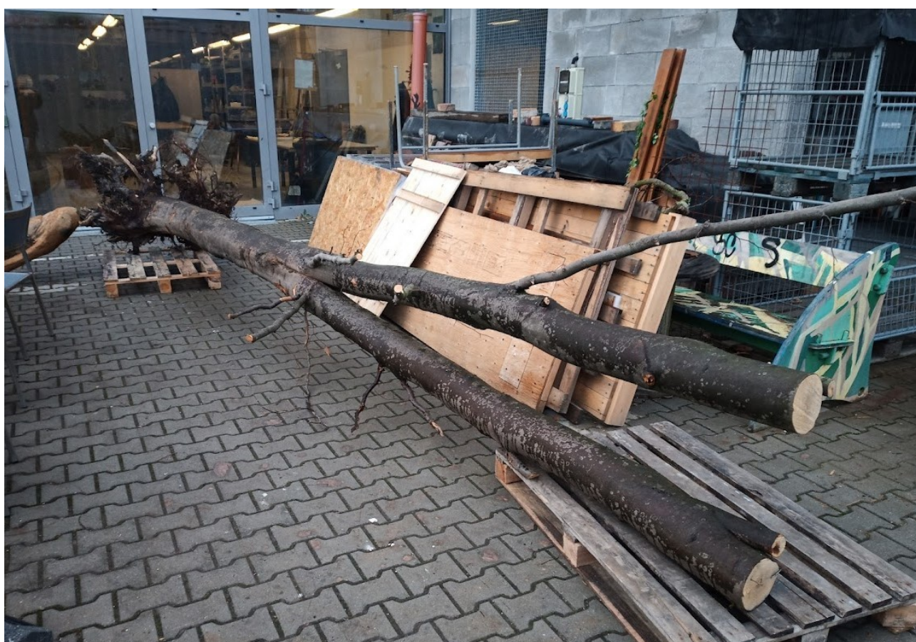
Příloha č. 22 – Vykládka stromu