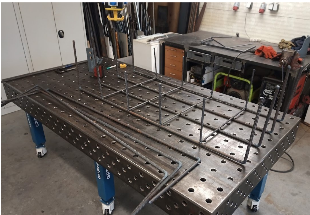
Příloha č. 25 – Příprava armovacích košů