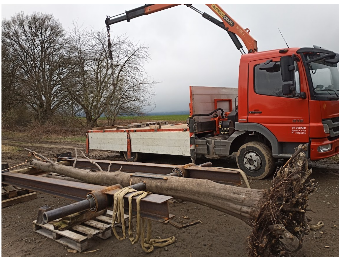
Příloha č. 30 – Vykládka kyvadla