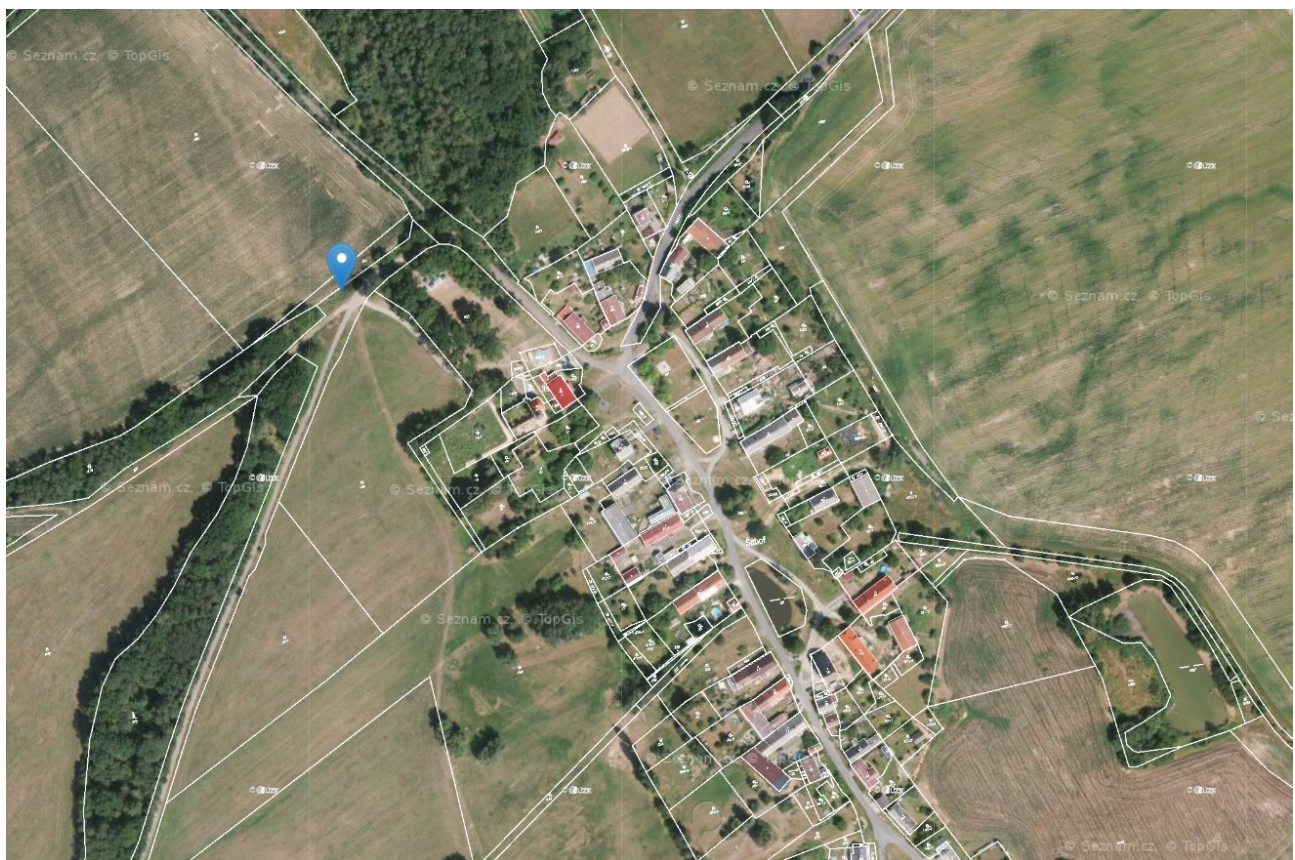
Příloha č. 2 – Poloha kyvadla na mapě