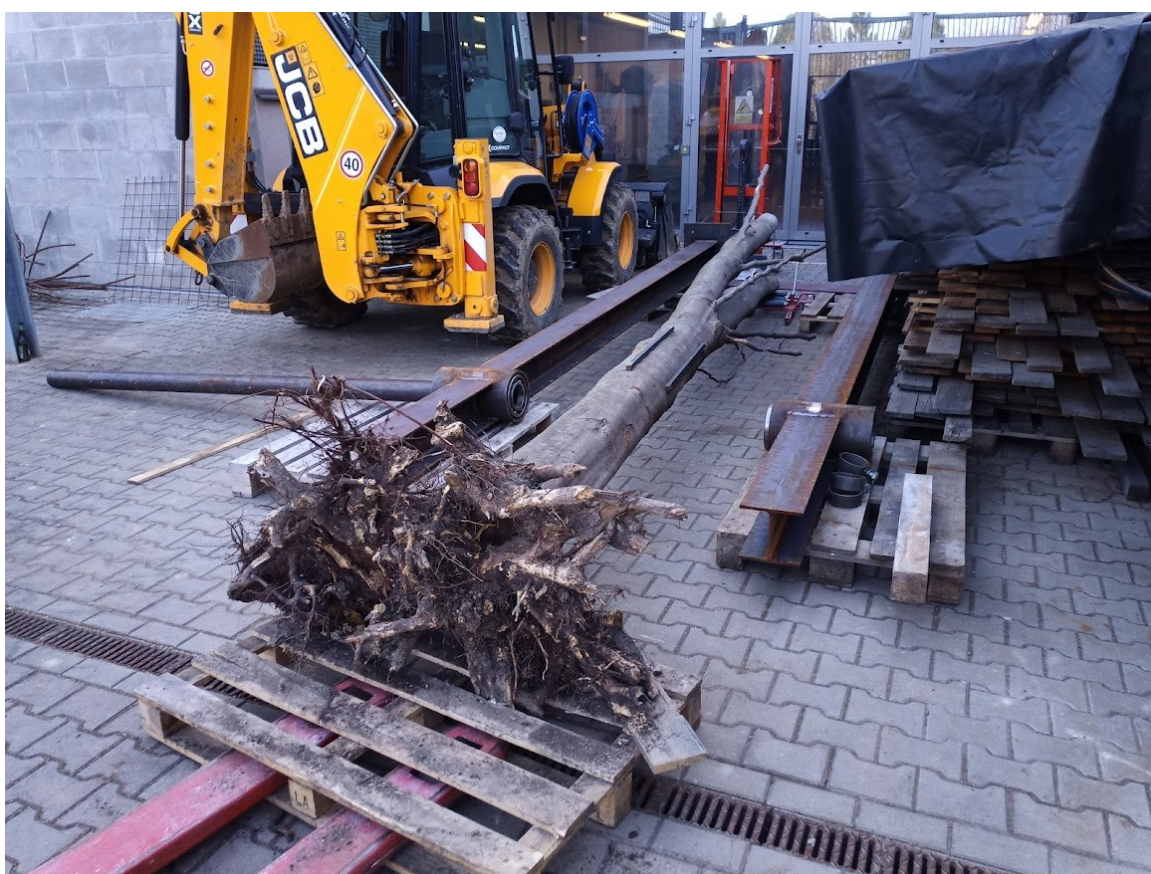
Příloha č. 20 – Zkušební kompletace díla (2)