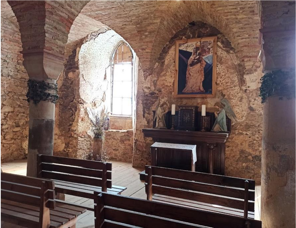
Obrázek č. 8: Tříkrálová kaple na hradu Hartenberg(k)