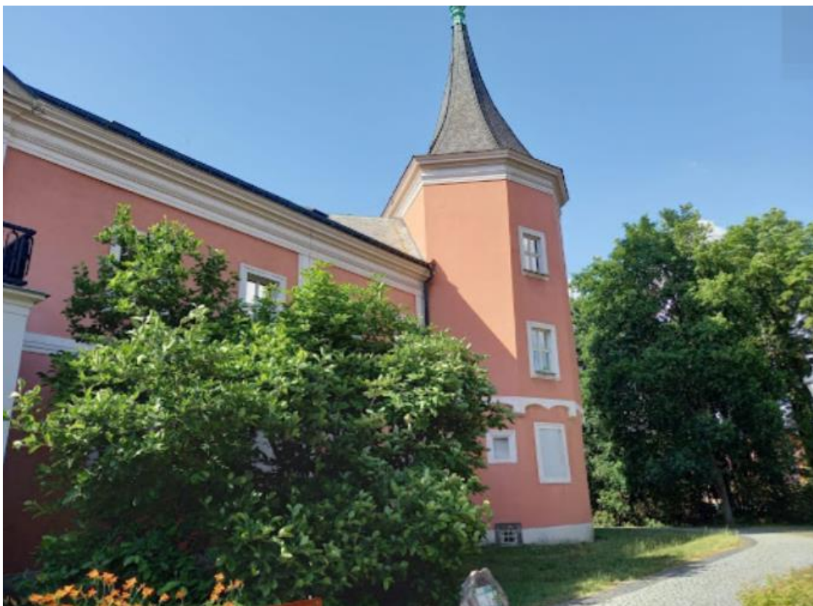
Obrázek č. 20: Rondel zámku Sokolov