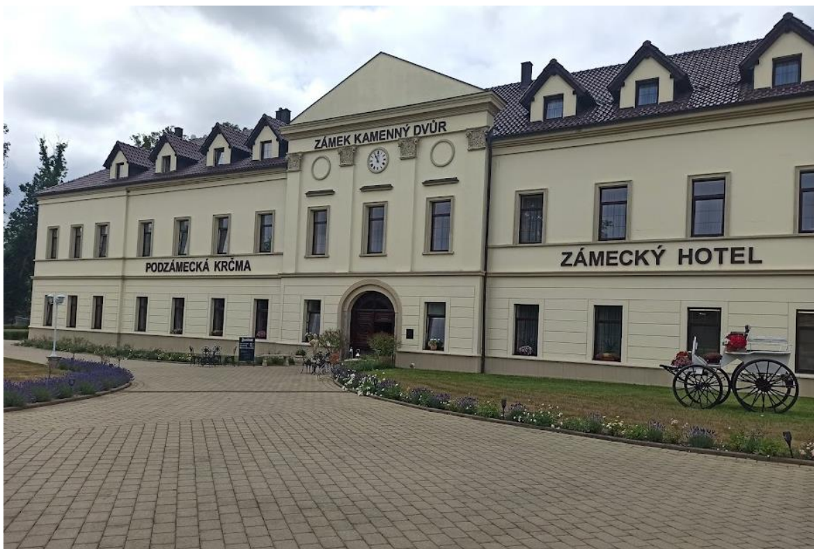
Obrázek č. 26: Zámek Kamenný Dvůr