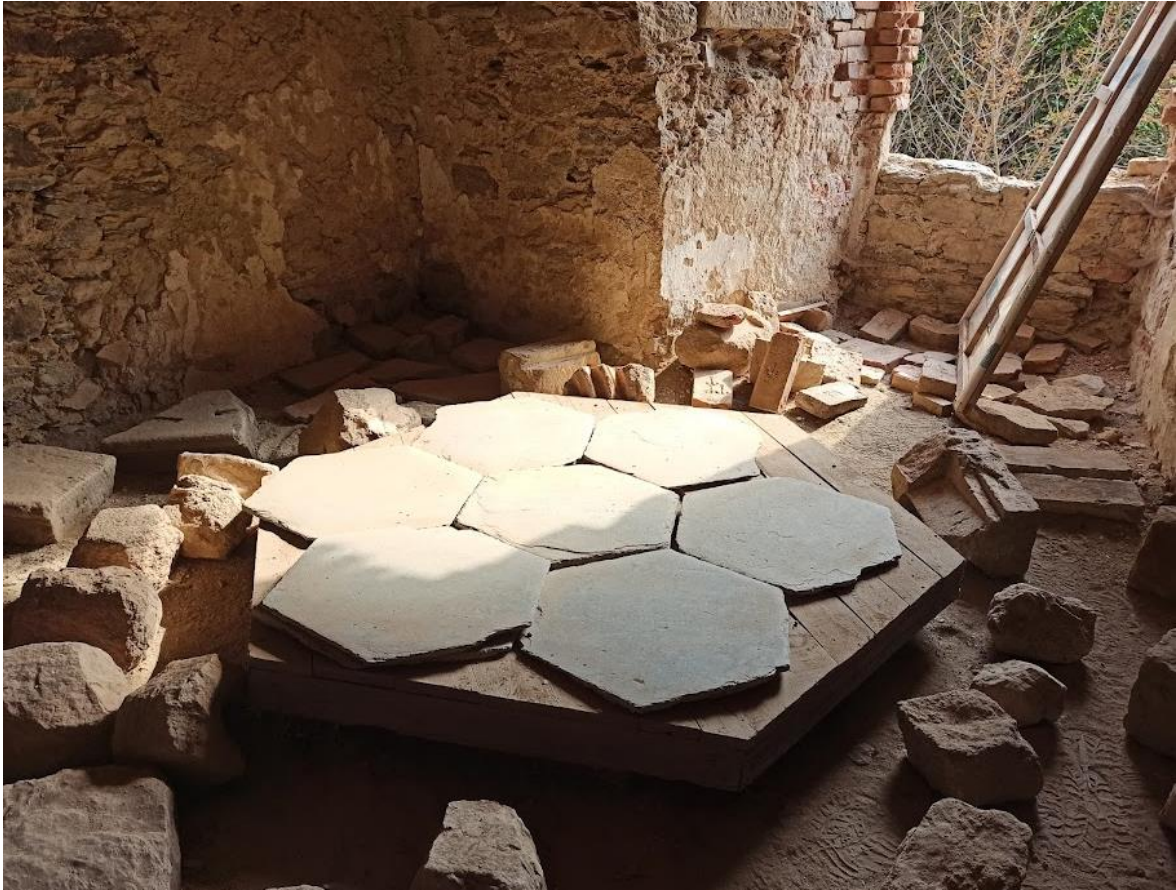
Obrázek č. 10: Původní podlaha na hradu Hartenberg(k)