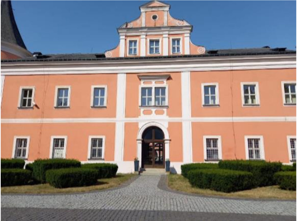
Obrázek č. 19: Zadní část zámku Sokolov (vstup do obřadní síně)