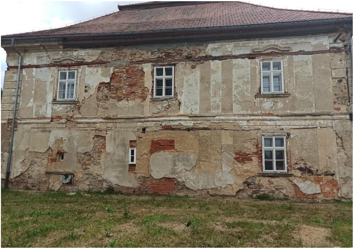
Obrázek č. 31: Zadní část zámku v Kaceřově