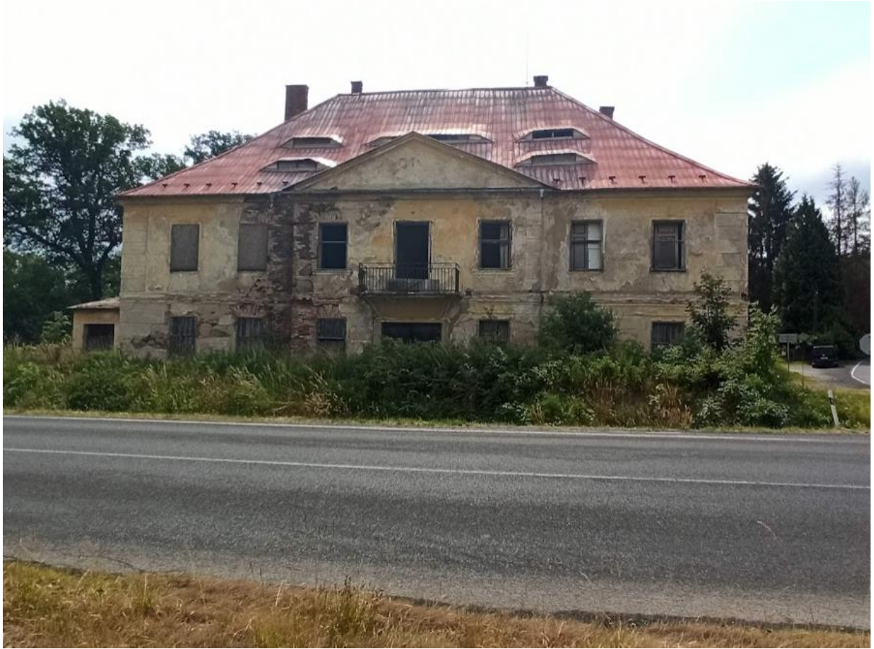
Obrázek č. 37: Přední strana zámku Arnoltov