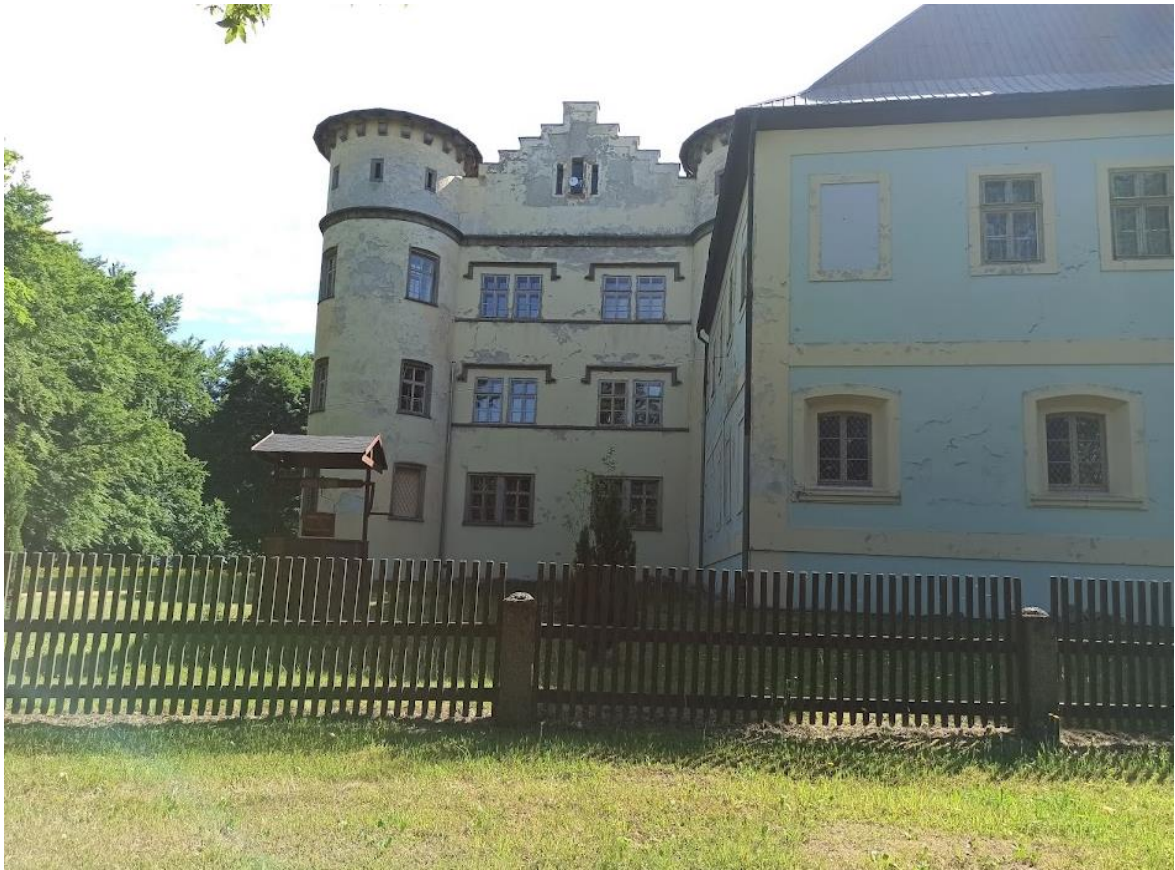
Obrázek č. 22: Boční strana zámku v Jindřichovicích