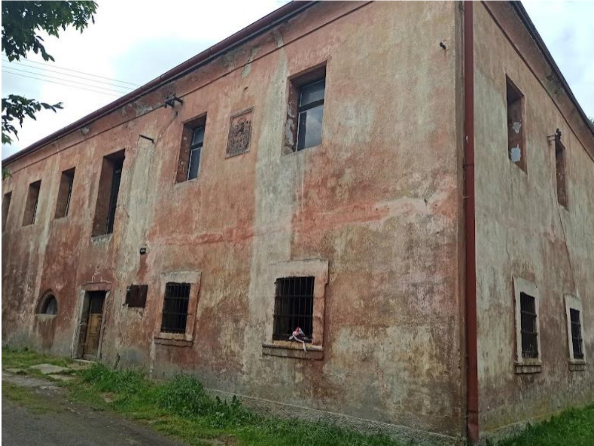
Obrázek č. 41: Tvrz Šabina