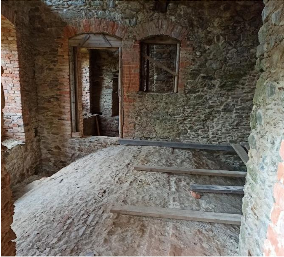
Obrázek č. 6: Vrchní část nové klenby na hradu Hartenberg(k)