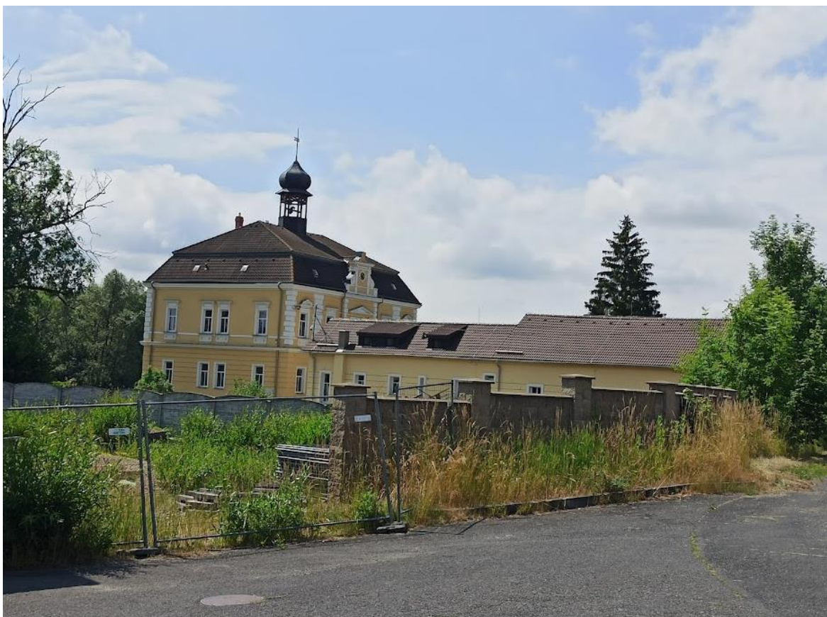
Obrázek č. 24: Zámek Lítov