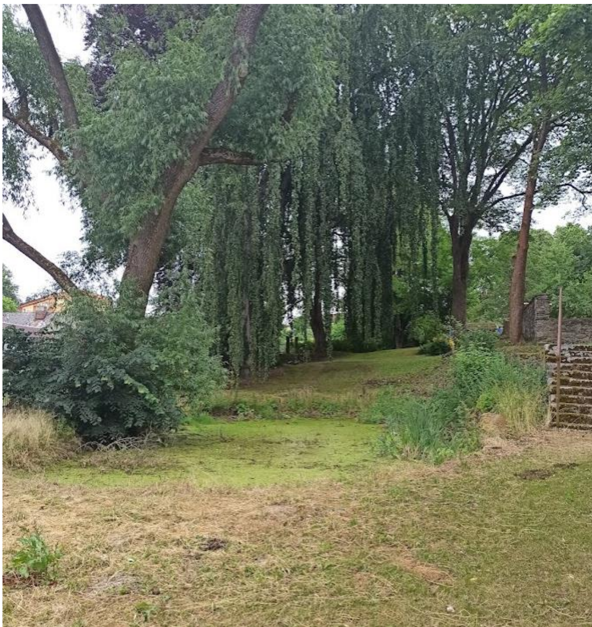
Obrázek č. 28: Zámecká zahrada v Kostelní Bříže