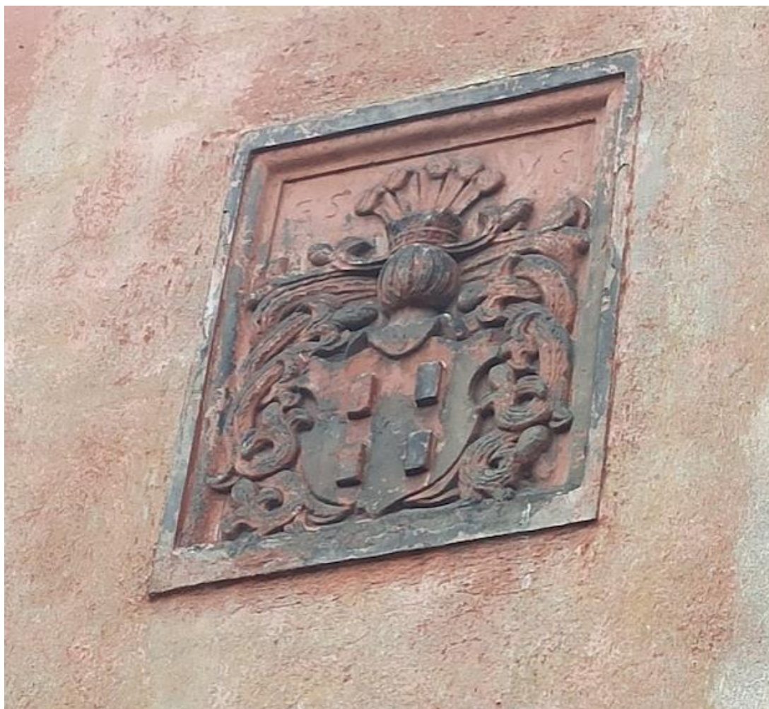
Obrázek č. 42: Dochovaný erb na tvrzi Šabina