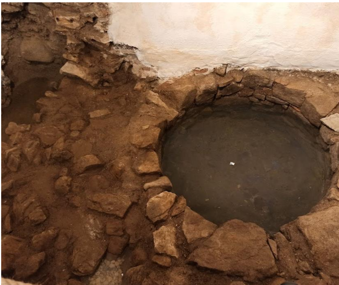
Obrázek č. 18: Dochovaná studna ve sklepeních sokolovského zámku