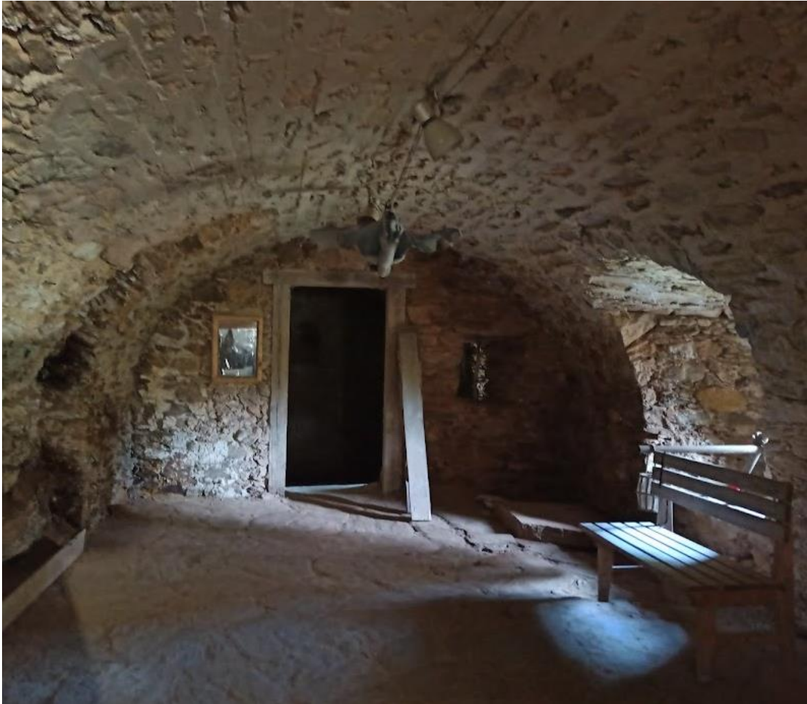
Obrázek č. 4: Interiér hradu Hartenberg(k)