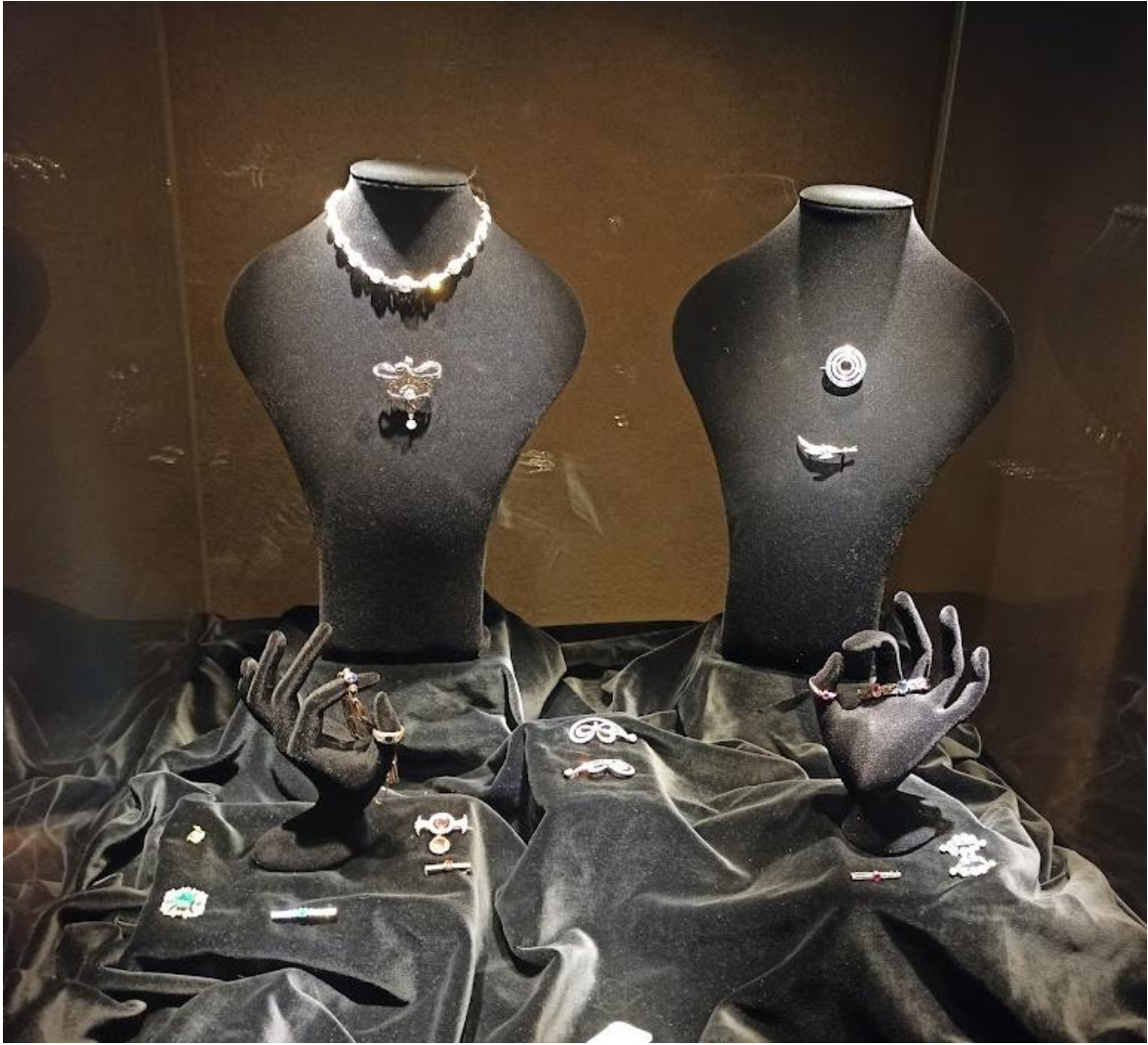
Obrázek č. 16: Sokolovský poklad (vpravo se nachází šperk z období Art Deco)