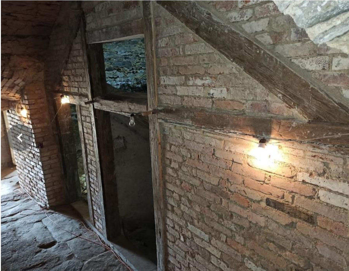
Obrázek č. 3: Interiér hradu Hartenberg(k)