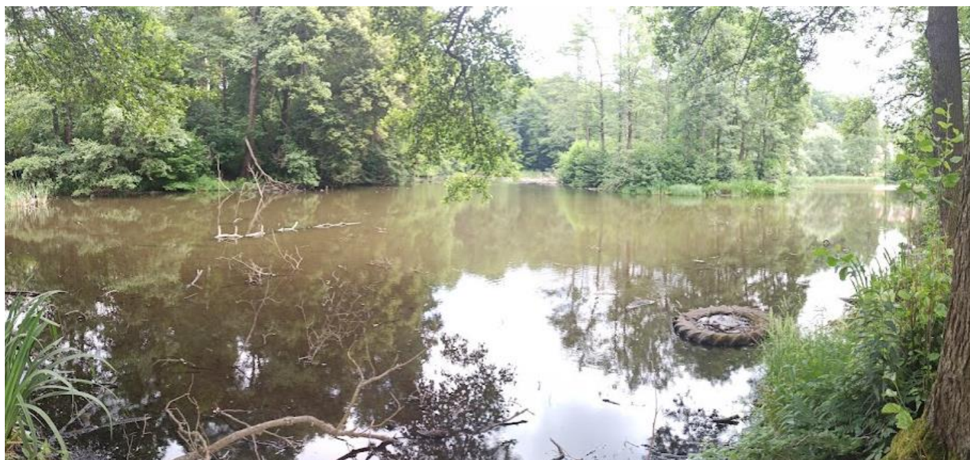
Obrázek č. 32: Přilehlý rybník zámku Kaceřov