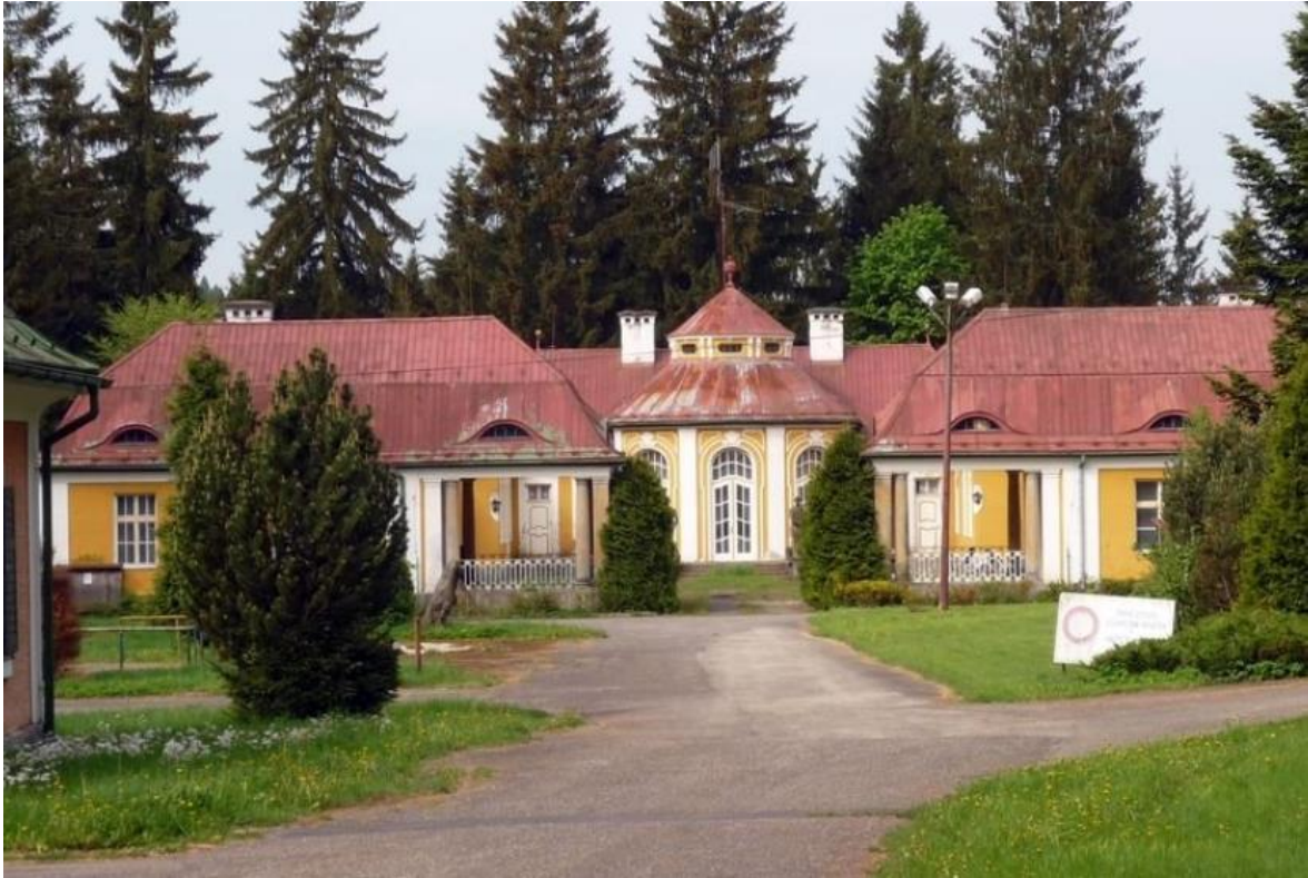
Obrázek č. 39: Zámek Favorit 240