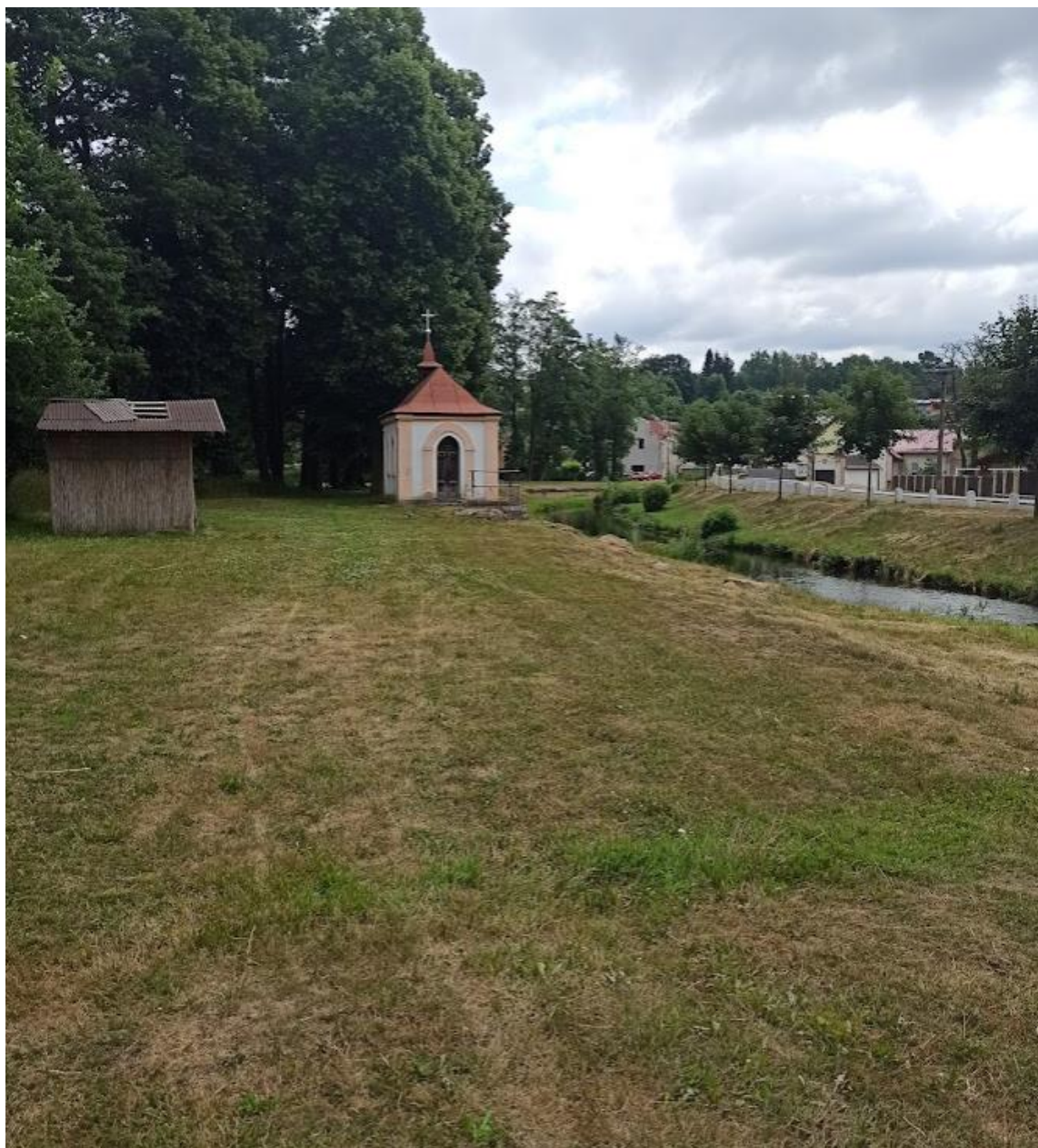
Obrázek č. 33: Přístupová cesta k zámku Kaceřov (empírová kaplička)