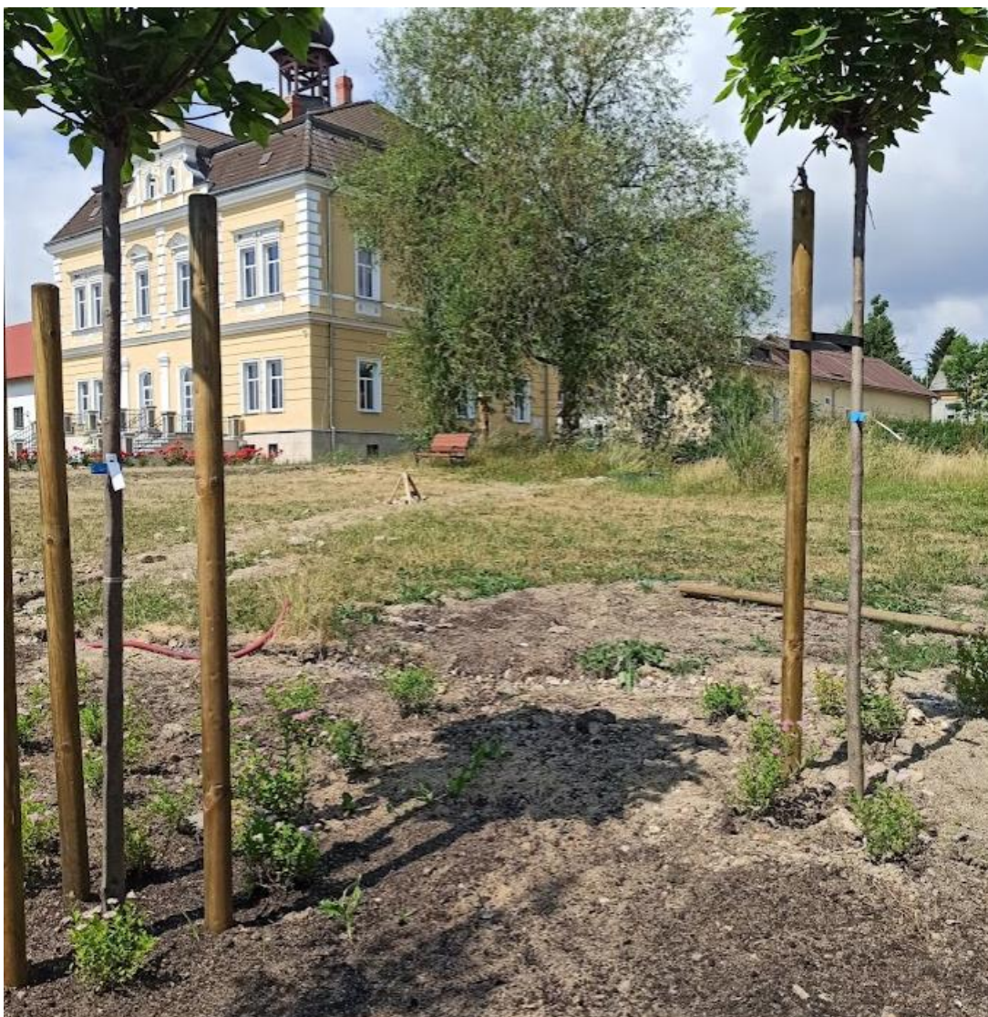
Obrázek č. 25: Část pozemku zámku Lítov