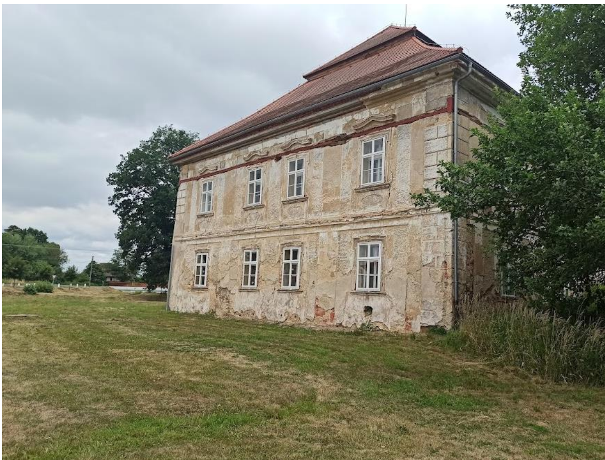
Obrázek č. 30: Boční část hradu v Kaceřově