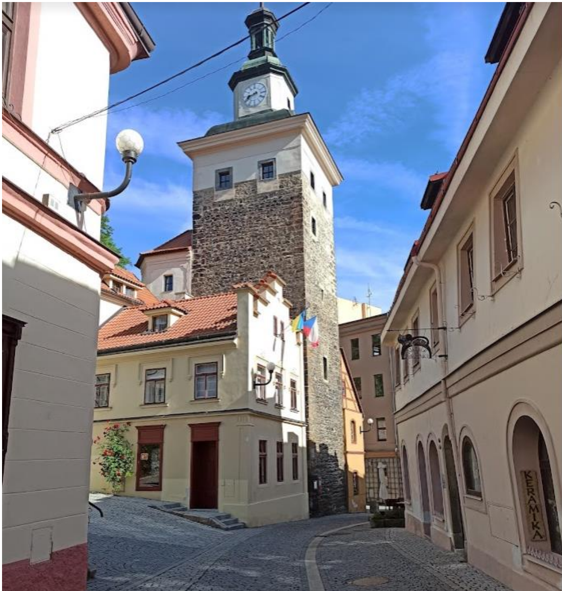
Obrázek č. 13: Černá věž ve správě hradu Loket