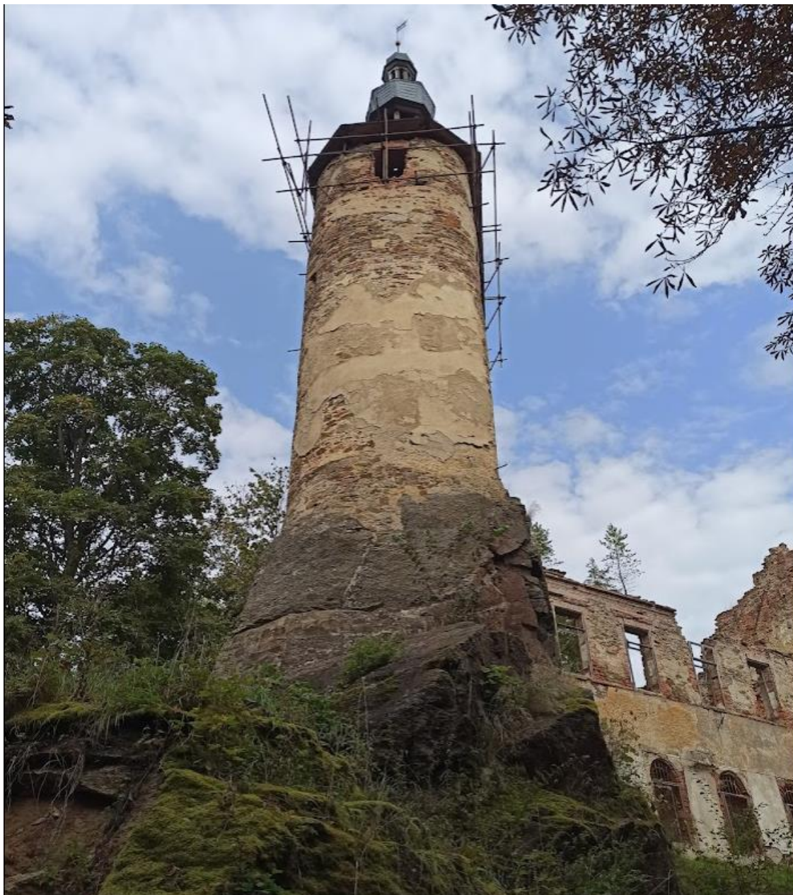
Obrázek č. 2: Centrální věž hradu Hartenberg(k)