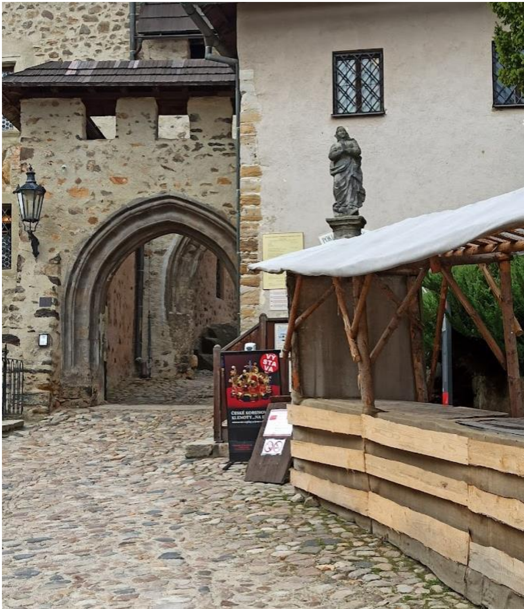
Obrázek č. 12: Vstupní brána na hrad Loket