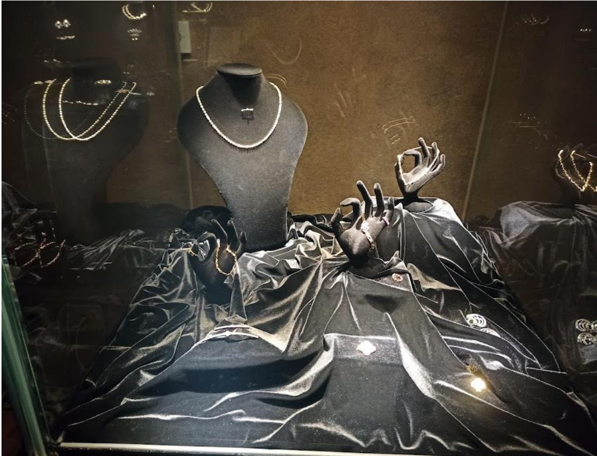
Obrázek č. 15: Sokolovský poklad