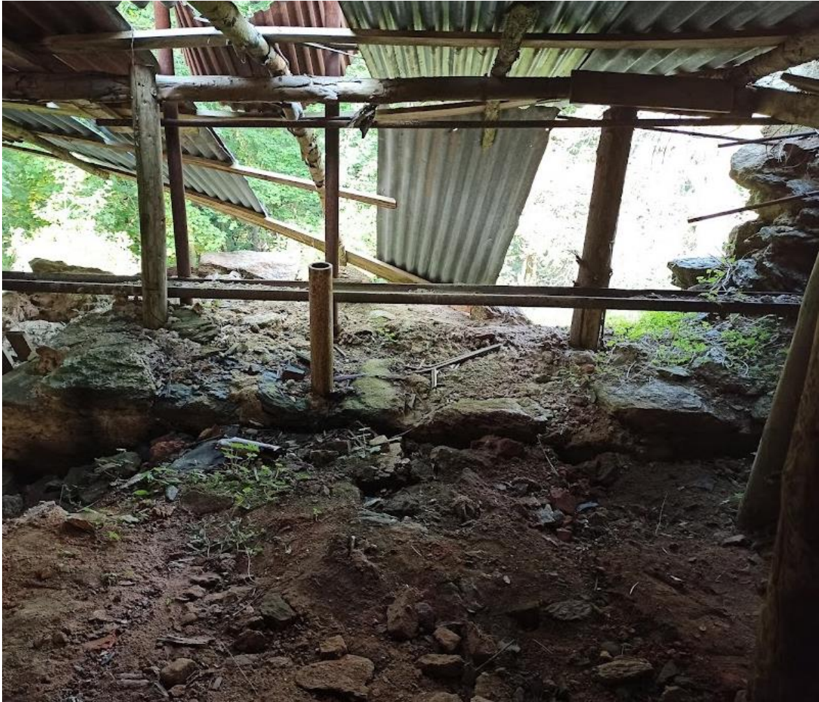
Obrázek č. 5: Tzv. Injektáže na hradu Hartenberg(k)