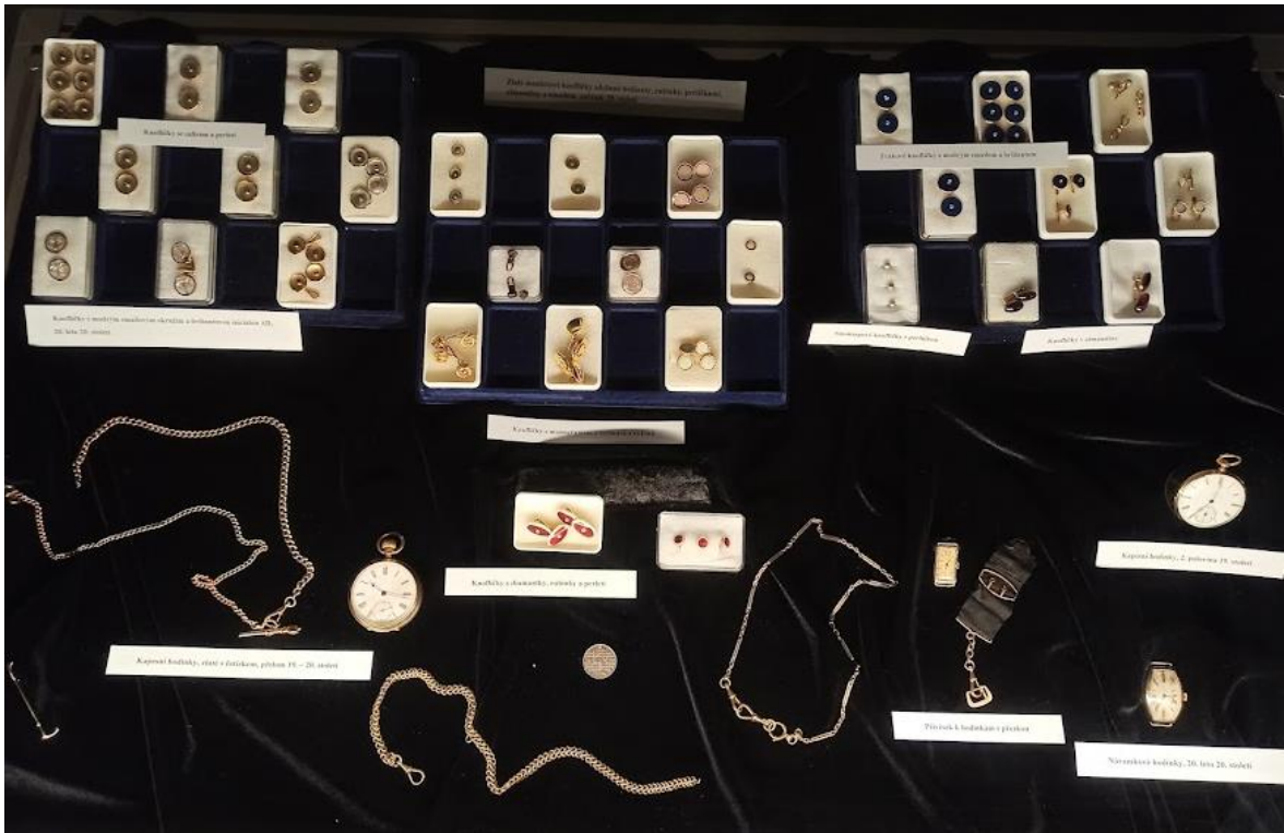
Obrázek č. 17: Sokolovský poklad (pánské doplňky)