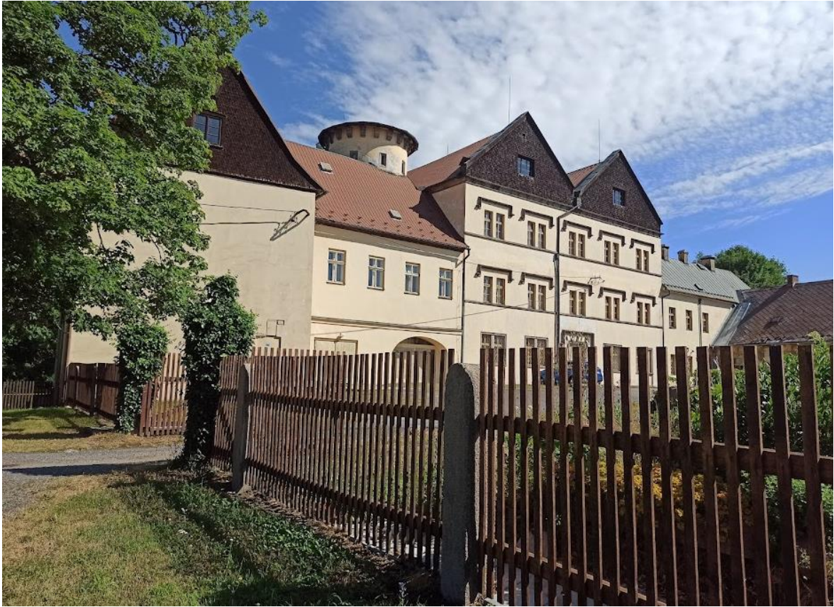
Obrázek č. 21: Zadní strana zámku v Jindřichovících