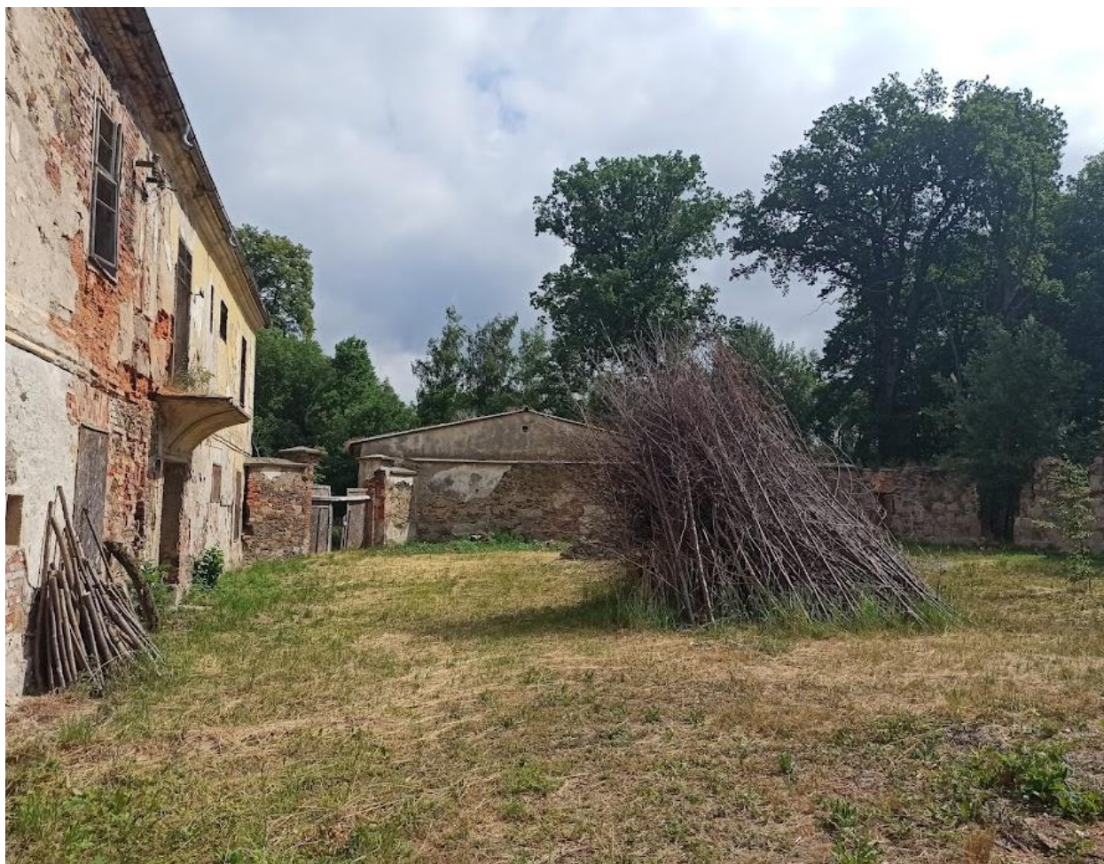
Obrázek č. 38: Vnitřní dvůr zámku Arnoltov