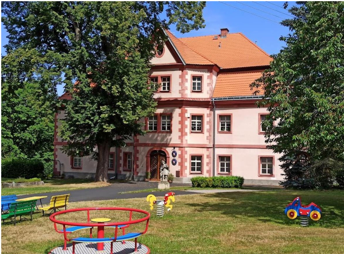
Obrázek č. 23: Zámek Staré Sedlo