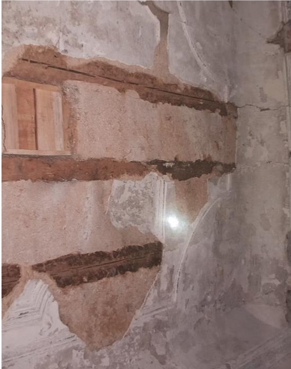
Obrázek č. 35: Strop č. 4 před restaurování na zámku v Kaceřově 238