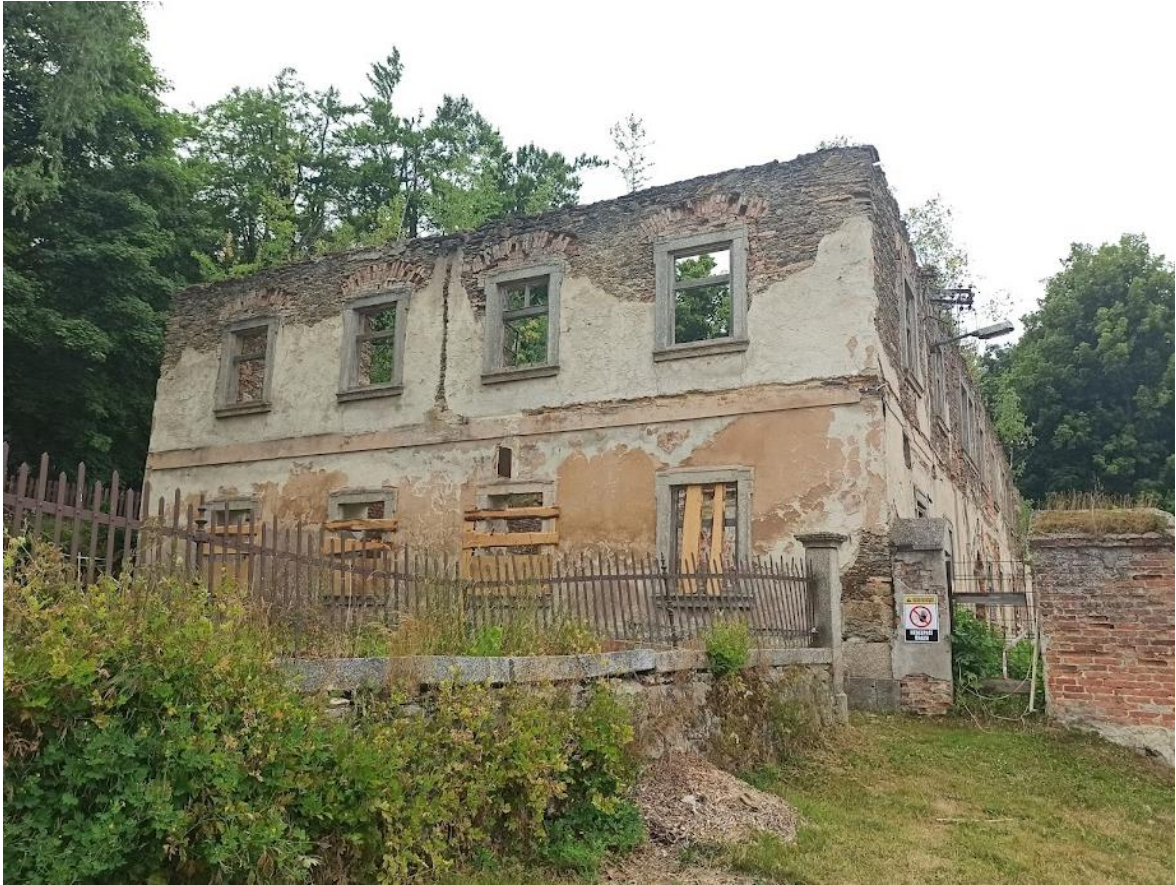
Obrázek č. 27: Zámek v Kostelní Bříže