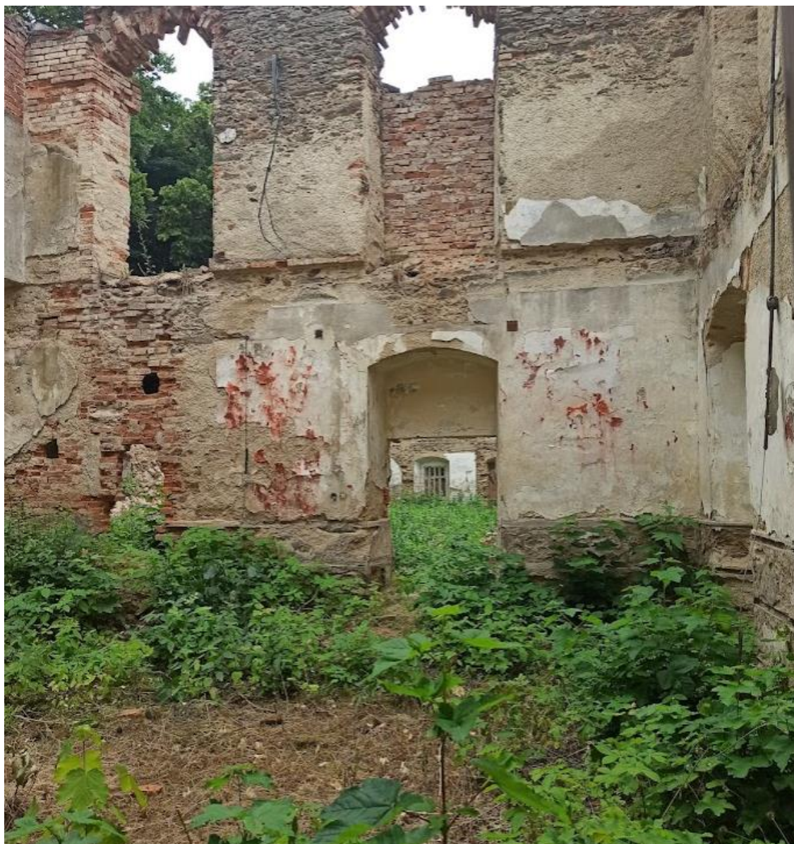
Obrázek č. 29: Vnitřní část zámku v Kostelní Bříze