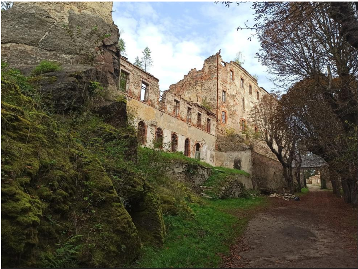
Obrázek č.1: Přední část hradu Hartenberg(k)