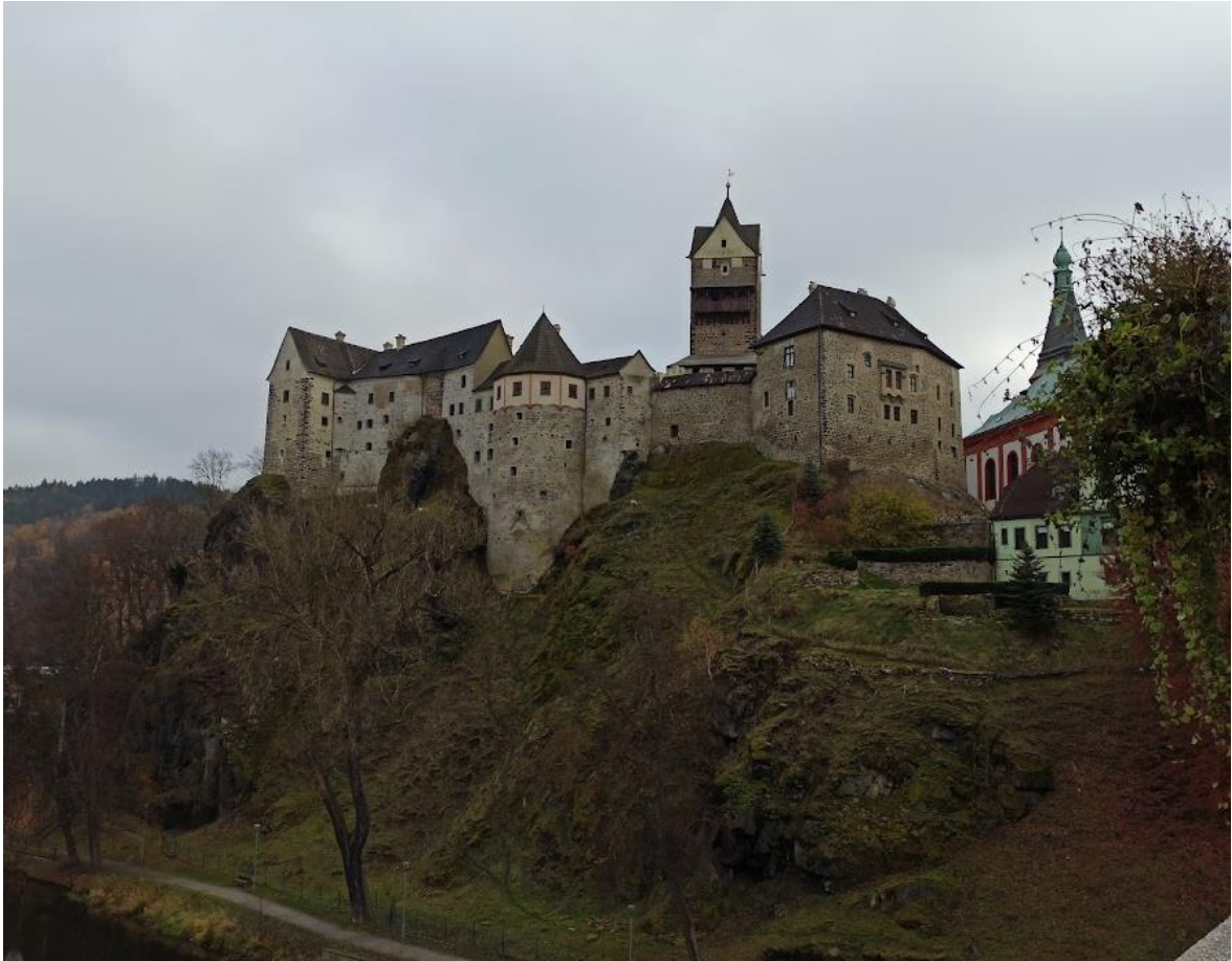
Obrázek č. 11: Hrad Loket