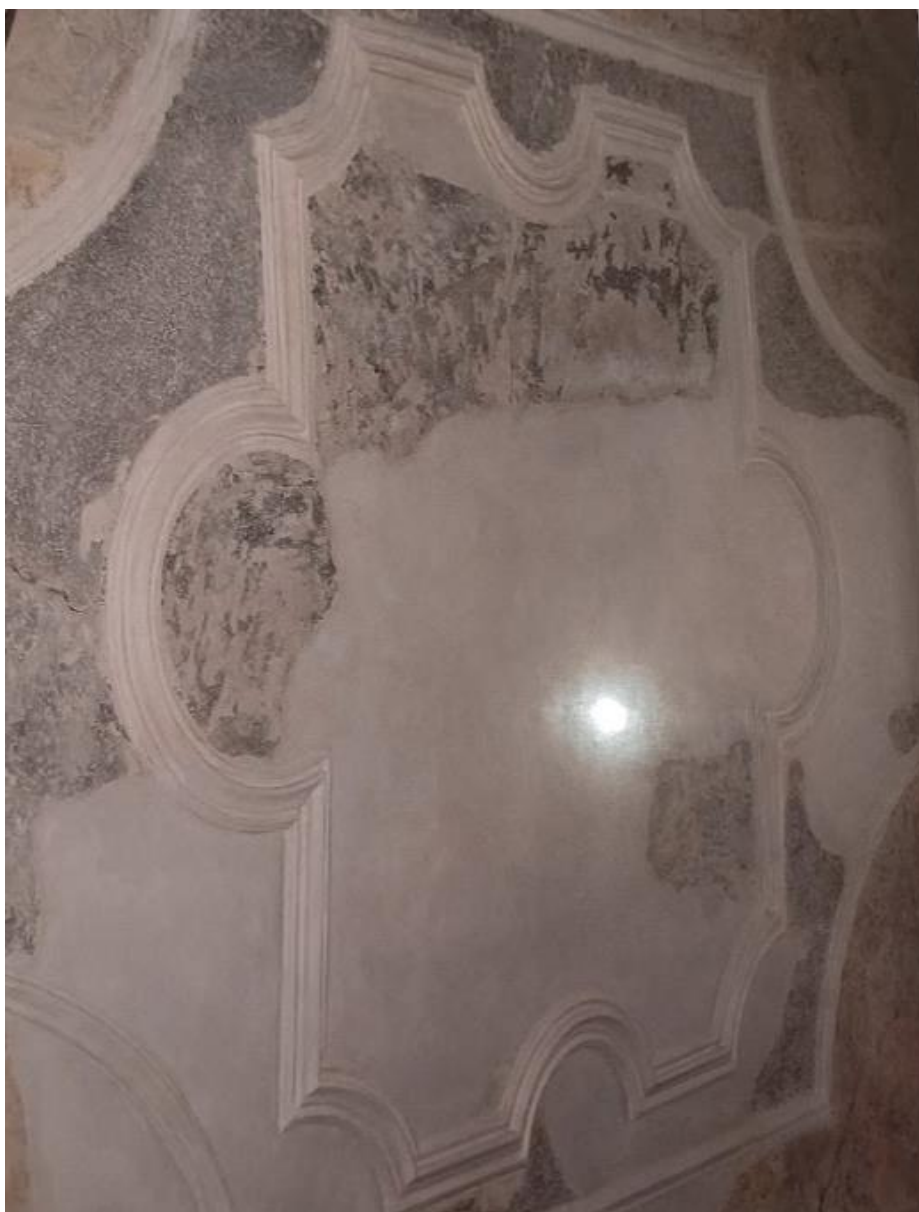
Obrázek č. 36: Strop č. 4 po dokončení (zámek Kaceřov) 239