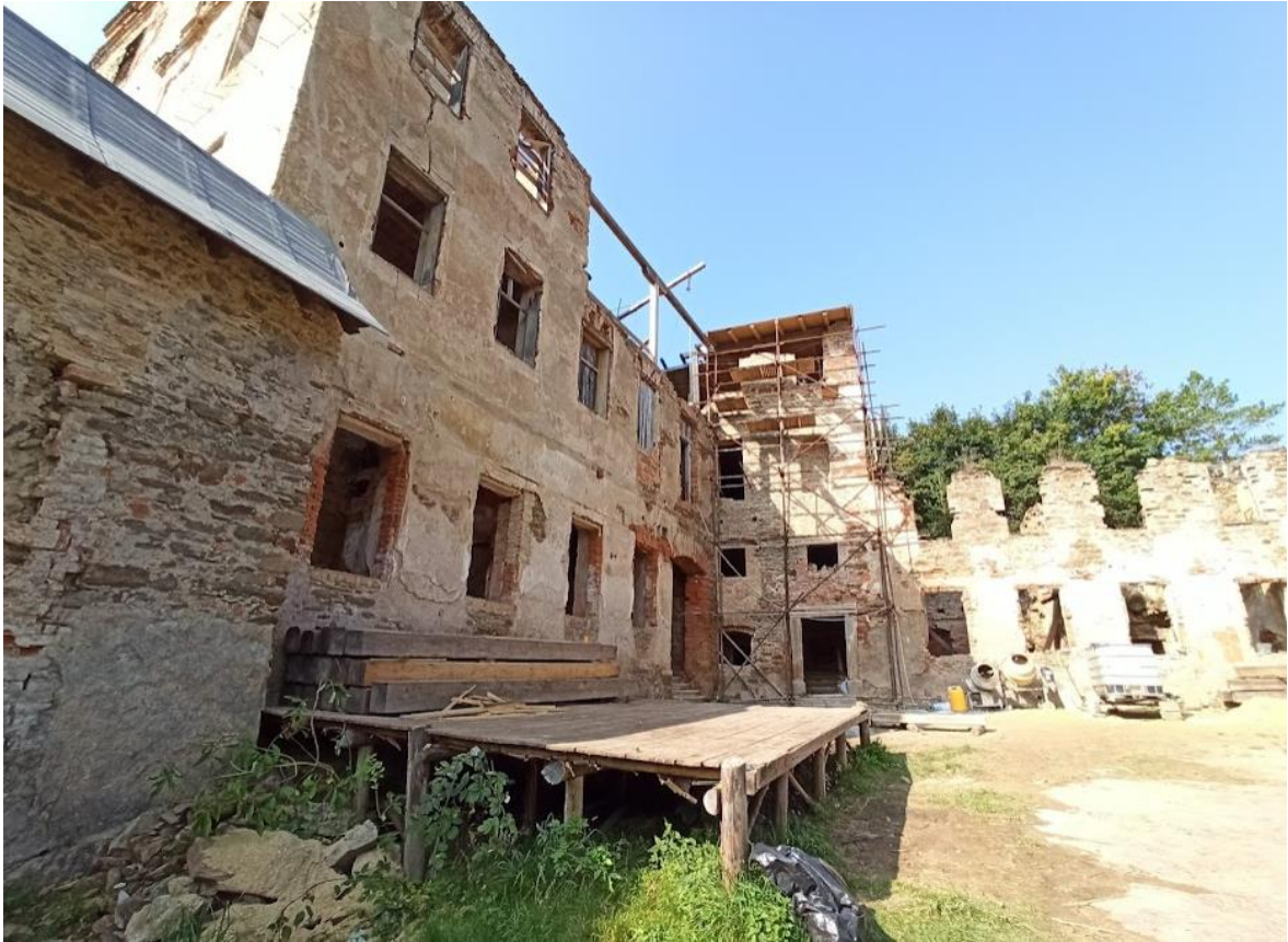
Obrázek č. 9: Vnitřní část hradu Hartenberg(k)