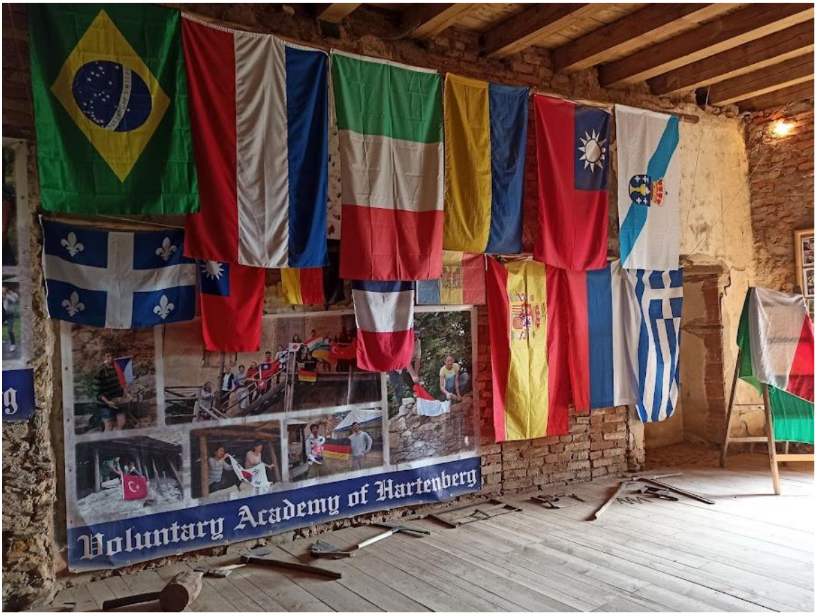
Obrázek č. 7: Místnost věnována dobrovolníkům na hradě Hartenberg(k)