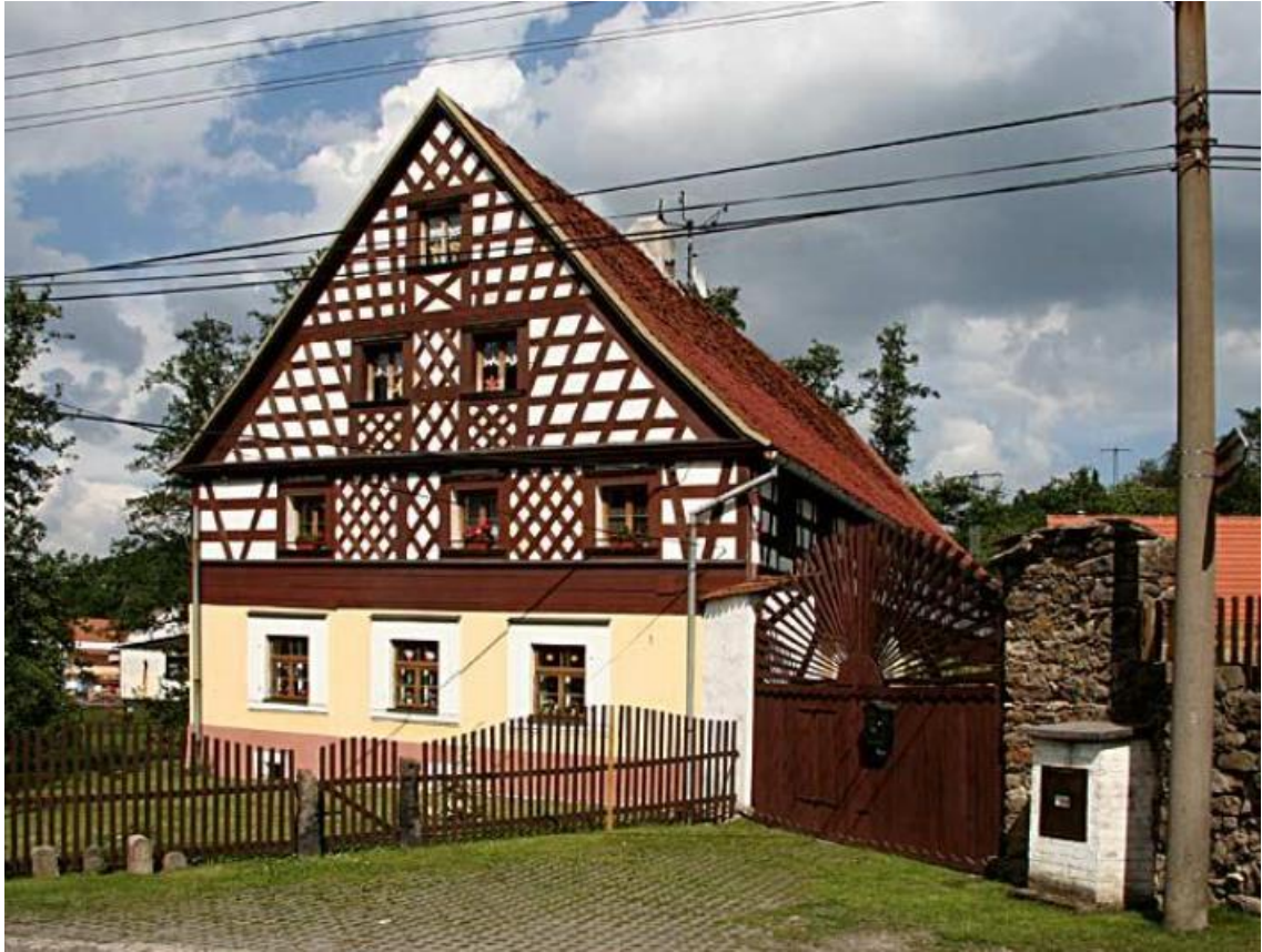
Obrázek č. 40: Tvrz Těšovice 241