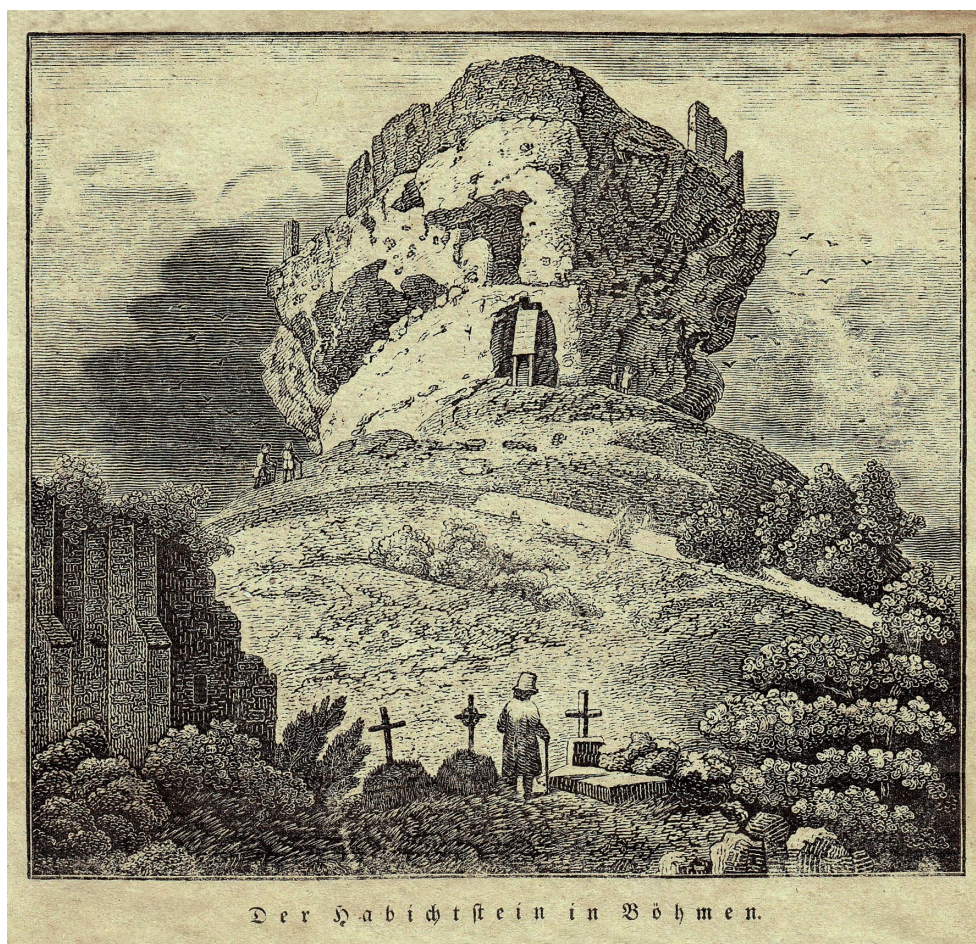
Obr. 4. Nesignovaná a nedatovaná litografie hradu Jestřebí z doby po roce 1825 (Vlastivědné muzeum a galerie v České Lípě, Sběrka grafiky, inv. č. V-5425). – Abb. 4. Lithografie der Burg Habichtstein ohne Signatur und Datierung aus dem Zeitraum nach dem Jahre 1825 (Heimatkundliches Museums und Galerie in Böhmisches Leipa, Grafische Sammlung, Inv. Nr. V-5425)