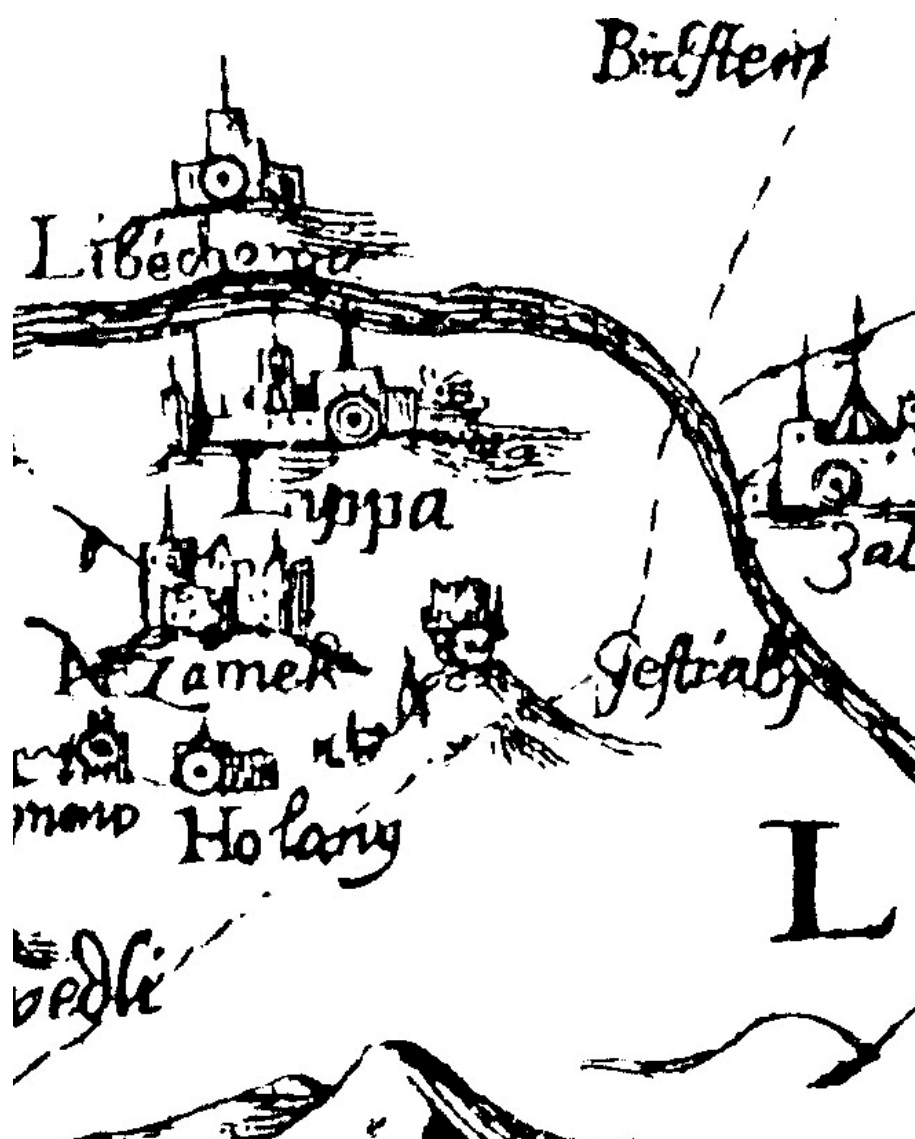
Obr. 1. Výřez z mapy Pavla Aretina z Ehrenfeldu z roku 1619, resp. 1632, s vyobrazením hradu Jestřebí (Mapová sbírka Univerzity Karlovy v Praze, sign. D1/8/1; jako celek je mapa dostupná on-line: http://www.staremapy.cz/antos/zoomify/aretin.html ). – Abb. 1. Landkartenausschnitt der Landkarte von Pavel Arentin von Ehrenfeld vom Jahr 1619, bzw. 1632, mit der Abbildung der Burg Habichstein (Landkartensammlung der Karls Universität in Prag, Signatur D1/8/1, als Ganzes steht die Landkarte auf http://www.staremapy.cz/antos/zoomify/aretin.html zur Verfügung).

Aretinova mapa se odlišuje od jiných map tím, že místa zde nejsou vyznačena pouze kroužkem či jinou podobnou značkou, ale malou kresbou města, hradu či zámku. V řadě případů nemůže být pochyb, že autor uvedená místa znal, ať již z autopsie či z jiného vyobrazení, neboť jsou vyobrazena s neobvyklým smyslem pro realitu. Takovým místem je nepochybně právě hrad Jestřebí (obr. 1).