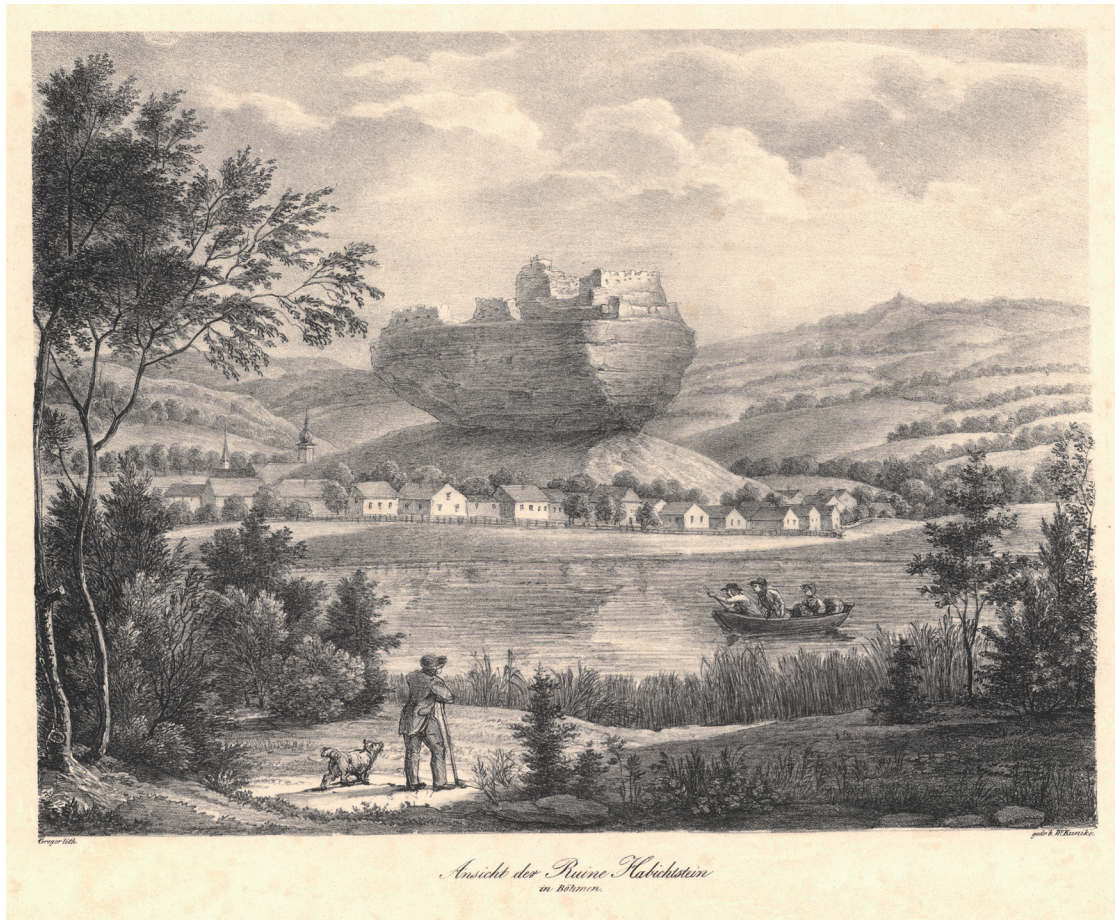
Obr. 5. Litografie podle kresby Adolfa Friedricha Kunikeho z doby okolo roku 1824 (Národní muzeum Praha, Oddělení starších českých dějin, inv. č. H2-027046). – Abb. 5. Lithografie der Burg Habichstein nach der Zeichnung von A. Kunike aus dem Zeitraum um 1824 (Nationalmuseum Prag, Abteilung der älteren böhmischen Geschichte, Inv. Nr. V-5425).