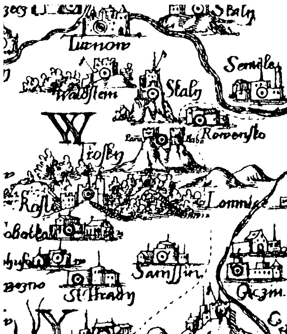
Obr. 2. Výřez z mapy Pavla Aretina z Ehrenfeldu z roku 1619, resp. 1632, s vyobrazením hradů Trosky a Kost (Mapová sbírka Univerzity Karlovy v Praze, sign. D1/8/1; jako celek je mapa dostupná on-line: http://www.staremapy.cz/antos/zoomify/aretin.html ). – Abb. 2. Landkartenausschnitt der Landkarte von Pavel Aretin von Ehrenfeld vom Jahr 1619, bzw. 1632, mit der Abbildung der Burgen Trosky und Kost.

Neobyčejnou věrnost v zachycení podoby hradu Jestřebí potvrzuje na mapě vyobrazení dalšího zajímavého hradu, jímž jsou Trosky (obr. 2). Naprosto přesně jsou tu zachyceny oba sopečné sopouchy s věžemi na nich a dokonce i s jejich pojmenováním (Paňa, Baba). Jedná se pravděpodobně o nejstarší písemné zachycení názvů obou věží. Dosti realisticky s velkou věží je zachycen také nedaleký hrad Kost. Při pohledu na mapu bychom v jiných oblastech nepochybně objevili další lokality překvapující svým věrným vyobrazením.