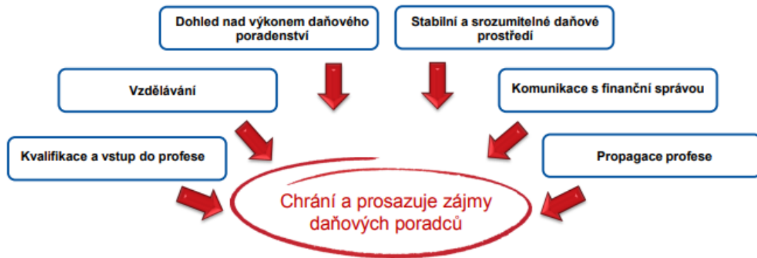
Obr. 2: Strategické priority KDPCŘ pro roky 2019-2021

Prezidium KDPCŘ rozhoduje o zásadních věcech spojených s fungováním Komory. Prezident, volený tajnou volbou členy prezidia, zastupuje a jedná za Komoru navenek. Dále jsou součástí prezidia viceprezident, 9 členů a 2 náhradníci (Komora daňových poradců ČR, 2022).