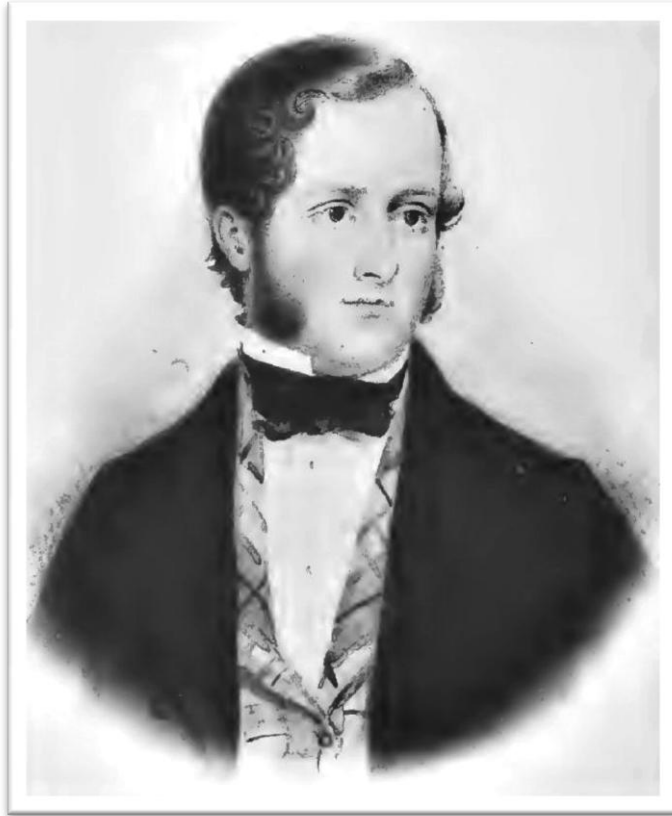
Obrázek č. 1 – Mladý Edward Augustus Freeman