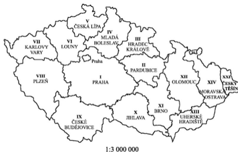
Obrázek 2 Nerealizované flupní zřízení

I když byl flupní zákon přijat, k jeho realizaci nikdy v plném rozsahu nedošlo. Důvodem k jeho nerealizaci byl nedostatek finančních prostředků. flupní zákon byl realizován pouze zčásti, a to v roce 1923 na území Slovenska, což vedlo k vytvoření správního dualismu v republice.