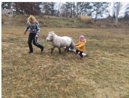
Obrázek 31 - dovednost přeskočení klády