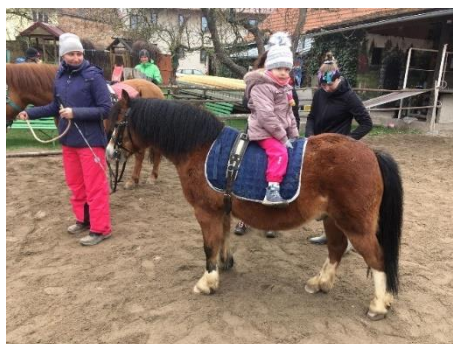
Obrázek 14 - poloha v obráceném sedu

Dítě v této poloze usadíme na koně v obráceném sedu – pohled směřuje na zád koně. Dítě usadíme do takové polohy, aby se rukama mohlo opřít o madla či o hřbet koně. Tato poloha je náročnější a je dobré ji vykonávat po předchozí stimulaci pomocí polohy vleže na břiše proti směru s oporou o zád koně. Náročnost pozice se může projevit na rychlé únavě, v tom případě je vhodné přejít zpět do jednodušších pozic, přímo se nabízí právě přechod do relaxační polohy lehu proti směru jízdy.