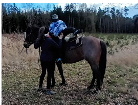
Obrázek 9 - sesedání na zem s dopomocí