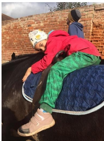
Obrázek 15 - poloha leh na břicho po směru jízdy

Dítě usadíme na koně ve směru jízdy, poté se dítě předkloní až do polohy lehu. Ruce jsou volně svěšené, popřípadě se nabízí cvik obejmutí, kdy může dítě obejmout krk koně. Tato poloha je nejen uvolňující. Je vhodné ji zařazovat na začátek terapií k seznámení s koněm, ale i v průběhu terapie kde působí relaxačně. Poloha ve formě objetí velmi významně stimuluje emoce dítěte.