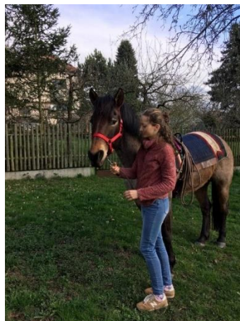
Obrázek 6 – vedení u hlavy na ohlávce a uzdečce