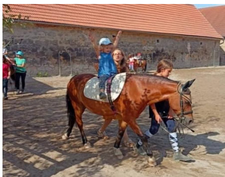
Obrázek 20 - cvik vzpažení

Tento uvolňující cvik můžeme použít např. ve spojení s motivací trhání jablíček či hrušek, ale také při zdravení sluníčka. Ruce dítě vzpaží symetricky. Lze volit různé časové úseky, kdy bude mít dítě ruce ve vzpažení. Na tomto cviku lze také dobře procvičovat samostatný pohyb pravé a levé paže – chvíli může trhat jablka pouze pravá paže, chvíli pouze levá paže.