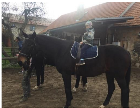
Obrázek 12 - poloha sed s držením

Dítě v této poloze sedí na koni obkročmo, samostatně, přidržováno je ze země fyzioterapeutem či asistentem. Samo se drží madel na obříšniku, který je umístěn těsně za kohoutkem koně. Zde má kůň své těžiště, proto je důležité dítě posadit do co největší blízkosti madel. Polohu je vhodné využívat u dětí, které jsou zdravé, popřípadě je jejich hybnost zachována a úroveň vzpřímení dovoluje tuto polohu provést. Je důležité zvolit vhodnou šířku koně, aby dítěti bylo umožněno dostatečné roznožení.