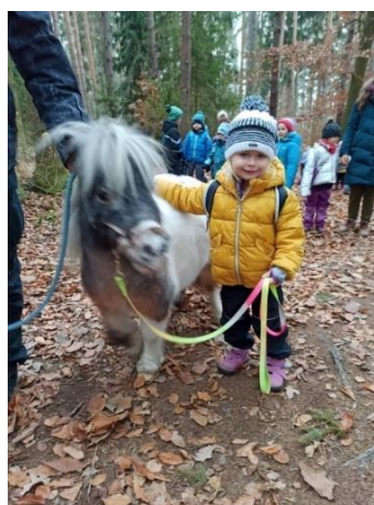
Obrázek 28 - vedení koně dětmi