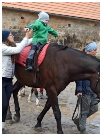
Obrázek 21 - cvik upažení

úklony (letadlo se naklání), nebo mírný předklon (letadlo začíná klesat). Modifikace jsou dobrým způsobem, jak u dítěte ještě více stimulovat udržení rovnováhy na koňském hřbetě.