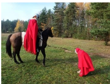
Obrázek 40 – legenda o svatém Martinovi