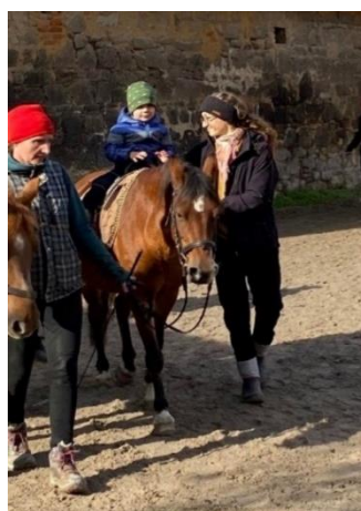
Obrázek 16 - cvik žonglování

Cvik je vhodným prvním krokem u dětí, kteří se obávají opuštění opory madel. Dítěti můžeme nabídnout hru na žongléra, který ruce pozvedne do malé výšky nad úroveň madel. Postupně se může předloktí procvičit, následně otočit a napodobovat pohyby žonglování. Dítě zvedá střádavě pravou a levou ruku. Do rukou také můžeme uchopit skutečný míček, který nám pomůže si hru lépe představit.