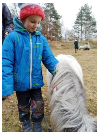
Obrázek 27 - seznámení s minihorses