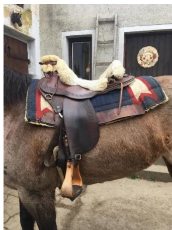
Obrázek 3 - westernové sedlo