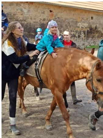
Obrázek 19 - cvik objetí

plec. Pokud se dítě cítí bezpečně, může zavřít oči a vnímat harmonický krok koně. Cvik bývá silně spojen s emocemi – dítě vnímá rytmus, teplo a povrch koňské kůže, což působí příznivě na jeho psychiku.