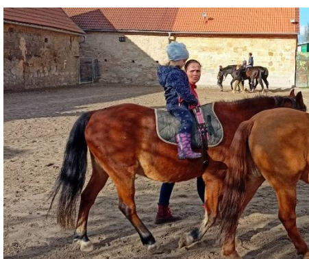
Obrázek 18 -cvik jízda se zavřenýma očima

Cvik významně posilující důvěru mezi koněm, dítětem a pedagogem, který dává dítěti pocit jistoty a bezpečí. Pro některé děti velmi náročný, je vhodné ho provádět v relaxačních polohách, např. v objetí, či v lehu na břicho proti směru jízdy, kdy je dítě na koni více uvolněno. Také v základní pozici v sedu je tento cvik vyhovující. Tělu se tak naskytne příležitost vnímat pohyby na koni prostřednictvím celého těla, a dát prostor také jiným smyslům nežli zraku, který přejímá většinu vjemů z okolí. Děti můžeme motivovat např. tím, že nás jízda na koni tak unavila, že si na jeho hřbetě na chvíli zdřímneme. Pro efektivitu cviku je nutné dítě ubezpečit, že jsme u něj a je bezpečné oči zavřít. Můžeme ho před zahájením cviku chytit za jednu ruku. Vhodné je cvik provádět nejprve v klidu, pokud dítěti nepůsobí potíže, můžeme koně převést do kroku.