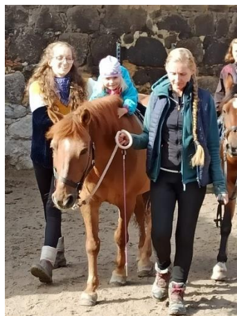
Obrázek 23 - cvik podrbání za ušima

proporcím na uši nedosáhne. Některé děti právě dosažení až k uším velmi motivuje a vytahují se velmi intenzivně. U tohoto cviku dochází k uvolnění páteře v bederní oblasti a zároveň k protažení a aktivaci hýždí a zadní strany stehen. Cvik je opět spojen s emocemi – dítě je v kontaktu s koňskou hřívou, kterou si v průběhu cviku může hladit, případně se jí držet.