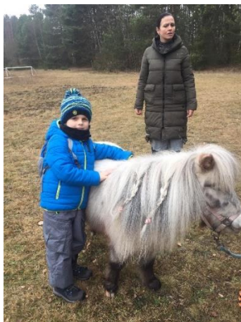
Obrázek 35 - zaplétání copánků