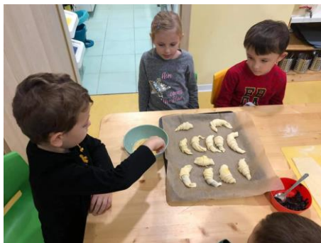
Obrázek 47 – pečení martinských rohlíčků