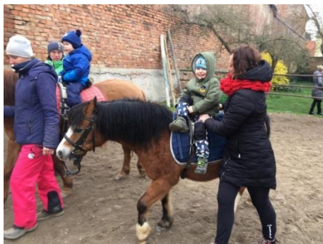
Obrázek 25 - cvik dámský sed

pozice vychází ze základního obkročného sedu. Dítě se přidržuje madel a jednu nohu přehazuje přednožením k noze druhé. Poté můžeme přivést koně do chodu a dítě si může vyzkoušet jízdu v tomto druhu sedu. Tento cvik chtějí provádět zejména dívky, které si v této poloze hrají na princezny.