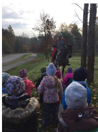
Obrázek 39 – příjezd svatého Martina