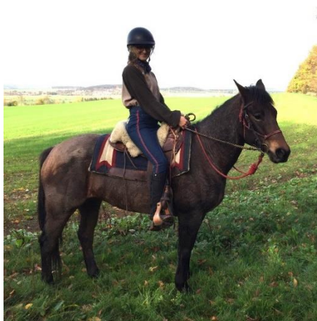
Obrázek 37 - klišna Anie