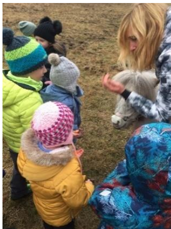
Obrázek 32 - ukázka správného krmení z ruky