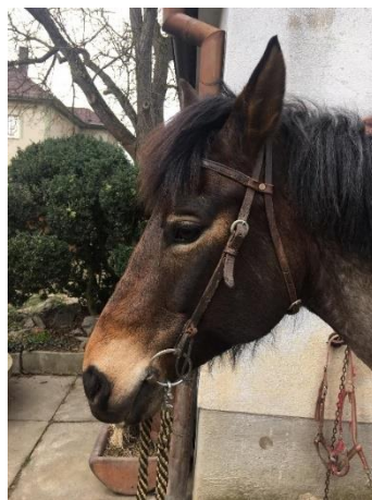
Obrázek 5 - uzdečka a oštěže