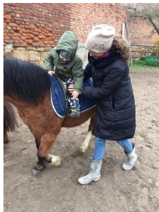
Obrázek 17 – cvik zavázání tkaničky