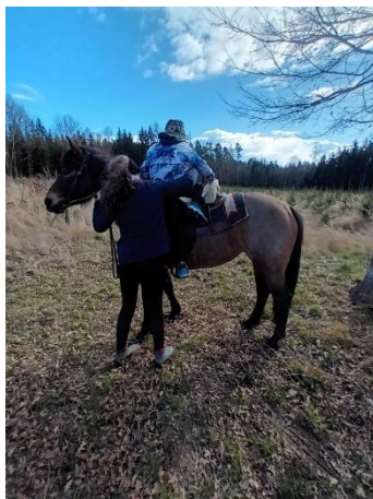
Obrázek 8 - nasedání ze země s pomocí