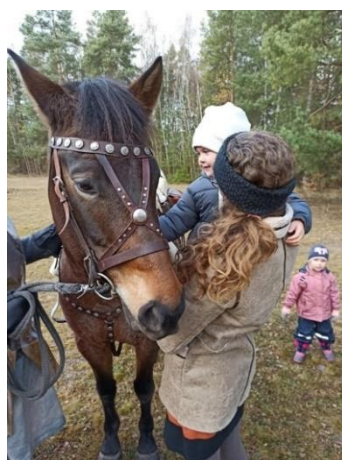
Obrázek 42 – seznamování s koněm