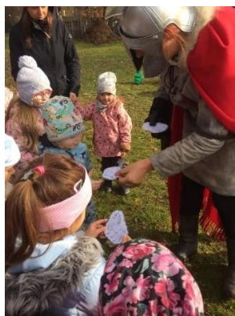
Obrázek 45 – předávání dárků