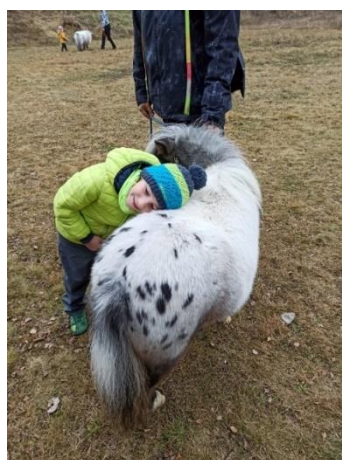
Obrázek 36 - poslouchání srdce koně