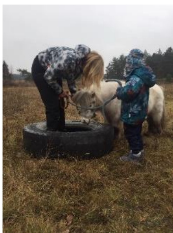
Obrázek 30 - dovednost prolezení pneumatikou