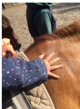
Obrázek 24 – cvik kreslení do srsti

Kreslení do srsti je výborným způsobem, jak ještě více podpořit navázání kontaktu mezi koněm a dítětem. Dítě dotykem vnímá povrch a teplotu koňské kůže. Tím dochází ke smyslové stimulaci nervového systému. Navíc dítě využívá plochu srsti jako kresebnou plochu. Díky této aktivitě můžeme podpořit dovednosti dítěte v oblasti jemné motoriky.