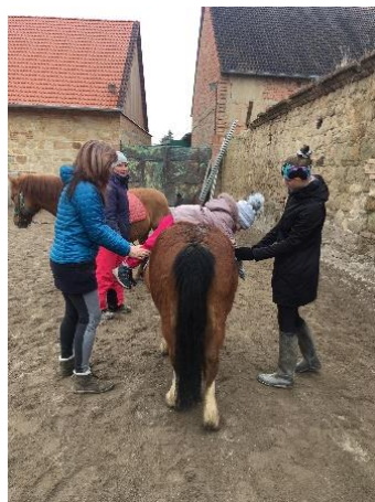
Obrázek 13 - poloha pytel