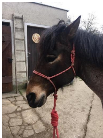
Obrázek 2 - provazová ohlávka s vodítkem