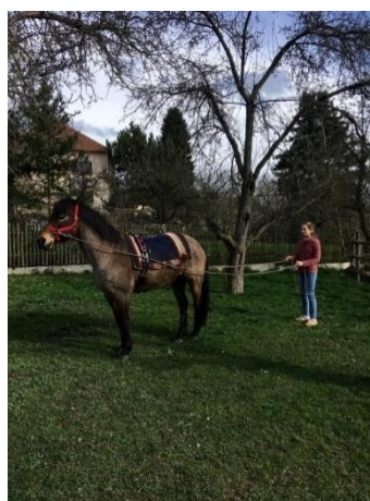
Obrázek 7 – vedení za koněm na lonžích