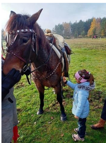
Obrázek 43 – čištění koně