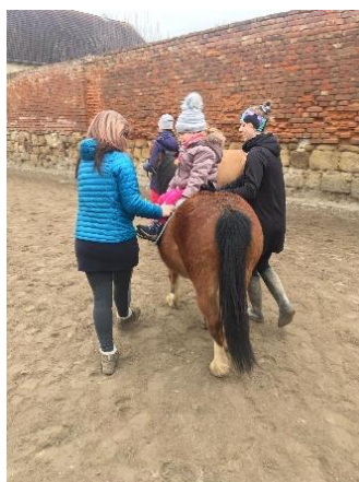
Obrázek 25 - cvik kolotoč

Mezi cviky vhodnými pro děti je právě tento cvik nejnáročnější. Cvik provádíme při zastavení koně. Začínáme podobným postupem jako u provedení cviku dámského sedu. Základní pozicí je pozice obkročného sedu, poté dítě přendá přednožením nohu přes krk koně tak, aby obě dolní končetiny směřovaly na jeden bok koně, poté přecházíme opět do sedu obkročného, tentokrát však proti směru jízdy. To samé opakujeme také na druhý bok koně. Finální pozicí je opět pozice základního obkročného sedu po směru jízdy. V jednotlivých polohách můžeme koně převést do chodu, jízda bokem vyvíjí tlak na dutinu břišní a stimuluje činnost trávicího traktu.