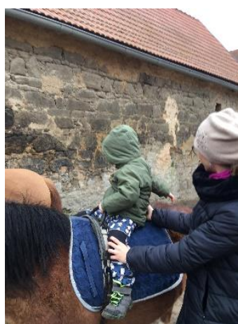
Obrázek 22 - cvik podrbání na ohonu

Jedná se o rotační cvik s mírným záklonem, pro dítě poměrně náročný. Důležitá jsou u tohoto cviku madla. Jednou rukou se dítě přidrží madla, poté postupně rotuje směrem ke koňskému ohonu. Dítě na koňský zadek nejdříve ruku položí, chvíli ji může mít pouze položenou, poté může procvičit prsty a koně podrábat. Dítě motivujeme tím, že koníka chceme na zádi pohladit, případně že ho otravuje moucha a chceme ho podrábat. Poloha nohou odpovídá základnímu sedu.