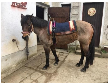
Obrázek 4 - podsedlová deka a obřišník