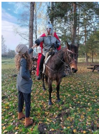
Obrázek 41 – předávání světla