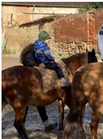
Obrázek 11 - jištění za záď