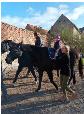
Obrázek 10 - jištění za holeň