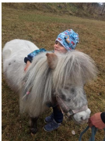
Obrázek 34 - mazlení s koníky