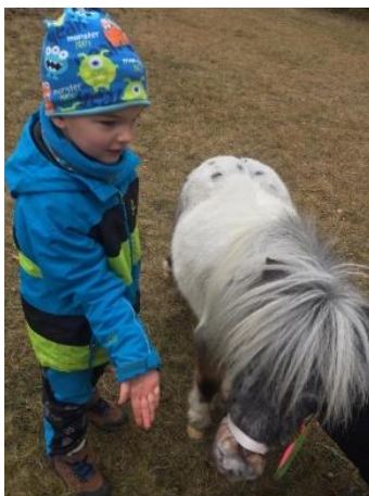
Obrázek 33 - krmení z ruky