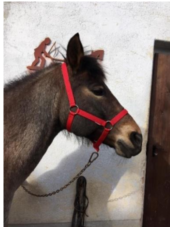
Obrázek 1 - stájová ohlávka

K hipoterapii bylo využíváno tohoto vybavení.