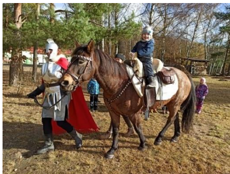
Obrázek 44 – jízda na koni