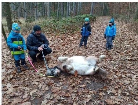
Obrázek 29 - vedení koně dětmi