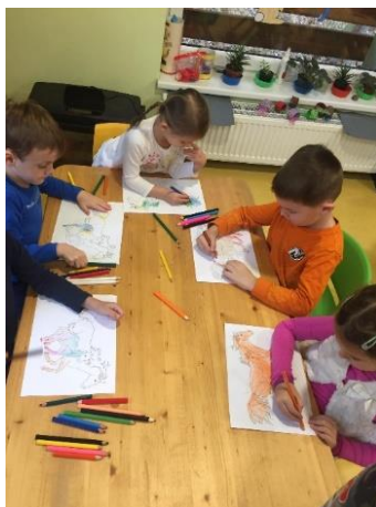
Obrázek 26 - vybarvování obrázku koně