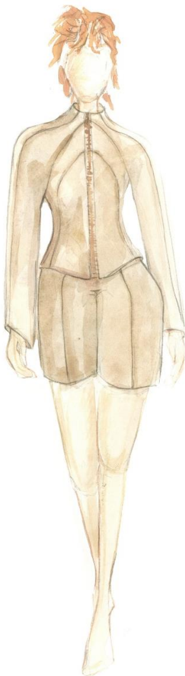
Skice - návrhy modelov- autor