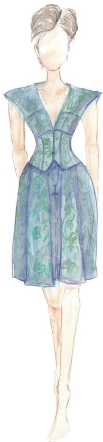
Skice - návrhy modelov- autor