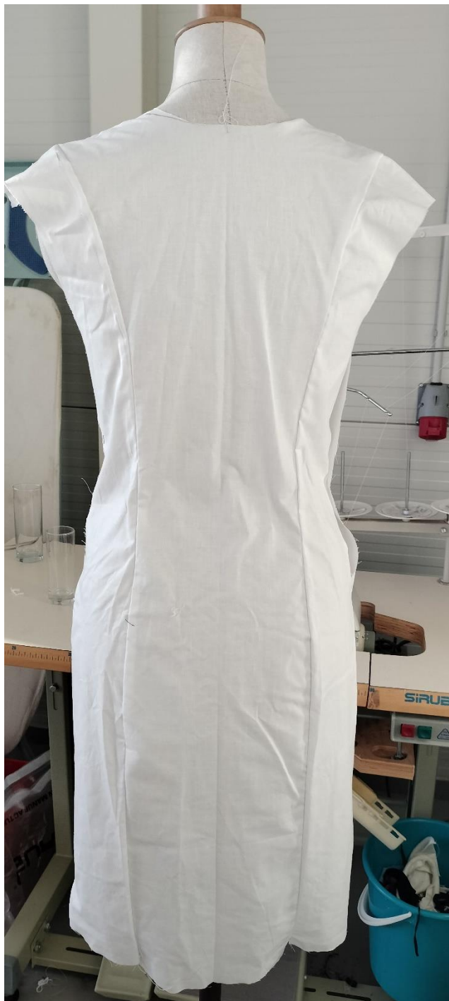
Fotografia - autor