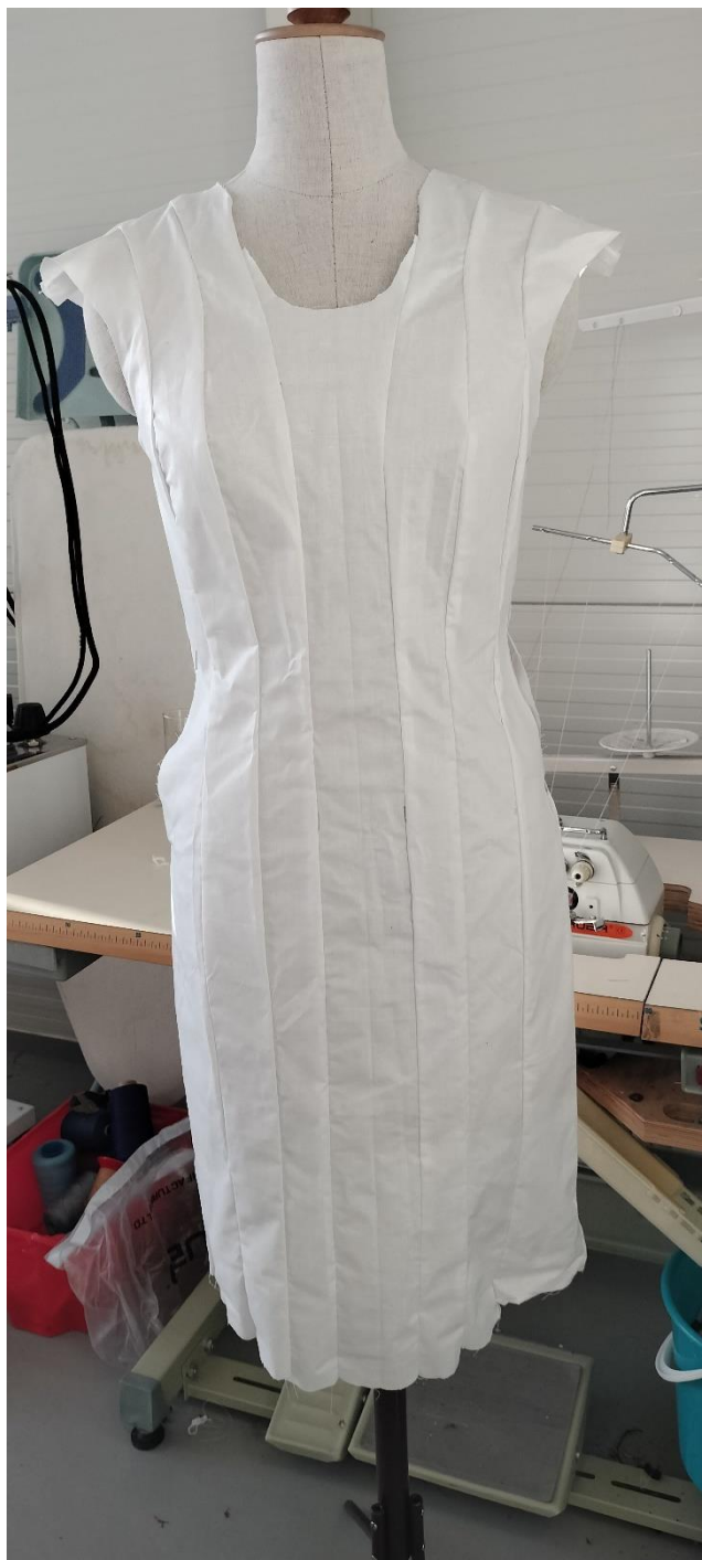
Fotografia - autor