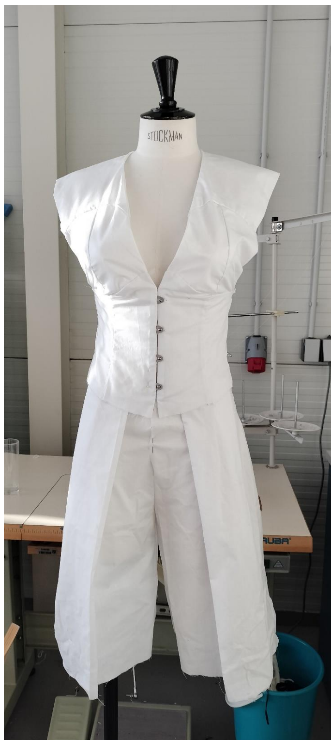
Fotografia - autor