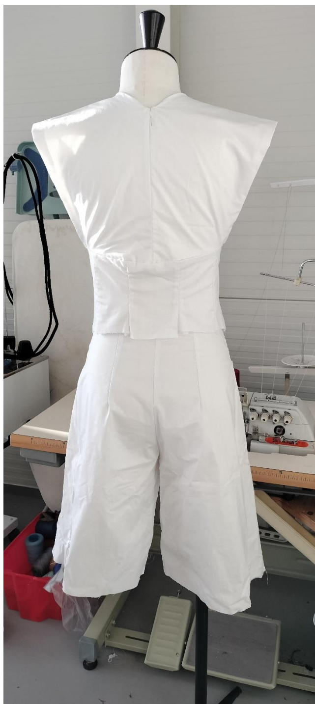
Fotografia - autor