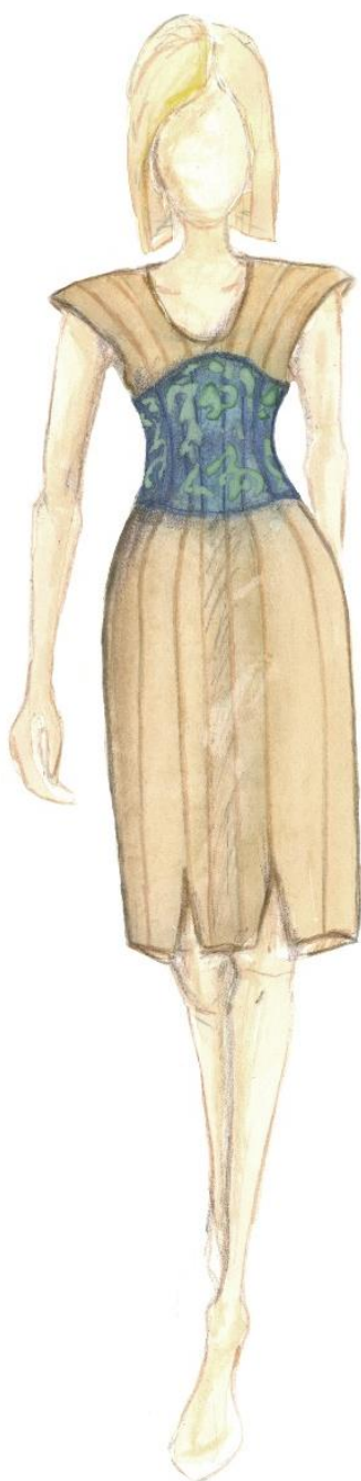
Skice - návrhy modelov- autor