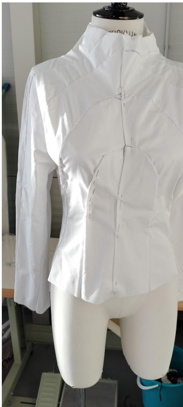
Fotografia - autor