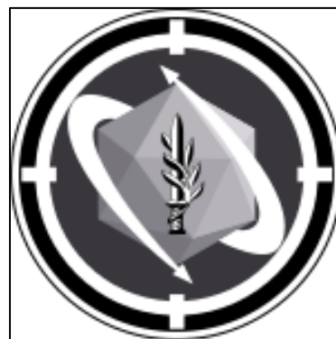
Obrázek 2 - Izraelské pozemní síly 101

IOS se skládají z vojenského letectva, vojenského námořnictva a pozemních sil, které jsou jejich nejpočetnější složkou. Izraelské pozemní síly neboli The Israeli Ground Forces Command sdružuje Velitelství armády GOC neboli Mifkedet Zro'a HaYabasha, ze kterého vzešla zkratka MAZI. Rozděleny jsou do pěti sborů, které nadále tvoří hned několik brigád a pluků. Jedná se o sbor pěší,