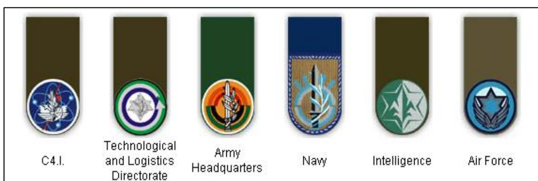
Obrázek 6 - Jednotky IOS

Vojáci izraelské armády mají tři typy insignií, které označují jejich konkrétní jednotku, pozici a sbor, jenž lze snadno rozpoznat dle odznaků na baretech či jejich samotné barvy. Branci procházející základním výcvikem nemají odznak žádný. Pro identifikaci jednotky slouží ramenní štítky, které má každá jednotka vlastní. Problém však může nastat při rozpoznání konkrétní pozice vojáka. Existují dva volitelné prvky v podobě barevné šňůrky připevněné k levému nárameníku a kapse uniformy a odznak sdělující vojákovu pracovní zaměření. Uniformu můžou taktéž zdobit odznaky dodatečně absolvovaných kurzů či nášivky označující účast vojáka v konkrétní válce. Při této příležitosti považují za nutné zmínit, že IOS mají hned několik typů uniforem, které se mění i v závislosti na ročním období a oboru. Základem každodenní služby je služební a polní oděv užívaný při výcviku, boji i práci na základně. Následuje slavnostní oděv či společenská uniforma nošená pouze v zahraničí při oficiálních státních návštěvách. 129 130