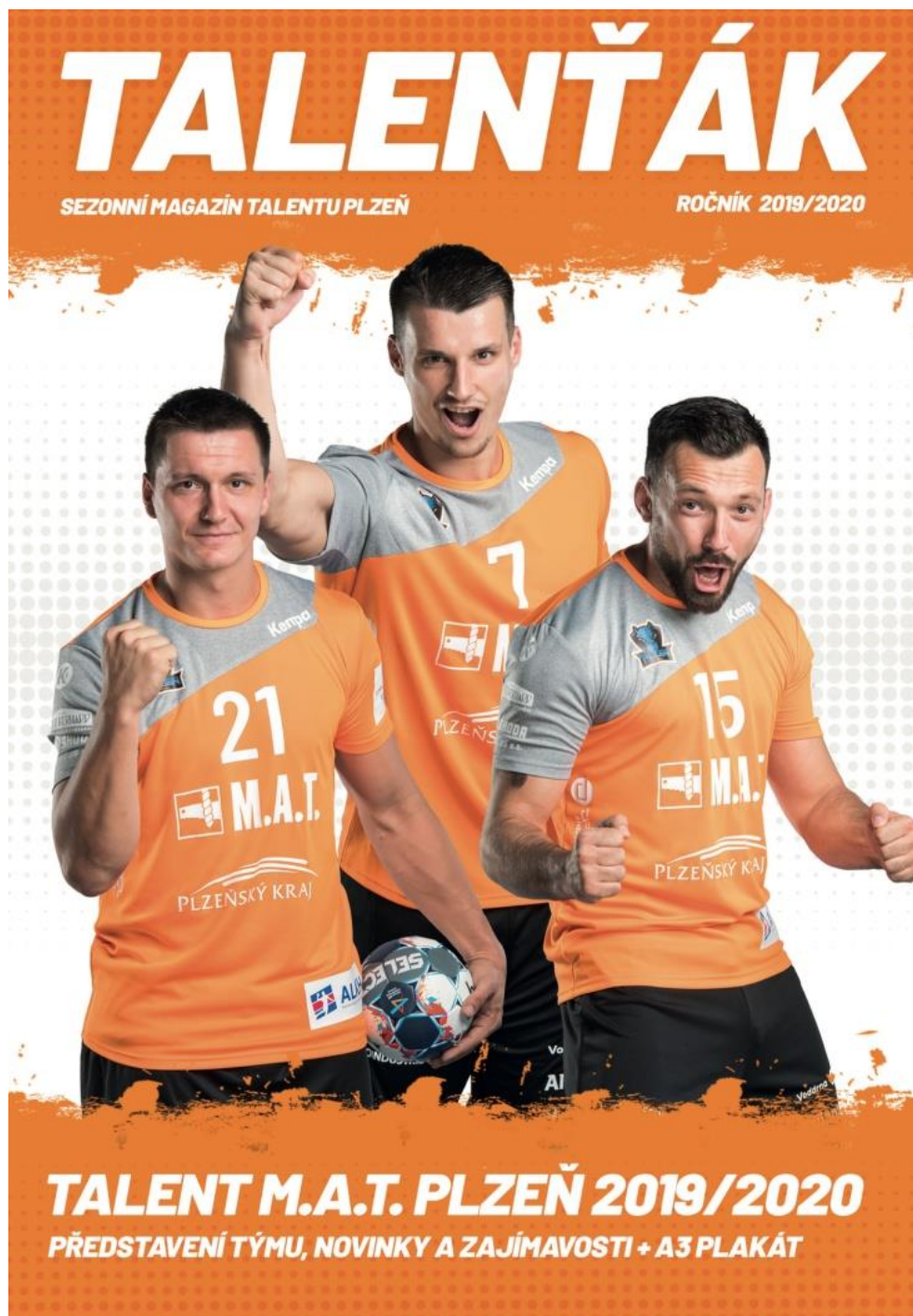
Anlage 5: Titelseite des Saisonmagazins „Talenták“