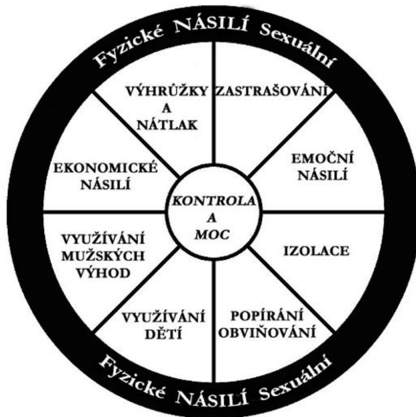
Obrázek 2 : Formy domácího násilí 45

Střílková a Fryšták ve své práci uvádějí hned sedm různých forem domácího násilí: fyzické, psychické, sociální, sexuální, ekonomické, jejich kombinace a pronásledování. V běžném životě se často objevuje několik spojených forem. Obecně nejčastější kombinací je spojení fyzického a psychického násilí. Tyto formy se nám snaží pomoci pochopit, jak velice různorodé domácí násilí ve skutečnosti je. 44