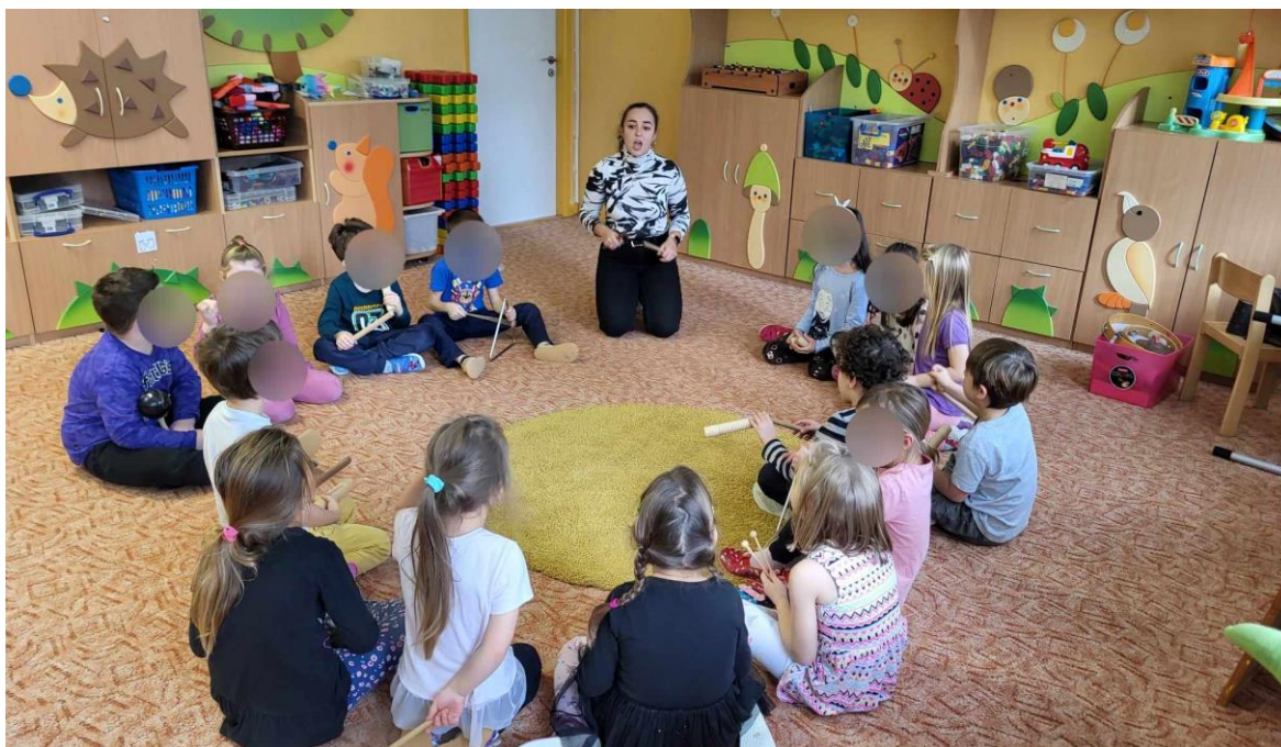
Obrázek 2: Opakování písně Prší, prší

Když se děti soustředily, tak velmi dobře vnímaly měnící se dynamiku. Hodnocení dětí bylo z velké části pozitivní a chtěly hrát na nástroje častěji. Aktivita je určitě vhodná až pro předškoláky. Příště bych podobnou aktivitu ze začátku ještě ulehčila a častěji bych s nimi nejprve dělala např. napodobování rytmu. Domluva ve skupině byla pro ně náročnější, než jsem si původně myslela, takže bych je postupně připravovala na spolupráci a kooperaci.