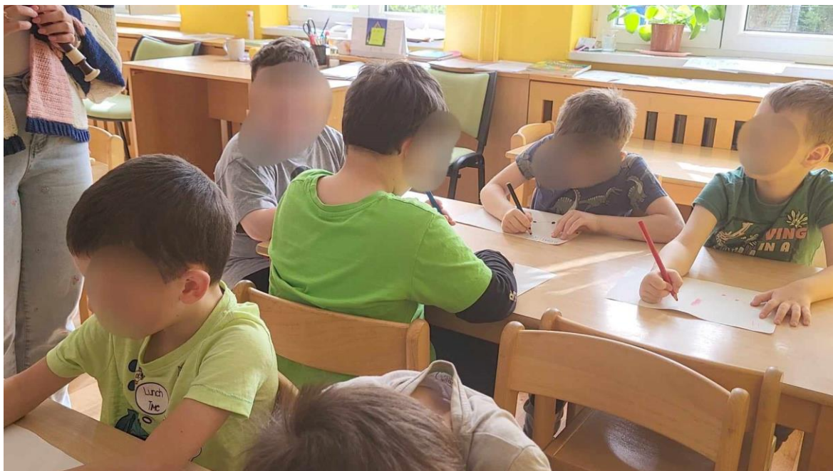
Obrázek 1 Zaznamenávání melodie

ale ještě ji na nějakou aktivitu určitě využiji, protože děti velmi motivovala a byl na nich vidět zájem o nový nástroj. Samotná píseň je svým rozsahem a jednoduchou melodií vhodná i pro mladší děti a nezpěváky. Tuto poslechovou činnost bych zařazovala opravdu až v předškolním věku, kdy jsou děti schopné vnímat rozdíly a zároveň je i zaznamenat. U mladších dětí bych využila k pochopení rozdílu výšky např. vyjádření pohybem.