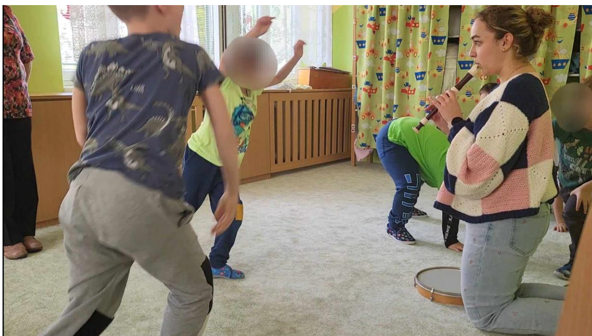
Obrázek 4 Pohybová reakce na změnu nástroje

Reflexe: Píseň se dětem moc líbila, naučily se ji rychle, určitě ji budeme ještě další dny opakovat, aby si ji zapamatovaly. Nejvíce je ale nadchla pohybová hra. Všichni na změny nástrojů reagovali okamžitě. Vymyslely velice zajímavé taneční kroky, tím byl cíl této aktivity splněn a podobné aktivity budu využívat s dětmi nadále. Je vhodná pro děti všeho věku, mohou se přidat i nějaké další podmínky, které děti budou muset dodržovat, jako jsou např. konkrétní kroky, více nástrojů.