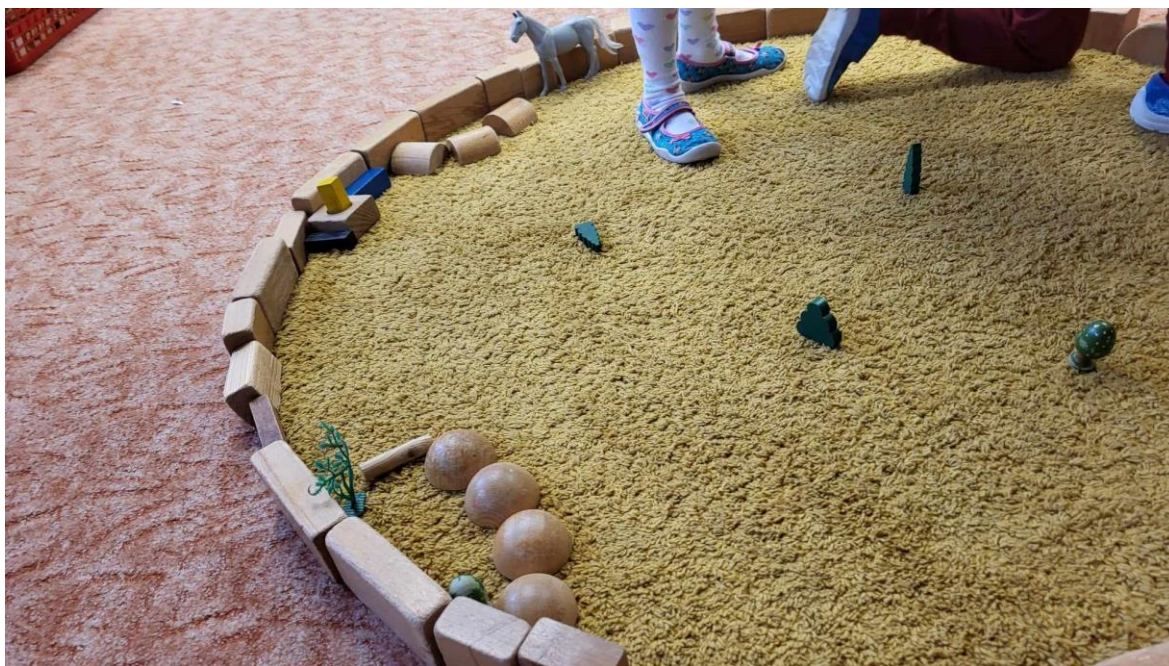
III. Příloha 3 – Noty Bude zima (zdroj: Šimanovský a Tichá, 2007)