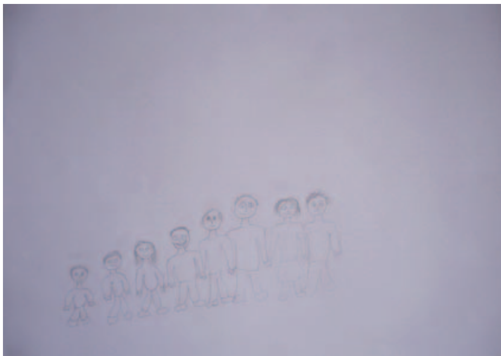
Obrázek 8. Respondent č. 4, kresba reálnej rodiny