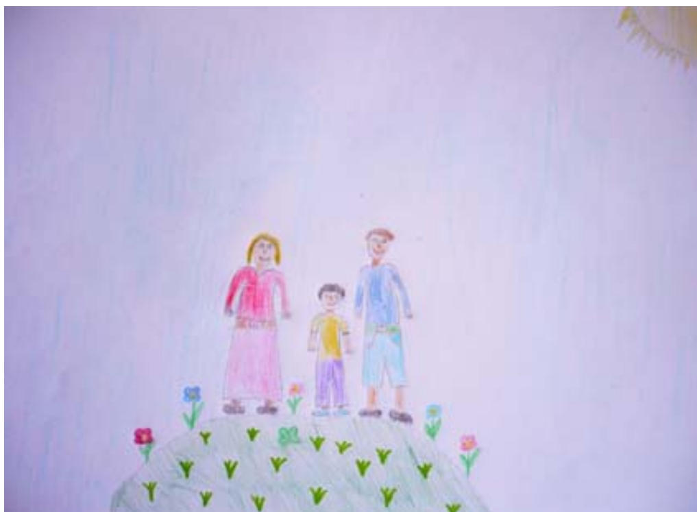
Obrázek 3. Respondent č. 2, kresba ideálnej rodiny