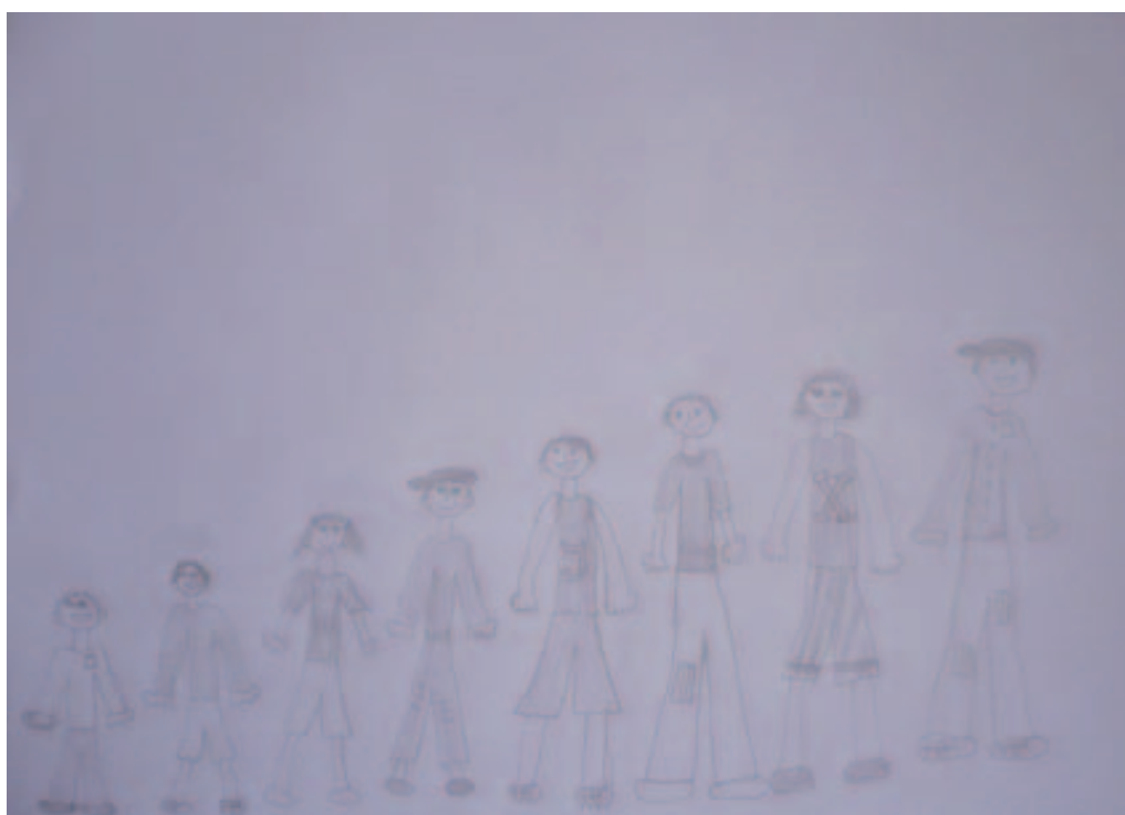
Obrázek 6. Respondent č. 3, kresba reálnej rodiny