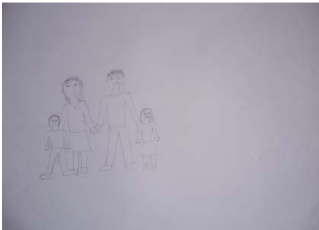
Obrázek 7. Respondent č. 4, kresba ideálnej rodiny