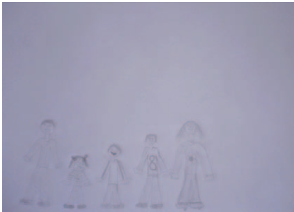
Obrázek 5. Respondent č. 3, kresba ideálnej rodiny