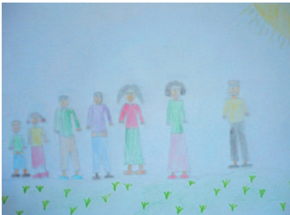
Obrázek 4. Respondent č. 2, kresba reálnej rodiny