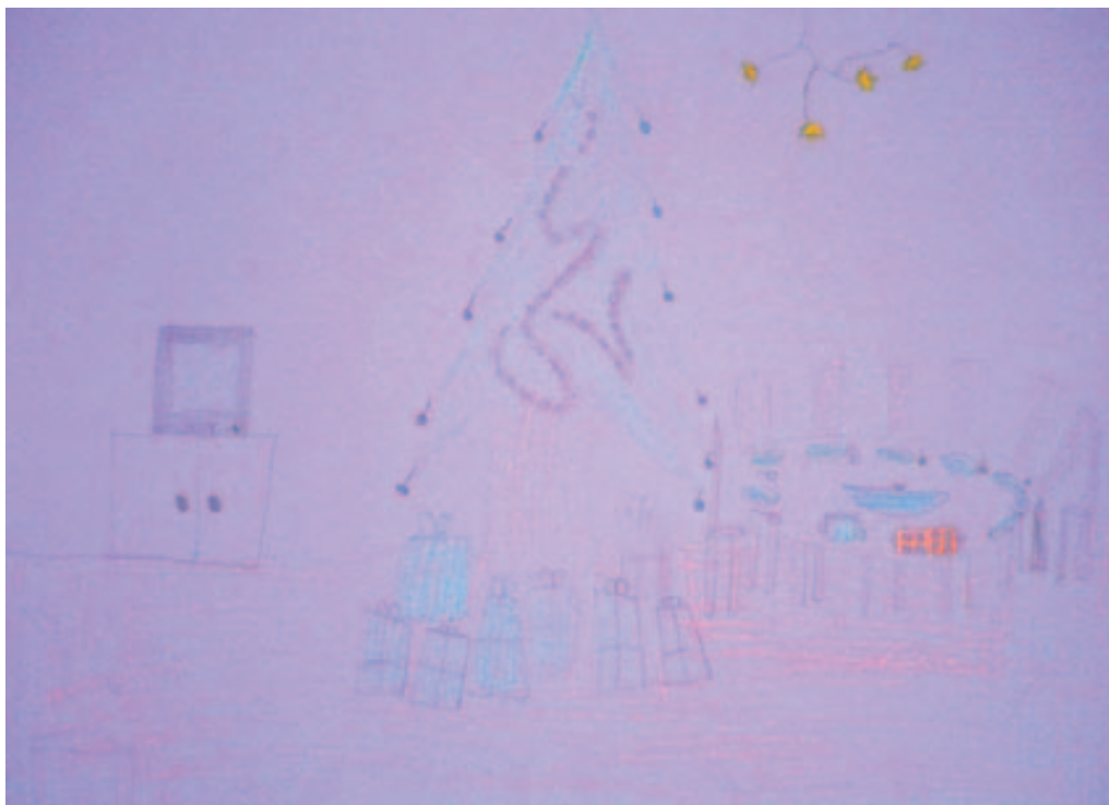
Obrázek 2. Respondent č. 1, kresba reálné rodiny