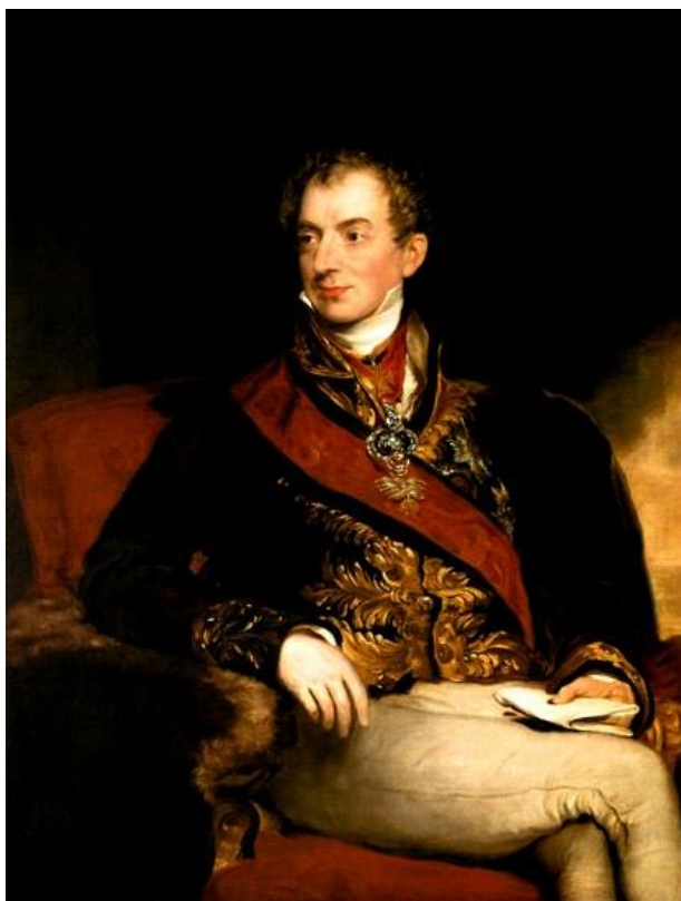
Obrázek 6. Klemens Václav Nepomuk Lothar kníže Metternich (1773–1859)