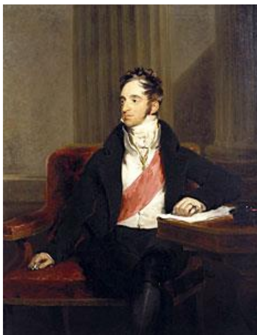
Obrázek 5. Hrabě Karel Robert Nesselrode (1780–1862)