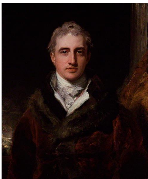
Obrázek 7. Robert Stewart, vikomt z Castlereaghu (1769–1822)