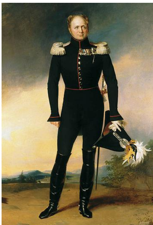
Obrázek 3. Alexander I. (1777–1825)