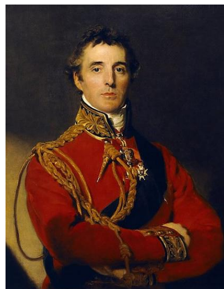
Obrázek 9. Arthur Wellesley, vévoda z Wellingtonu (1769–1852)