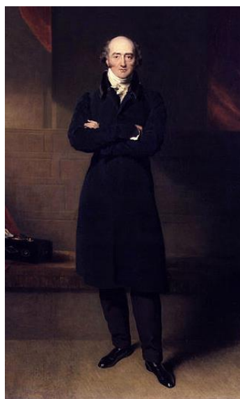
Obrázek 8. George Canning (1770–1827)