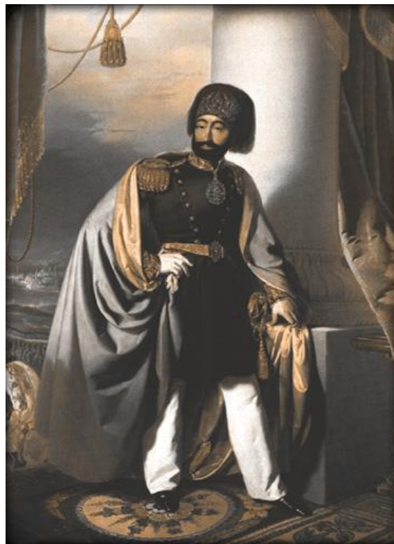
Obrázek 2. Mahmud II. (1789–1839)