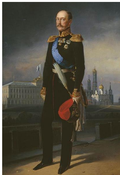
Obrázek 4. Mikuláš I. (1796–1855)