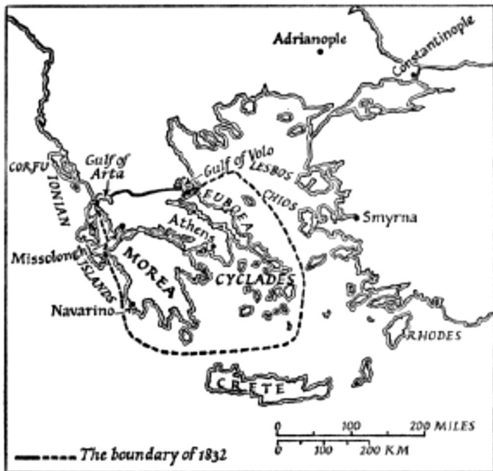
Obrázek 13. Vzniklý nezávislý řecký stát