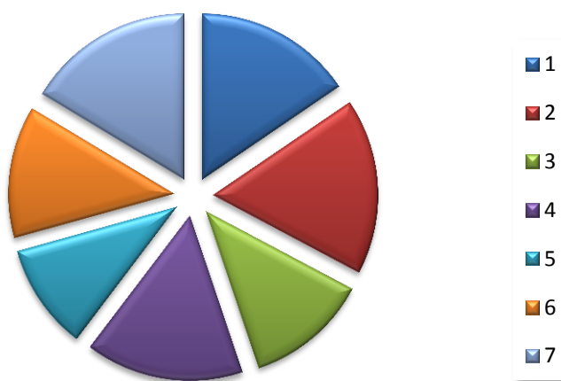
Graf 1 Úroveň aktivity činitelů na jednotlivých stupních řízení