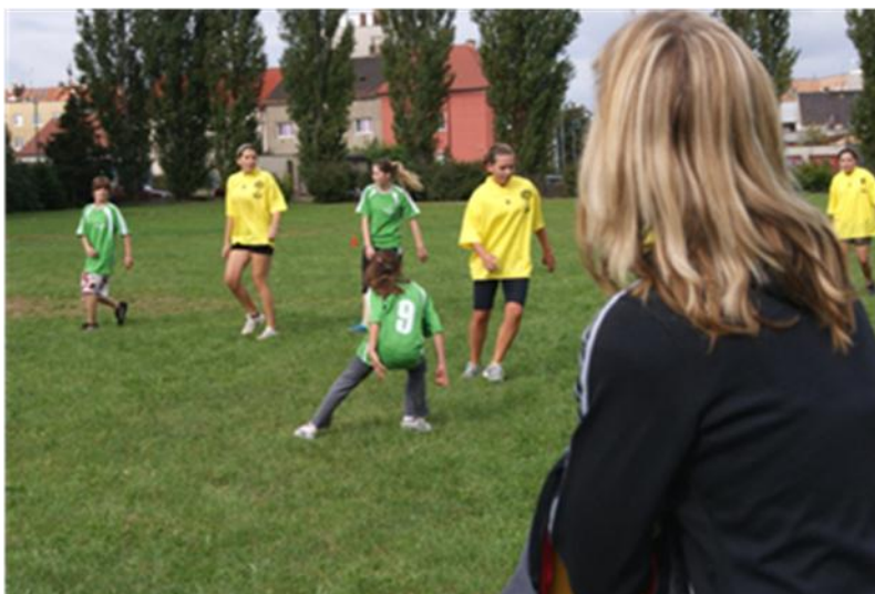
Obrázek 4 Dívčí kopaná byla středem pozornosti diváků