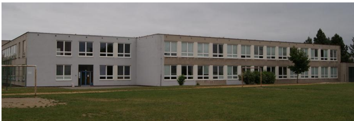
Obrázek 1 14. Základní škola

Sportovní pohybové hry vůbec mají v lidském životě důležitou roli. Především dětem bychom měli předkládat širokou paletu pohybových aktivit, aby si vytvořily zdravý životní styl a pohyb se stal jeho pevnou součástí.