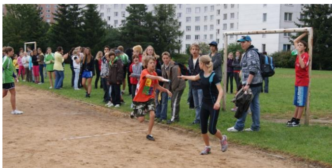
Obrázek 10 Štafetový běh

Určitou organizační chybou se stalo, že podél trati bylo málo traťových komisařů. Někdy se stávalo, že soutěžící při předbíhání soupeře i nechtěně vybočili z dráhy do prostoru trávníku a tím si sami sobě zkomplikovali svůj výkon. Nikdy se nevyskytlo nepřístojné chování soutěžících – použití loktů při předbíhání, strkání apod. Všichni běžci, dívky i chlapci se k sobě chovali s náležitou úctou a respektem. I přes tyto drobné nedostatky možno hodnotit tuto běžeckou disciplínu jako velmi dobrou, která splnila svůj nejen soutěžní úkol, ale i úkol společenský, kde se projevil smysl pro kolektivní soutěž společně s individuálním nasazením sportovců.