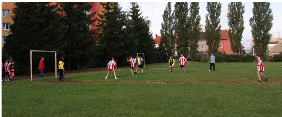
Obrázek 5 Fotbal chlapců

Přestože branky nebyly správných rozměrů, byli zmenšeného profilu, padalo hodně gólů. Přihlízející k turnaji, kteří byli většinou zaměstnanci škol – učitelé a zřizenci usilovně fandili svým oblíbeným a povzbuzováním je motivovali k dobrému výkonu.