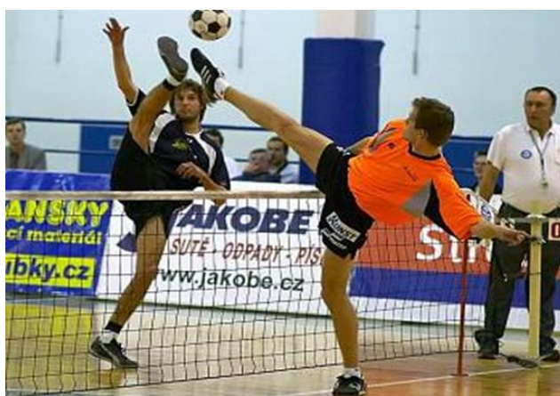
Obrázek 8 Nohejbal - ilustrační foto

Z celkové atmosféry, která se projevovala v tomto zápase, bylo zřejmé, že tento sport má mnoho nadšených příznivců, je velice po našem městě oblíben a do budoucna má zajištěnou velkou perspektivu. Protože k provozování tohoto sportu není zapotřebí velkého množství hráčů (na každé straně dva až tři hráči) může tento sport v některých případech být provozován i tam, kde dříve tradičně dominoval volejbal.