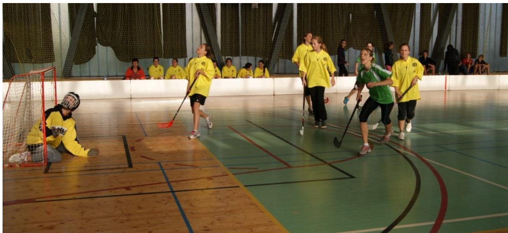
Obrázek 6 Florbal dívek

Ze způsobu chování hráček a hráčů na hřišti bylo znát, že evidentně ovládají pravidla hry, že učitelé tělocviku na základních školách věnují i teoretické výchově velkou pozornost.