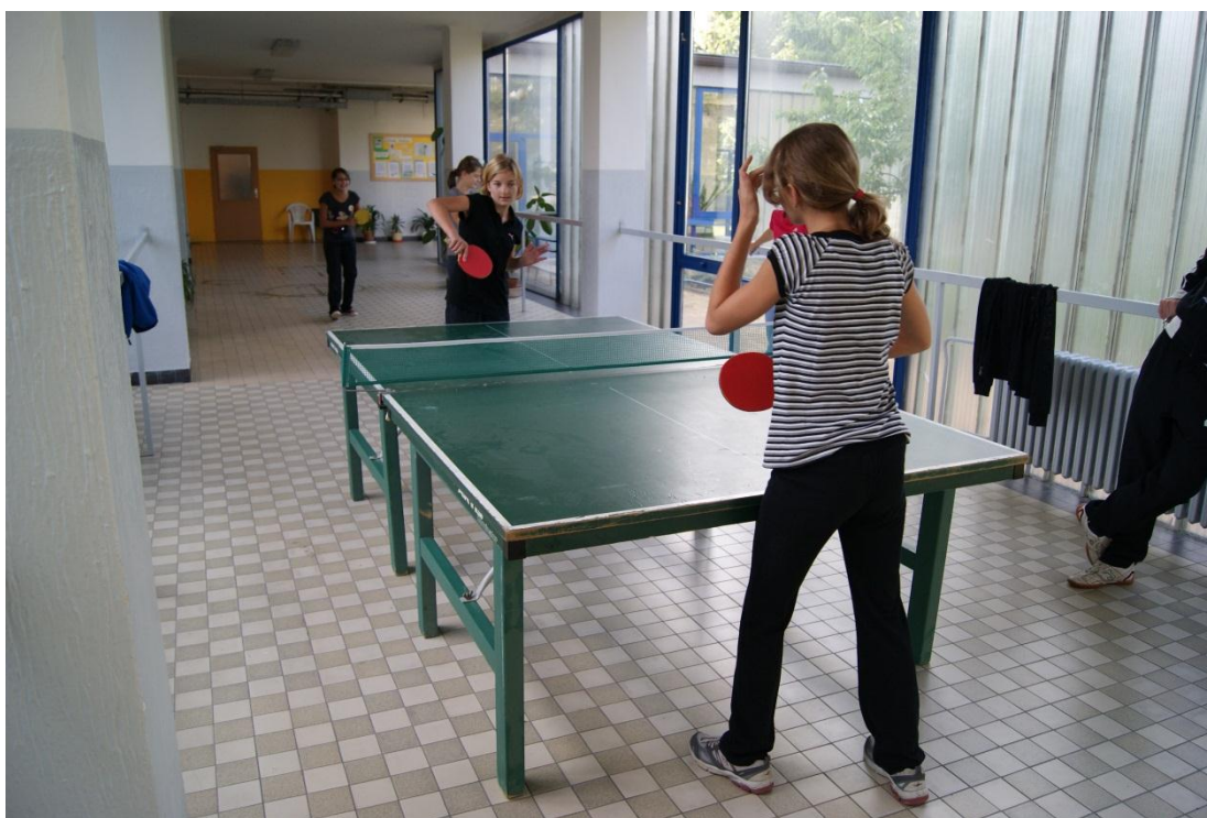
Obrázek 2 Chodby školy byly vhodné pro uskutečnění soutěže ve stolním tenise

14. ZŠ byla požádána, aby umožnila v prostorách školy umístit stoly pro stolní tenis (vhodné umístění ve spojovacích chodbách, které jsou dostatečně prostorné). Dále ředitelka školy přislíbila, že připraví do tělocvičny takové vybavení, které bude vhodné pro soutěž ve florbalu, nohejbalu a volejbalu (bylo splněno na sto procent).