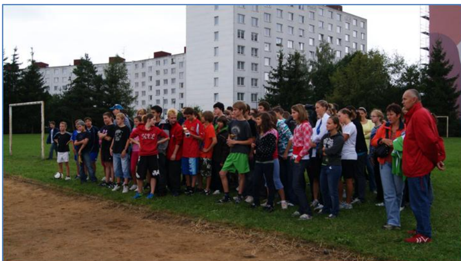
Obrázek 11 Nástup všech soutěžících sportovců k vyhodnocení soutěže