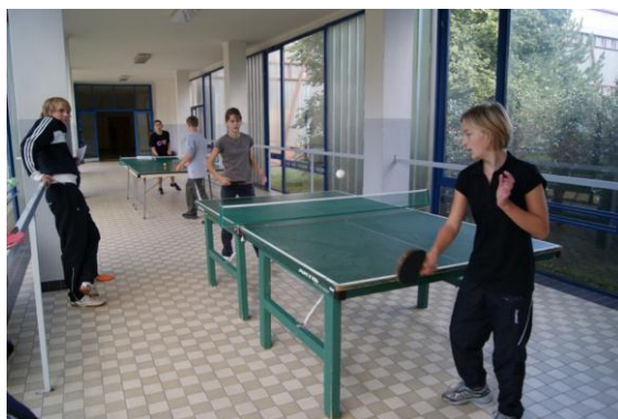
Obrázek 9 Stolní tenis chlapců a dívek

Soutěž ve stolním tenisu také ukázala, že škola, která nemá statut jakési výběrové školy a u které se nepředpokládá, že její žáci se zařazují do vzdělávané elity – 14. ZŠ, má v tomto soutěžním odvětví přinejmenším stejně kvalitní hráče, jako v gymnáziu. Proto jsem navrhl, několika žákům, aby se aktivně zapojili do sportovního oddílu Sokol Doubravka, ve kterém působí oddíl stolního tenisu, který se zúčastňuje oblastních soutěží se slušným výsledkem.