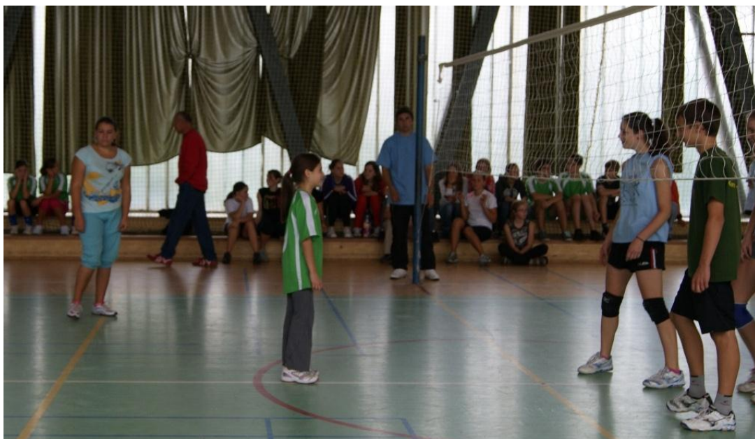
Obrázek 7 Volejbal smíšených družstev

Podle sdělení starých pamětníků bylo družstvo Sokola Plzeň Letná prvním družstvem v Evropě, které praktikovalo dvojbloky při bránění smečáře.