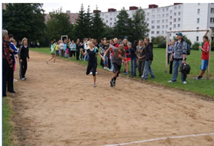
Obrázek 3 Povzbuzování při štafetovém běhu

Je jen škoda, že propagace těchto soutěží není úměrná významu. Soutěží se neúčastní široká veřejnost, jen někdy se na sportovní klání žáků dívají náhodní chodci. Do budoucna se organizátoři budou muset zamyslet nad lepší propagací těchto soutěží v místním tisku i v regionálním vysílání Českého rozhlasu. Určitě by se zvýšil význam těchto sportovně-kulturních soutěží, u žáků by stoupl větší zájem o účast v jednotlivých disciplínách. Školní výuka tělesné výchovy by dostala jiný společenský význam. Předpokládám, že do organizování sportovních her by se zapojili, třeba i formou pořadatelského dozoru, rodiče dětí.