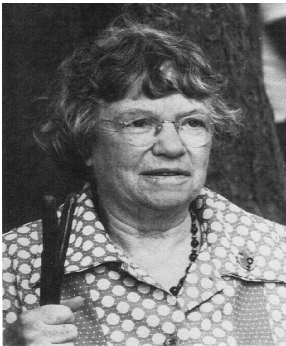
Obrázek č. 3: Margaret Meadová v roce 1976.

Zdroj: Métraux, Rhoda: 1980 – Margaret Mead: A Biographical Sketch. American Anthropologist , New Series 82: 2: 261.